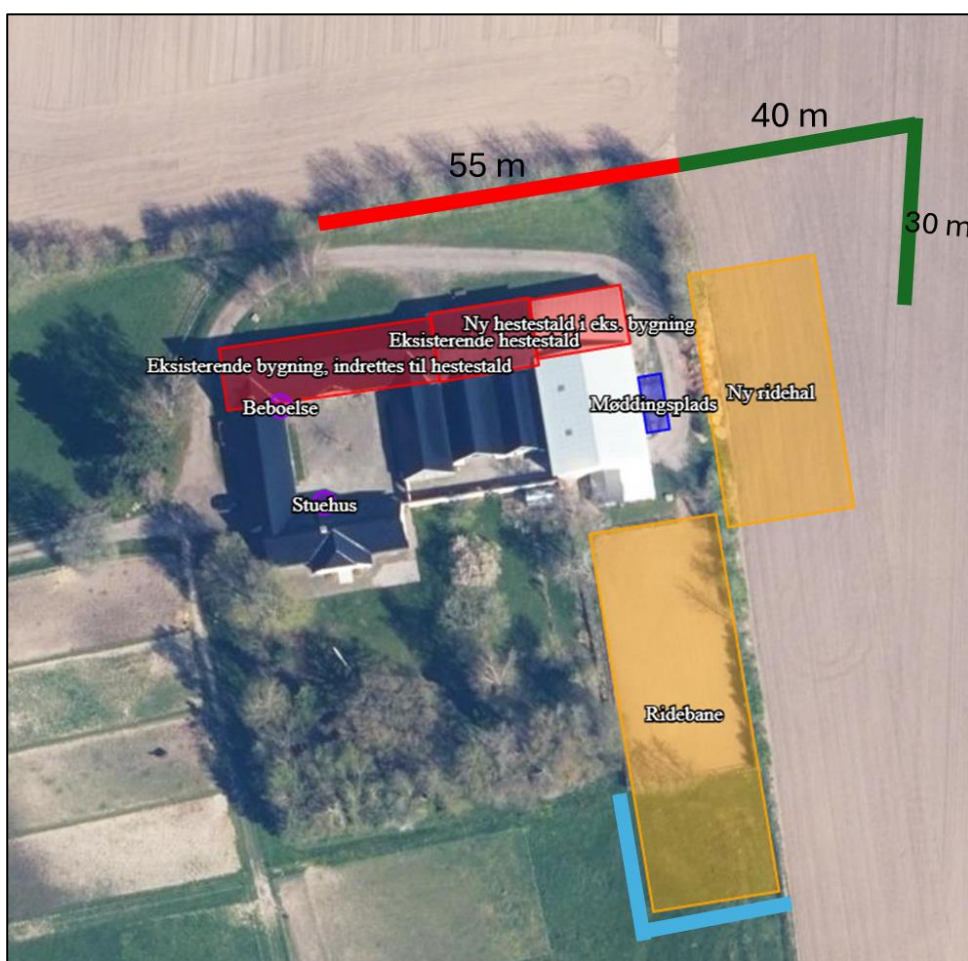
Figur 2. Placering af nyt beplantningsbælte omkring ridehal (grøn streg) og omkring udvidelsen af ridebanen (blå streg) samt eksisterende beplantning, som skal opretholdes og vedligeholdes (rød steg).

Desuden sættes der vilkår om, at ca. 55 meter af det eksisterende læhegn vest om det nyplantede læhegn opretholdes og vedligeholdes. Vilkåret sættes for at sikre, at denne beplantning ikke fjernes, da det ellers vil resultere i indkig til ridehallen.