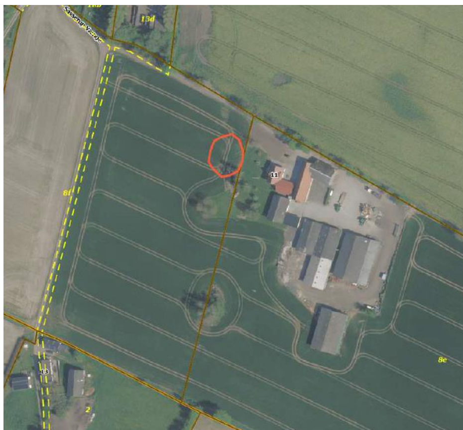
Figur 1: Søens omtrentlige placering

Det er en forudsætning, at søen anlægges i overensstemmelse med det ansøgte.