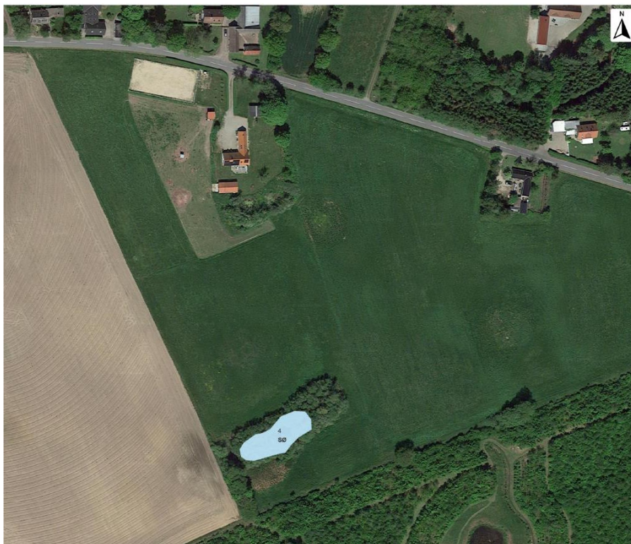
Figur 1: Sø Angivet med blå. Udformning og placering er vejledende.

Det er en forudsætning, at søen anlægges i overensstemmelse med det dette dokument.