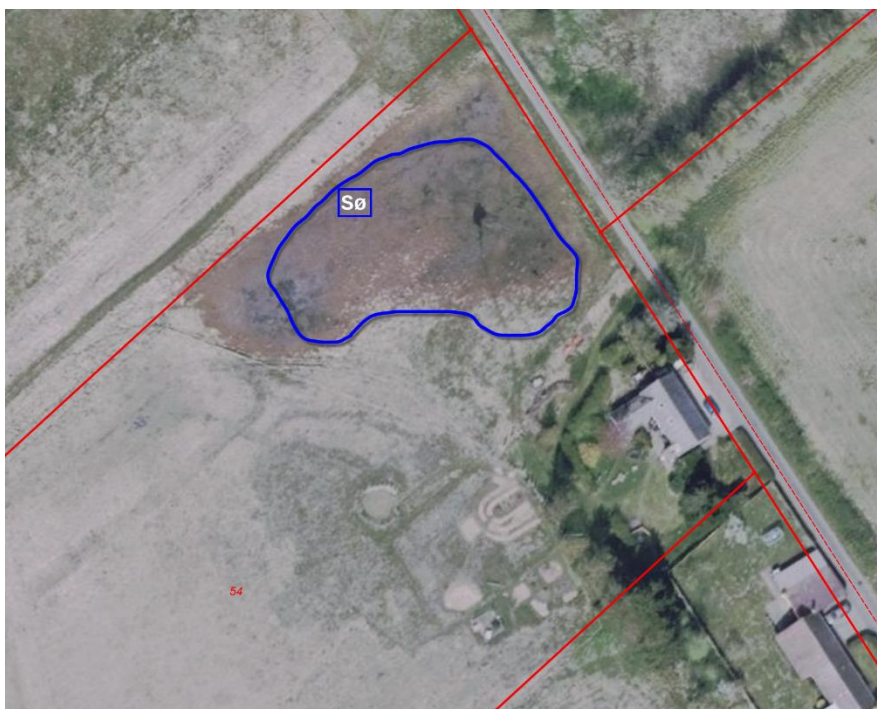
Figur 1: Sø Angivet med blåt. Udformning og placering er vejledende.

Det er en forudsætning, at søen anlægges i overensstemmelse med det dette dokument.