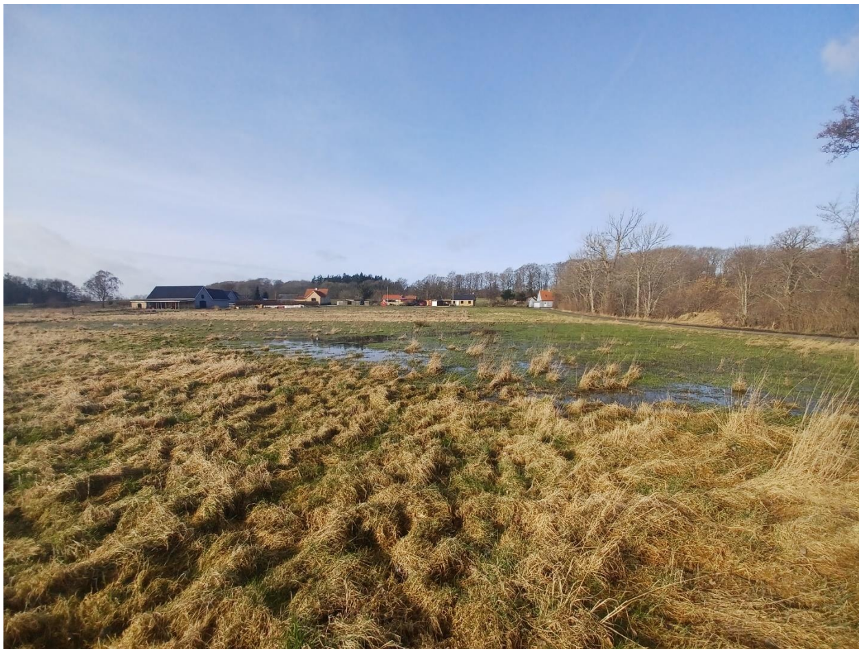
Figur 2: Billede af arealet fra besigtigelse d. 20. februar 2024.