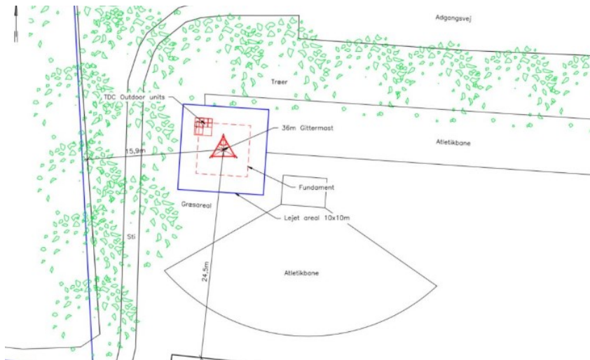
Skitse der viser hvor masten placeres i forhold til atletikbaner og beplantning