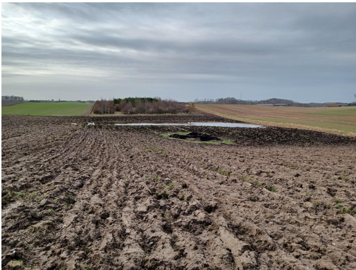
Figur 2: Billede af arealet fra besigtigelse d. 20. februar 2024.