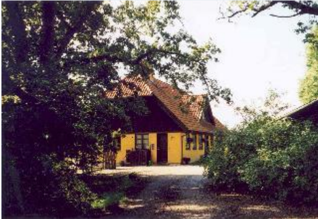
Foto: 19: Gryde Mølle, nuværende stuehus. Set fra vejen. Stort billede