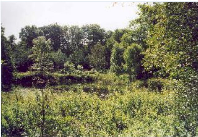
Foto: 20: Udsigt fra landevejen over tidligere fiskedam ved Kongens Mølle. Stort billede