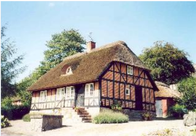
Foto: 13: Bindingsværkshus på vejen fra Grydemølle til Regstrup, flyttet til stedet 1938. Stort billede