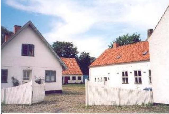
Foto: 6: Strids Mølle. Bygningerne omkring den brostensbelagte gårdsplads. Stort billede