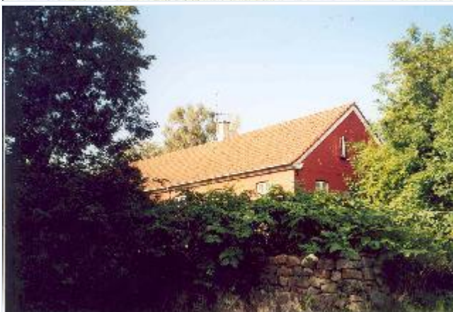
Foto: 21: Hovedbygningen til Kongens Mølle. Set fra åsiden – sydvest. Stort billede