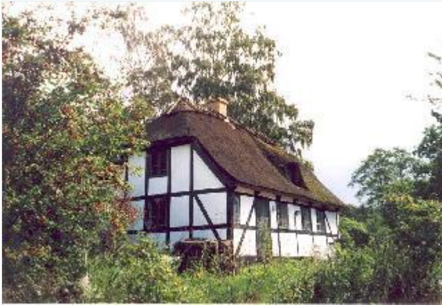
Foto: 9: Velbevaret bindingsværkshus fra ca. år1850, ved vejen sydøst for Strids Mølle.