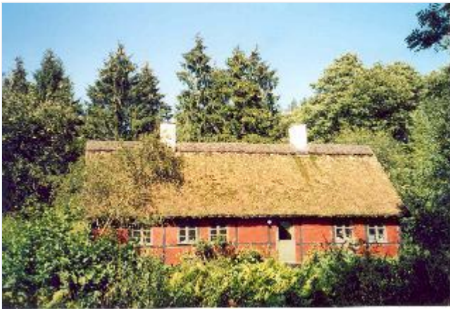
Foto: 23: Skovarbejderhus i bindingsværk ca. år 1840. Nord for Kongens Mølle. Stort billede