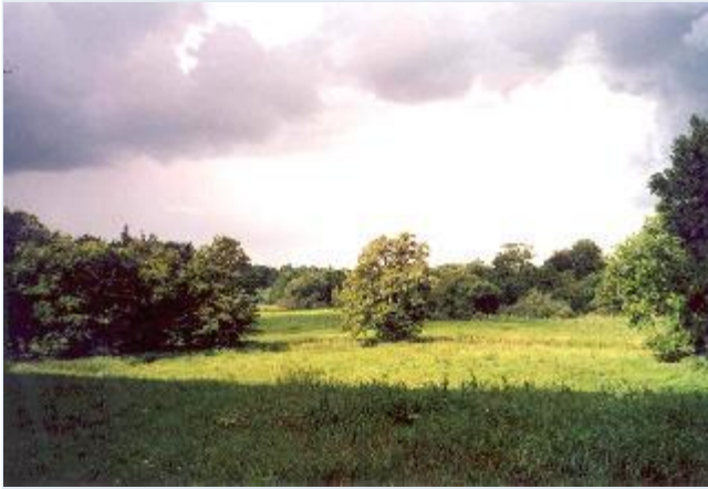
Foto: 1: Landskab nord for vejen til Øresø, udsigt mod vest til Træholm. Stort billede