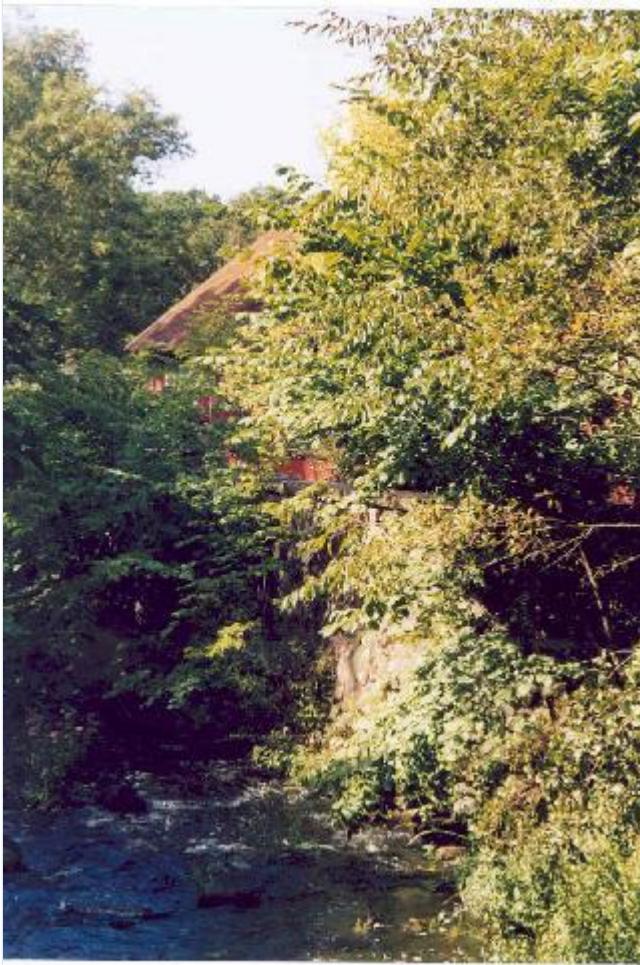
Foto: 11: Kig fra slusen mod vest. Med glimt af slusehuset fra 1800-tallet som tilhører Astrup Gods. Stort billede