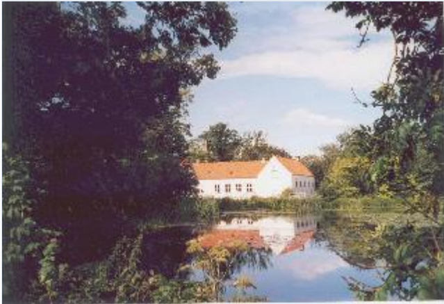
Foto: 5: Udsigt mod Strids Mølle. Udsigt over Mølledammen. Stort billede