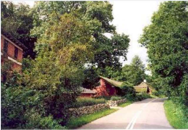
Foto: 2: Øresø Mølle – med direktørbolig – med direktørbolig yderst til venstre med tilhørende bebyggelse langs landevejen. Tilsammen et bevaringsværdigt miljø. Set fra øst. Stort billede