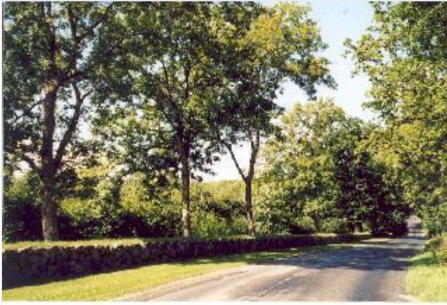
Foto: 18: Øst for Rangle Mølle, med dige langs landevejen. Set mod nordvest. Stort billede