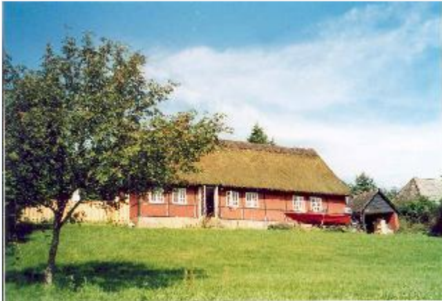
Foto: 12: Gartneriboligen, oprindelig under Regstruplund nu under Astrup. Ca år 1850. Set fra syd. Stort billede