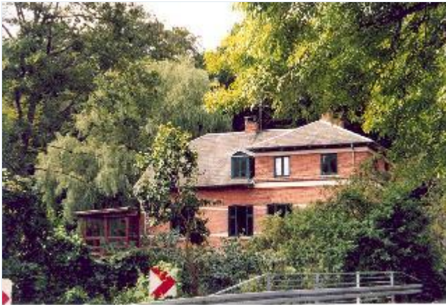
Foto: 3: Den velbevarede direktørbolig til Øresø Mølle. Opført ca. år 1890. Set fra øst. Stort billede