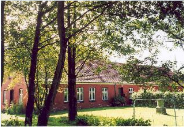
Foto: 22: Hovedbygningen til Kongens Mølle. Set fra nordøst. Stort billede