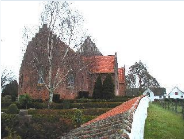
Foto: 1. Den store, senmiddelalderlige Skt. Søren's Kirke i Holmstrup, fra øst Stort billede