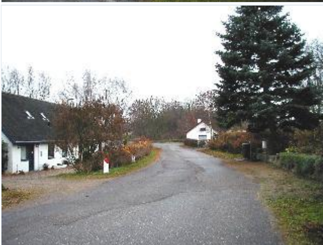
Foto: 4. Det gamle vejforløb gennem Holmstrup, fra nord Stort billede