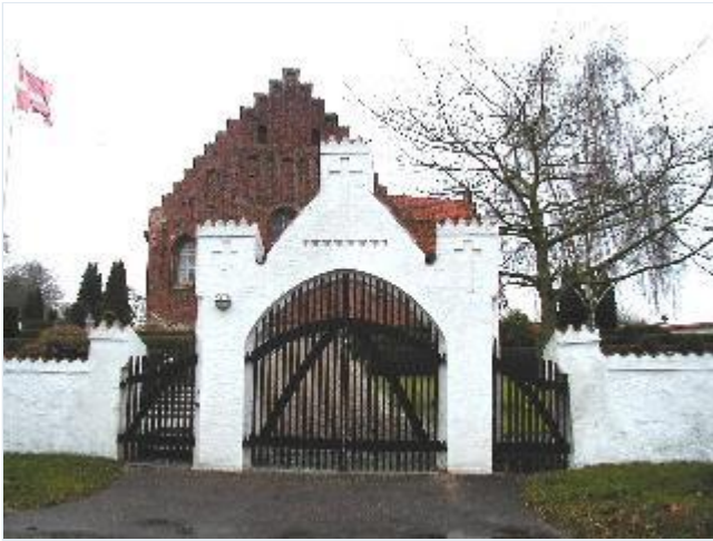
Foto: 2. Holmstrup Kirkes østlige kirkegårdsportal, fra øst Stort billede