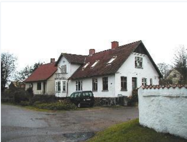
Foto: 3. Huse ved kirken langs den gamle vej gennem Holmstrup, fra nordøst Stort billede