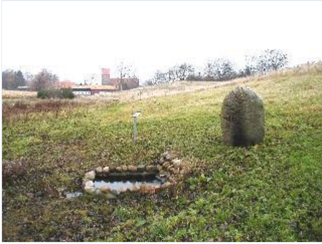
Foto: 5. Den rekonstruerede helligkilde syd for Holmstrup Kirke, fra syd Stort billede