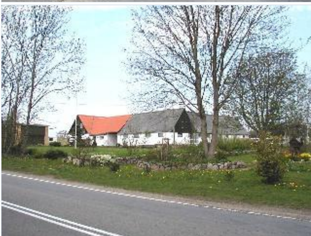
Foto: 8. Nordvestligste gård, tofteskel og -gærder Stort billede