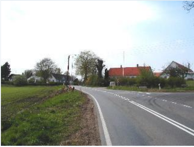
Foto: 1. Østlige indkørsel i landsbyen, tidl. smedie og østligste gård Stort billede