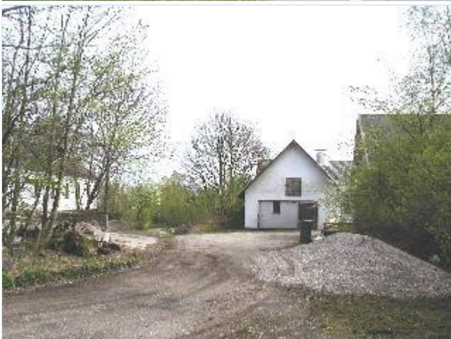
Foto: 4. De store gårde i den sydlige del Stort billede