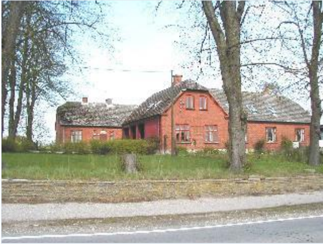
Foto: 2. Den tidligere skole lidt øst for landsbyen Stort billede