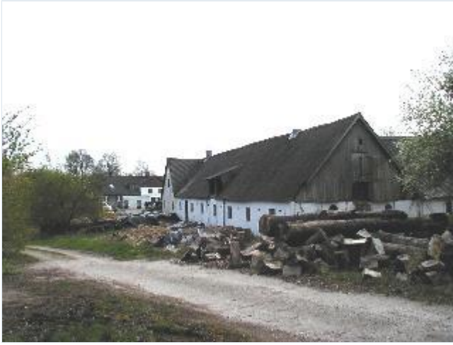
Foto: 5. Gårde i den sydlige del langs det sydlige stræde Stort billede