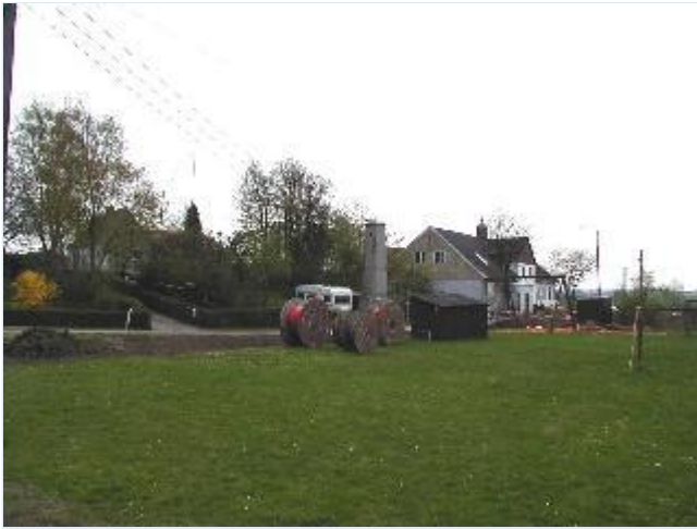
Foto: 6. Det tidligere mejeri med taglanterne sydøstligt i byen ved Tåstrupvej Stort billede