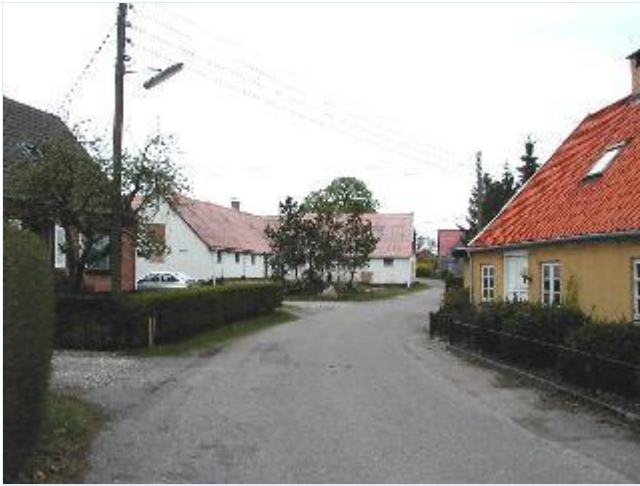
Foto: 6. Den nordlige landsbygade (Skovbakkevej) med næstnordligste gård og huse, fra syd