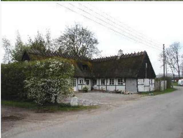
Foto: 4. Den tidligere smedie Stort billede