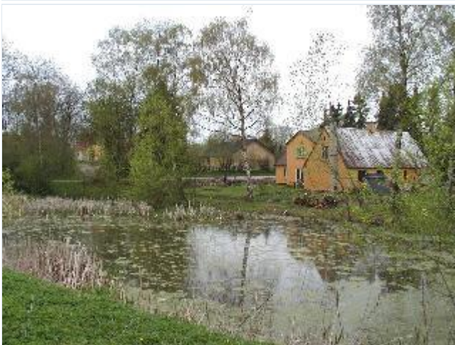
Foto: 3. Gadekæret og bebyggelse, fra sydøst Stort billede