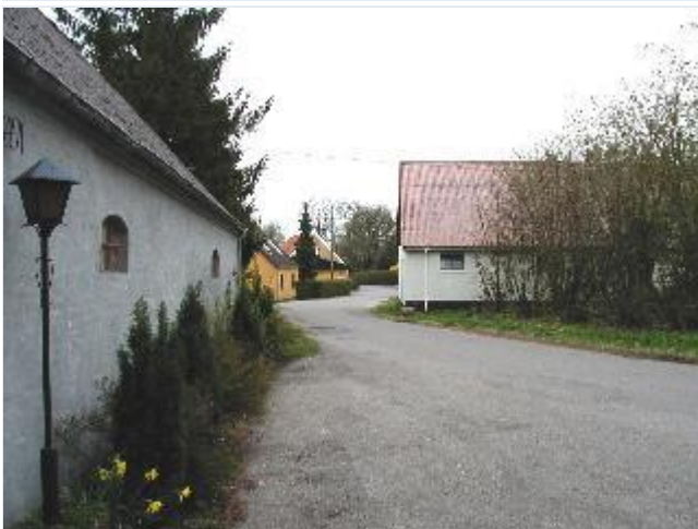
Foto: 7. Nordøstligste gård og nordlige gade (Skovbakkevej), fra nord