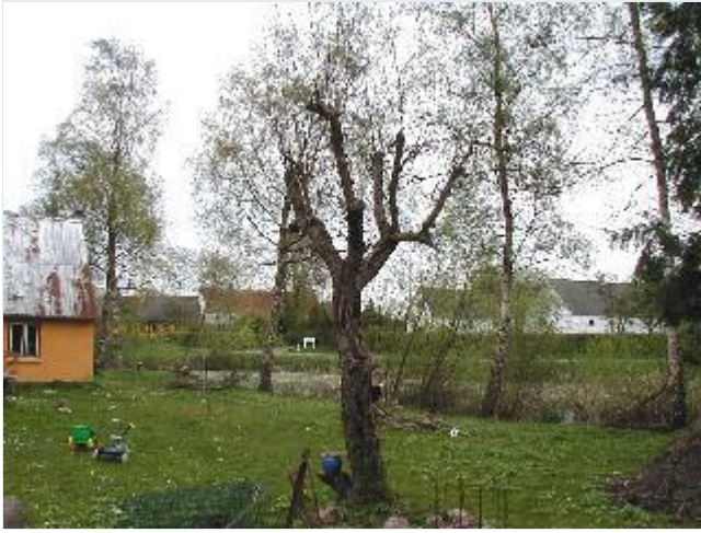
Foto: 5. Gadekæret og de sydlige gårde, mod sydøst