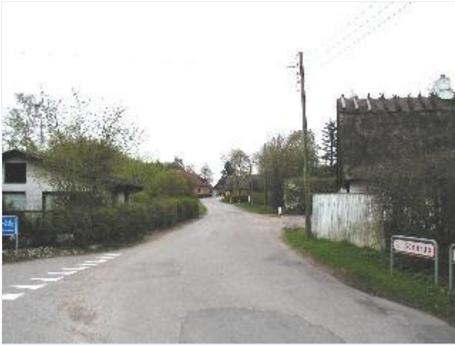
Foto: 2. Den sydlige gade (Højbjergvej) mod øst, tidl. smedie forrest mod syd Stort billede