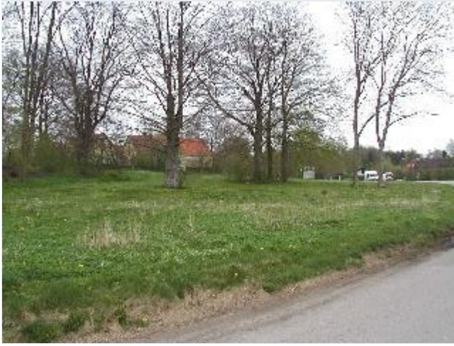
Foto: 1. Tomten for sent nedlagt/udflyttet gård samt den sydvestligste gård, fra sydvest Stort billede