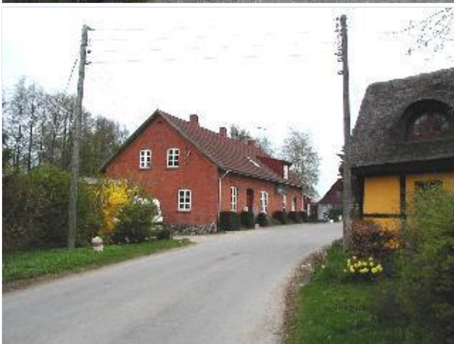
Foto: 8. Det tidl. baptistkapel på nordsiden af Højbjergvej østligt i byen, set fra sydvest