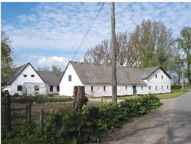
Foto: 7. Guldkildegård nordøstligst i byen, fra sydvest Stort billede