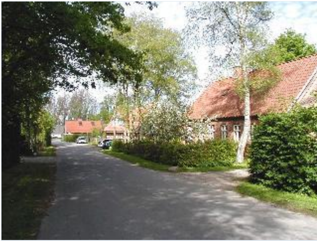
Foto: 6. Gård og tidl. smedie på østsiden af landsbygaden (Bårupvej) Stort billede