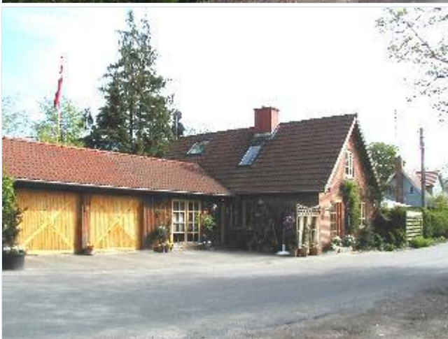
Foto: 8. Hus mellem Dyssehøjgård og den tidl. smedie på østsiden af gaden Stort billede