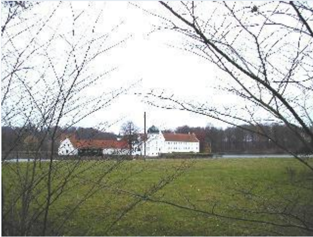
Foto: 1. Torbenfelds hovedbygning og staldgård oprindelig på hver sin holm i Torbenfeld Sø, fra nord