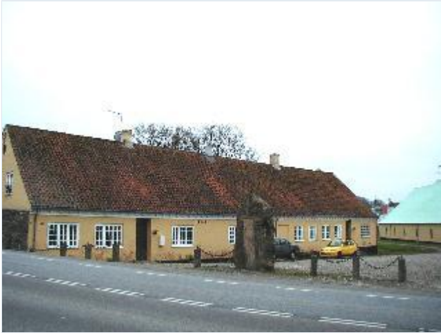
Foto: 7.Længen (1855 og 1883) med arbejderboliger ved avlsgården, fra nord Stort billede