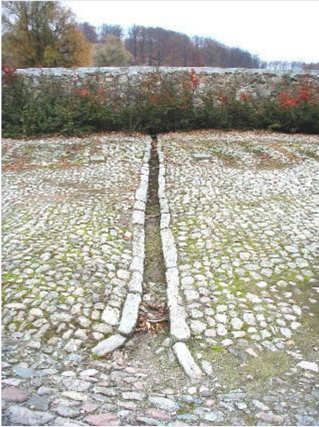
Foto: 4. Stensat afløbsrende i brolægningen foran det nu nedrevne vognhus ved staldgården, fra nord Stort billede