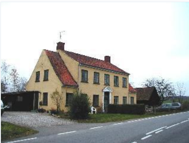
Foto: 13. Pyntelig arbejderbolig til flere familier overfor den tidligere Frydendal Mølle, fra sydvest Stort billede