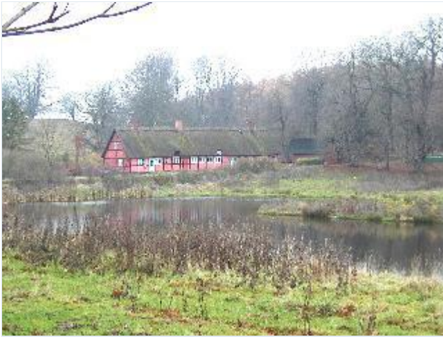
Foto: 12. En af Torbenfelds arbejderboliger i skovkanten med bindingsværk og stråtag, fra syd Stort billede