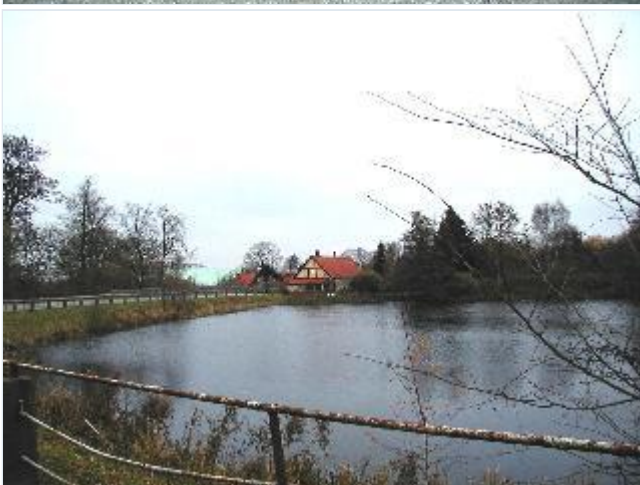
Foto: 10.Den højtliggende sø (oprindelig møllesø?) øst for gården og parken, fra sydøst Stort billede