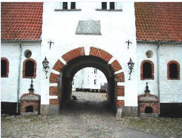
Foto: 3. Portpartiet (med hundehuse) i Torbenfelds staldgårdslænge nord for hovedbygningen, fra nordøst