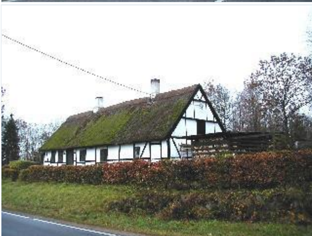
Foto: 14. Skovløberhus under Torbenfeld, beliggende i den sydlige del af ejerlavet, fra nordøst Stort billede