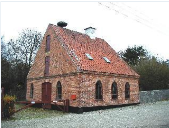
Foto: 9.Torbenfelds smedie, oprindelig opført 1633, men genopført efter brand 1668, nu arbejdende museum, fra vest Stort billede