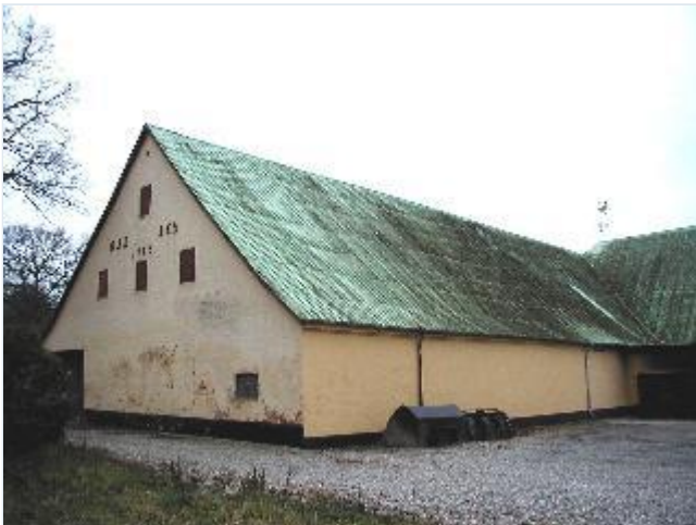
Foto: 6. Den store tiendelade fra 1785 i avlsgårdskomplekset, fra nord Stort billede