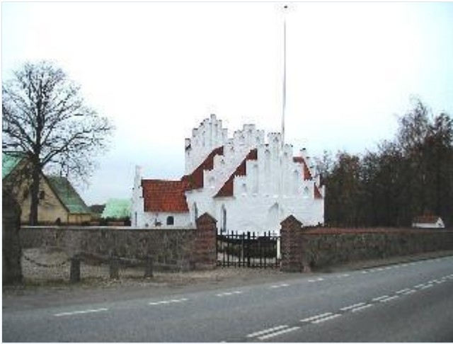
Foto: 8.Den lille senmiddelalderlige Frydendal kirke, oprindelig borgkapel for Torbenfeld, fra øst Stort billede