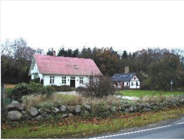
Foto: 11. Godsets skovriderbolig fra ca. 1870, fra nord Stort billede