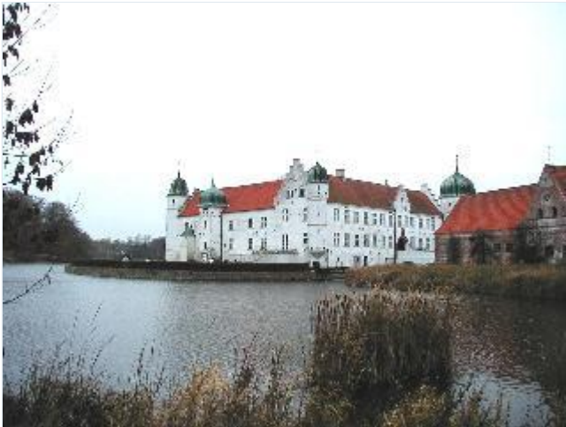
Foto: 2. Torbenfelds firefløjede, hvidkalkede hovedbygning med hjørnetårne på sin holm i søen, staldgården til højre, fra øst