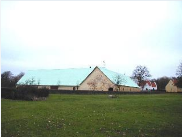
Foto: 5. Den store, gulkalkede avlsgård med tiendeladen (nærmest) fra 1785, kirken og arbejderboliger bagved til højre, fra syd Stort billede