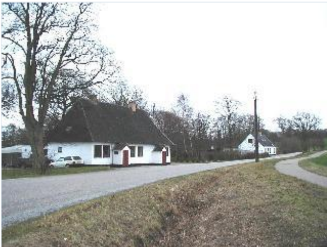
Foto: 3.Dobbelte landarbejderboliger, Sct. Thomas Huse, hvor også smedien lå, på Knabstrupvej nord for hovedgården, fra nord