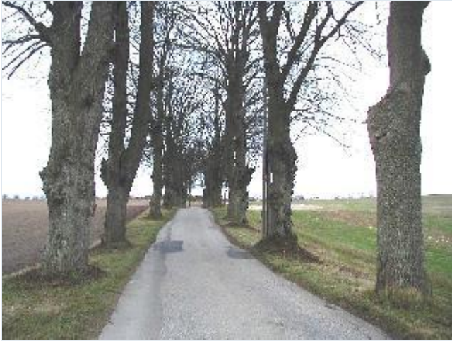
Foto: 10. Den smukke allé fra Knabstrup til Dramstrup, fra vest Stort billede