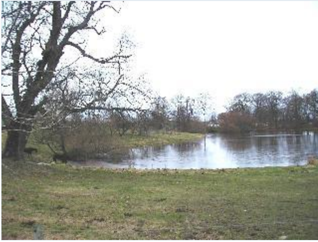
Foto: 9. Lille sø i græsningsoverdrev nord for hovedgårdsanlægget, fra syd Stort billede