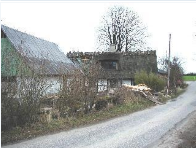
Foto: 4.Tidligere ledhus, Kejserhus, ved Knabstrups hovedgårdsdige mod Dramstrup, fra vest