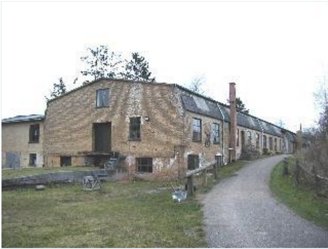
Foto: 6. Del af fabriksanlægget ved teglværket, fra vest