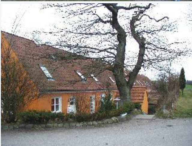
Foto: 8. Lang længe med boliger parallelt med den gamle række arbejderboliger nord for, fra øst