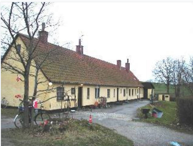
Foto: 7. Lang længe med boliger for arbejdere ved teglværk og lervarefabrik, fra øst