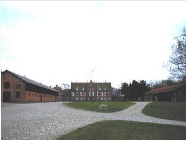
Foto: 1.Hovedgårdsanlægget på Knabstrup med den tilbagetrukne hovedbygning fra 1861 (arkitekt Vilhelm Dahlerup) og avlsgården øst for den store forplads, fra nord