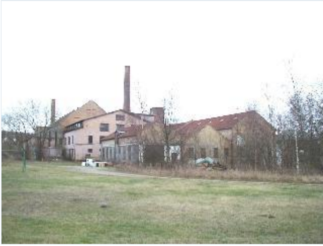
Foto: 5. Det tidligere Knabstrup teglværk, oprettet i 1856, lervare- og flisefabrik, anlagt i 1907, syd for hovedgårdsanlægget, fra nord