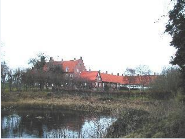
Foto: 2.Hovedbygningen med ældre sidebygninger i bindingsværk, fra syd