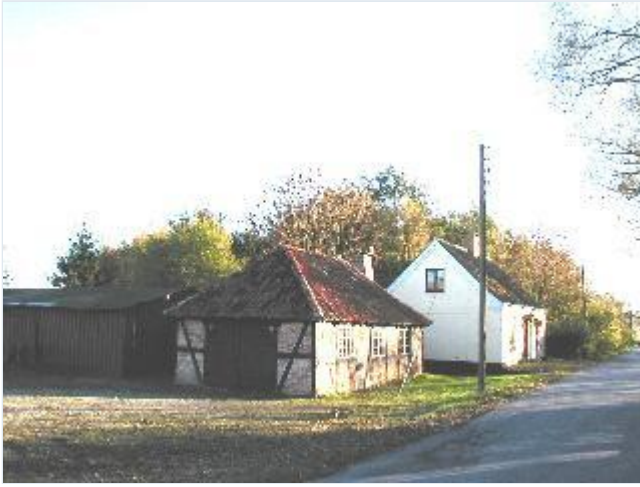
Foto: 6. Aggersvolds gamle smedie nordøst for avlsgården, fra nord Stort billede