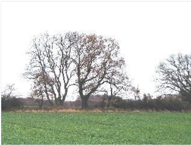
Foto: 14. Det markante hovedgårdsdige med store gamle træer, der afgrænser hovedgårdsjorden mod de omliggende ejerlav, fra sydvest Stort billede