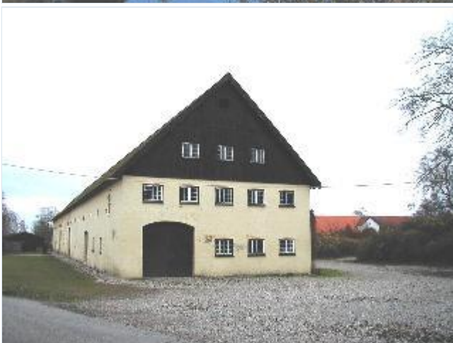
Foto: 5. Den store ladebygning nordligst i Aggersvolds avlgård, fra nordvest Stort billede