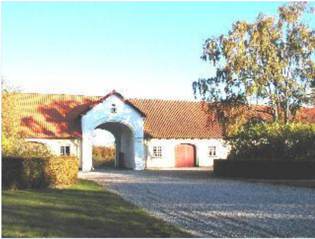
Foto: 3. Aggersvolds avlgårds østlige længe med portgennemkørsel, fra vest Stort billede