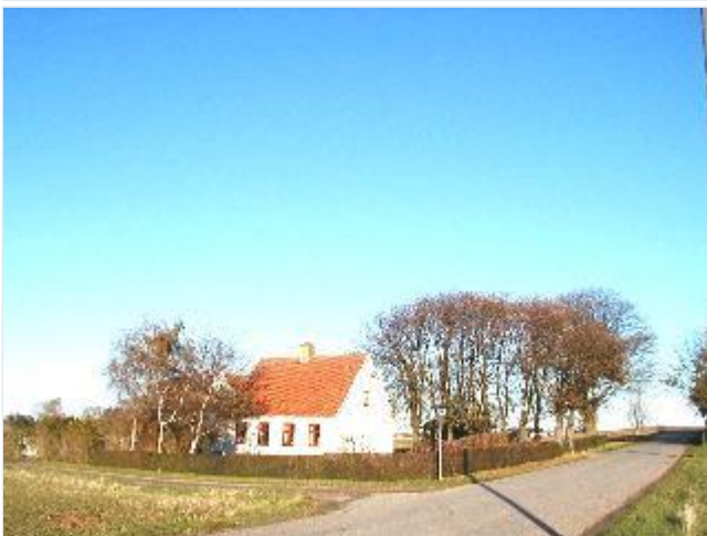
Foto: 12. Det sydøstligste af de små husmandssteder, der i 1920-erne og 30-erne blev udstykket fra Aggersvolds jorder, istandsat med stor respekt for bygningernes oprindelige karakter og de omgivende elementer som allé og hække, fra sydvest Stort billede