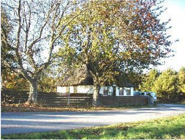
Foto: 7. Et af Aggersvolds små landarbejderhuse med helvalmet stråtag, Damhus, ved Aggersvoldvej, fra sydøst Stort billede