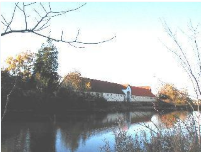
Foto: 4. Avlsgårdens østlige længe langs voldgraven/spejldammen øst for gården, fra sydøst Stort billede