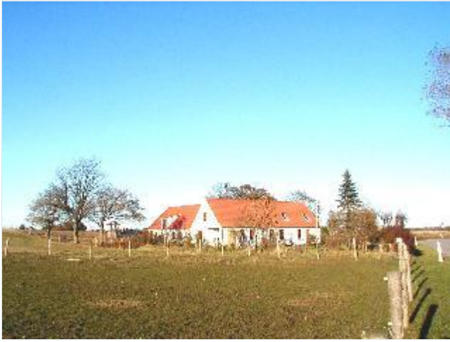
Foto: 10. Det vestligste af de husmandssteder, der i 1920-erne og 30-erne blev udstykket fra Aggersvolds jorder, fra sydvest Stort billede