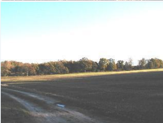
Foto: 9. Høed Skovs vestlige skovbryn med gamle løvtræer mod marken Fruens Fold, fra nordvest Stort billede