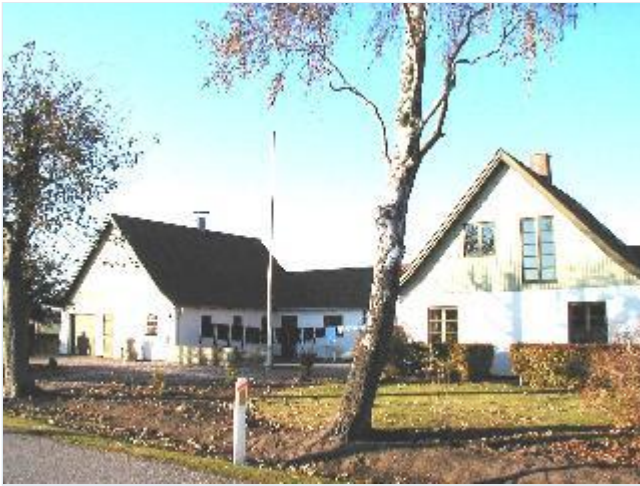
Foto: 11. Et af de husmandssteder, der i 1920-erne og 30-erne blev udstykket fra Aggersvolds jorder, fra sydøst Stort billede