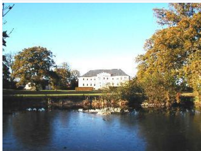
Foto: 1. Aggersvolds lysegule empirehovedbygning fra 1833 med plæner, store træer og dam i parken, fra syd