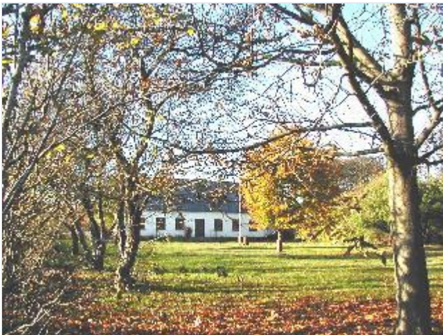
Foto: 8. Et af Aggersvolds større medarbejderhuse ved Aggersvoldvej, fra øst Stort billede