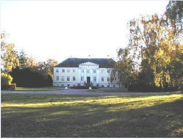
Foto: 2. Aggersvolds empire hovedbygning fra 1833, gårdfacaden, fra nord Stort billede