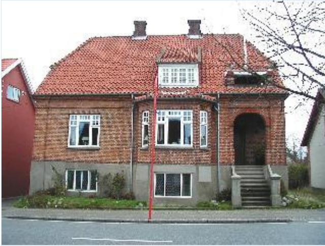
Foto: 25. Stor rødstensvilla på østsiden af hovedgaden/ Ringstedvej mellem banen og landevejskrydset, fra vest Stort billede