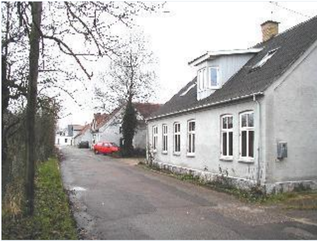
Foto: 15. Engvej nordøst for jernbaneoverskæringen med blandet bolig- og erhvervsbebyggelse (nu med moderne facadebehandling!) fra tiden omkring 1900, fra øst Stort billede