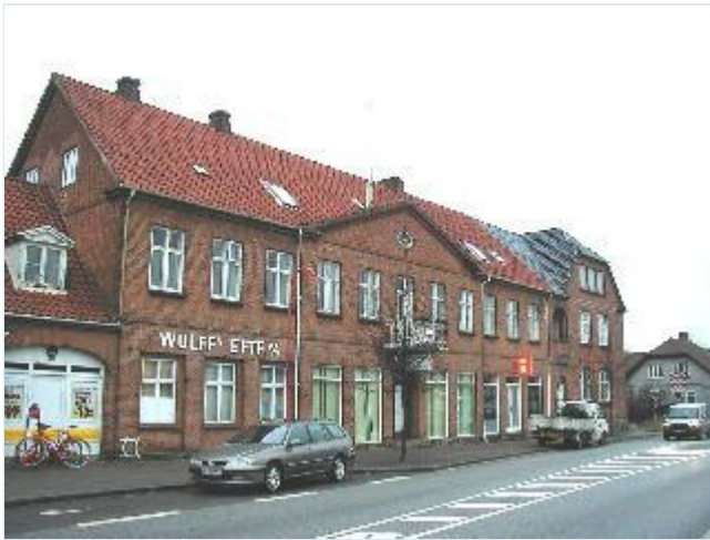
Foto: 6. Den store købmandsgård centralt beliggende ved hovedgaden over for kroen og for enden af stationspladsen, fra sydøst Stort billede