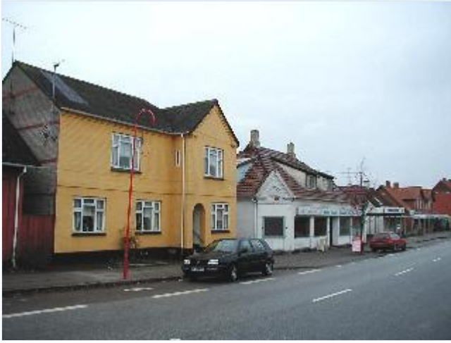
Foto: 24. Række af bygninger med flere etager eller butikker fra begyndelsen af 1900-årene i hovedgaden/ Ringstedvej syd for banen, fra sydøst Stort billede