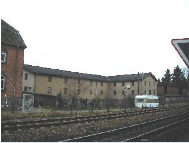
Foto: 7. Købmandsgårdens store lagerbygning langs jernbanen, fra nordøst Stort billede