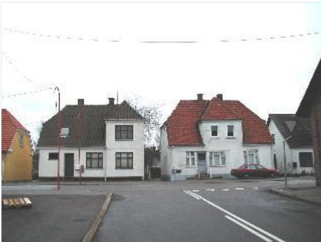
Foto: 26. Solide villaer på østsiden af hovedgaden/ Ringstedvej mellem banen og landevejskrydset, fra vest Stort billede