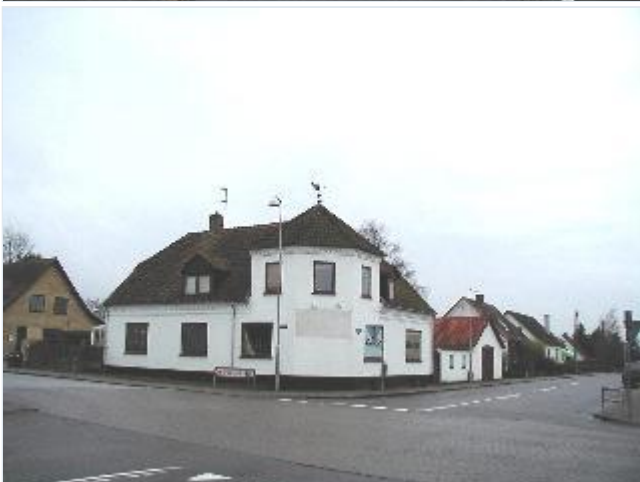
Foto: 27. Ejendom med tårnbygning, skråt afskåret hjørne og bagvedliggende udbygninger, tidligere butik, på sydvesthjørnet af landevejskrydset, fra nordøst Stort billede