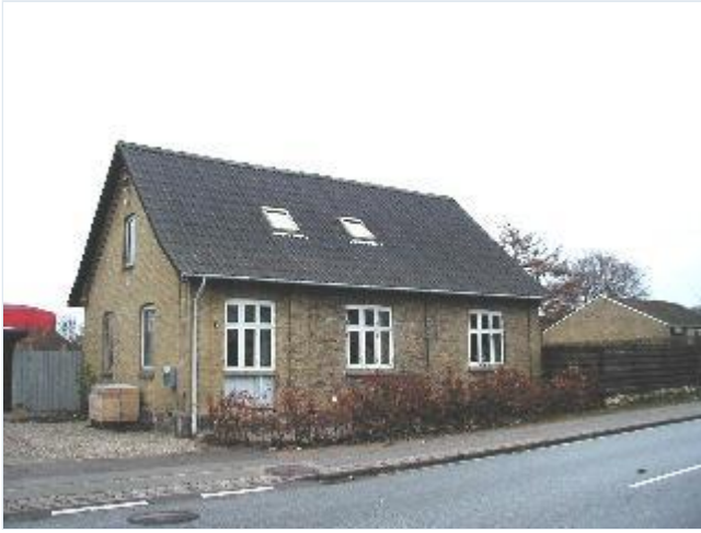
Foto: 28. Det tidligere jordemoderhus i egnens gule sten ved landevejskrydset, fra nordvest Stort billede