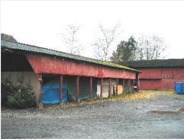
Foto: 10. En del af det store kompleks af træbyggede pakhuse og lagerbygninger bag den store købmandsgård, her vognhus, fra nordøst