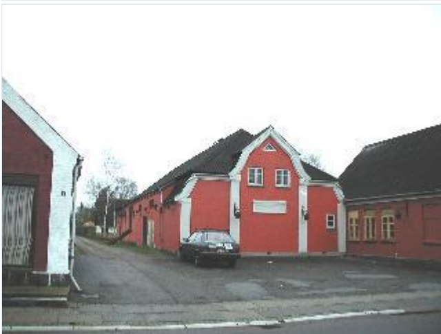
Foto: 4. Mørkøv Kros teaterbygning med pynteligt udformet gavlparti, fra nord Stort billede