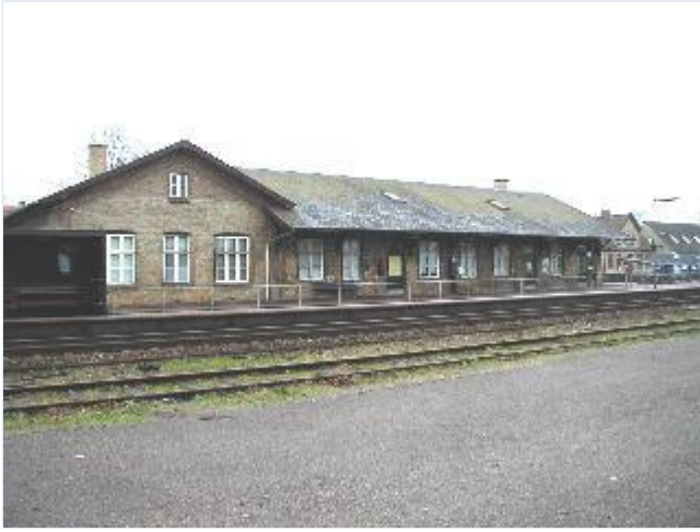
Foto: 2. Mørkøv Station (nu ude af brug) i egnens karakteristiske gule sten og med skifertag, med sin lange bygningsdel langs sporene og perronen, fra nordøst Stort billede