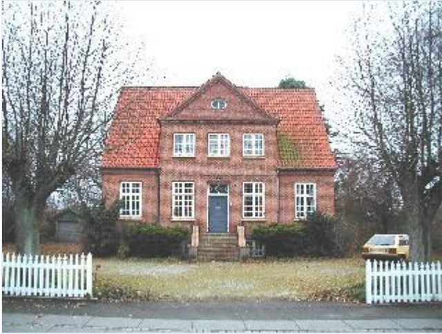
Foto: 29. Stor harmonisk rødstensvilla på vestsiden af hovedgaden/ Ringstedvej syd for landevejskrydset med velholdte detaljer, fra øst Stort billede