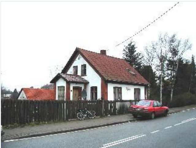
Foto: 12. Pyntelig lille bolig ved hovedgaden/ Nykøbingvej nordligt i byen, fra syd