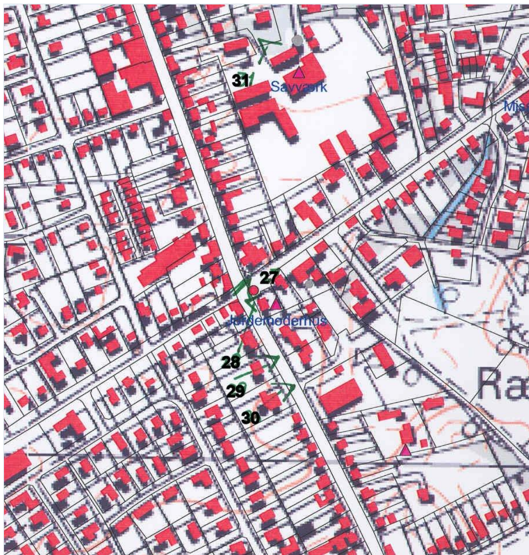
Foto: Kort: De sorte tal på kortet viser numre på fotografierne og hvor fotografierne er taget fra. Stort billede