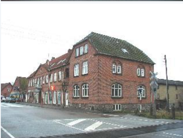
Foto: 5. Den store købmandsgårds forbygning ved hovedgaden og for enden af pladsen ved stationen, fra nord Stort billede