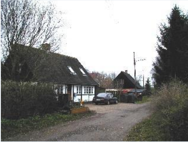
Foto: 11. Mindre boliger i bindingsværk i den vestligste del af bebyggelsen lige nord for banen, fra øst