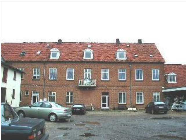
Foto: 8. Købmandsgårdens forbygning (med nyere uharmoniske vinduer) fra gårdsiden, fra vest Stort billede