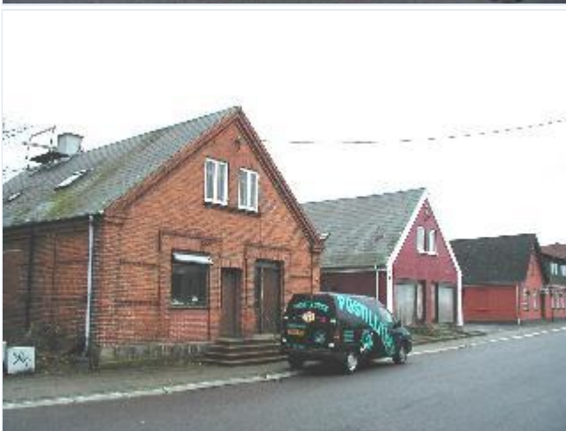
Foto: 19. To tidligere butikker skråt over for stationen med gavlene og butiksvinduerne mod Jernbanegade, fra nordøst Stort billede