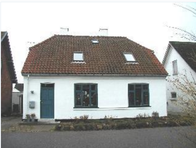
Foto: 22. En af de små, velholdte villaer på Nyvej nærmest stationen, fra vest Stort billede