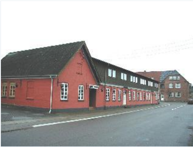
Foto: 3. Mørkøv Kro skråt over for stationen, fra nordøst Stort billede