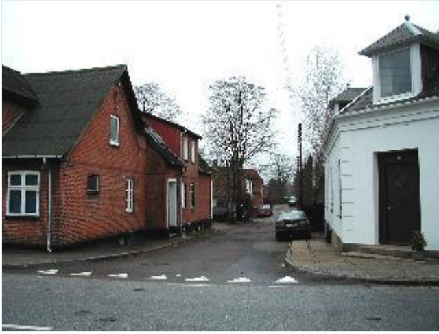
Foto: 14. Flørvej nordvest for baneoverskæringen med blandet bolig- og erhvervsbebyggelse fra tiden omkring 1900, fra øst Stort billede