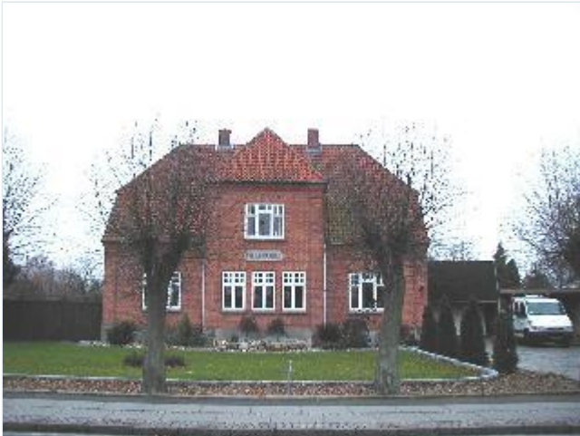
Foto: 30. Stor velproportioneret rødstensvilla på vestsiden af Hovedgaden/ Ringstedvej syd for landevejskrydset med velbevarede detaljer og nyere udbygning, fra øst Stort billede