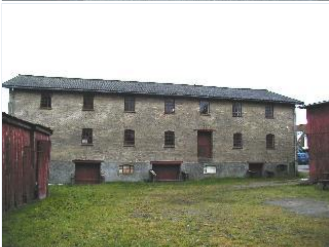
Foto: 9. Tværfløjen på købmandsgårdens store lagerbygning, fra gårdsiden, fra vest Stort billede