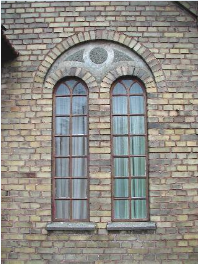
Foto: 17. Missionshuset Siloam på Engvej, vindue i sydfacaden, fra syd Stort billede