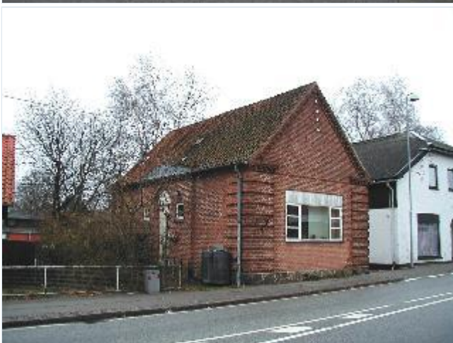
Foto: 23. Funktionel, velmuret rødstensbygning med fine detaljer (oprindelig elværk?), har bl.a. fungeret som butik på hovedgaden/Ringstedvej, fra nordvest Stort billede