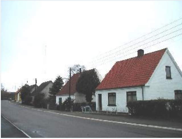
Foto: 20. Rækken af små med ryggen mod banen på Ibsvej, fra øst Stort billede