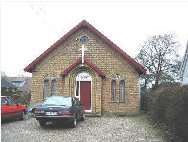
Foto: 16. Missionshuset Siloam på Engvej med smukke detaljer, fra syd Stort billede