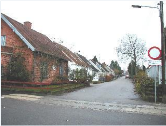
Foto: 21. Nyvej nærmest banen med ensartet bebyggelse af mindre villaer på østsiden, fra nord Stort billede