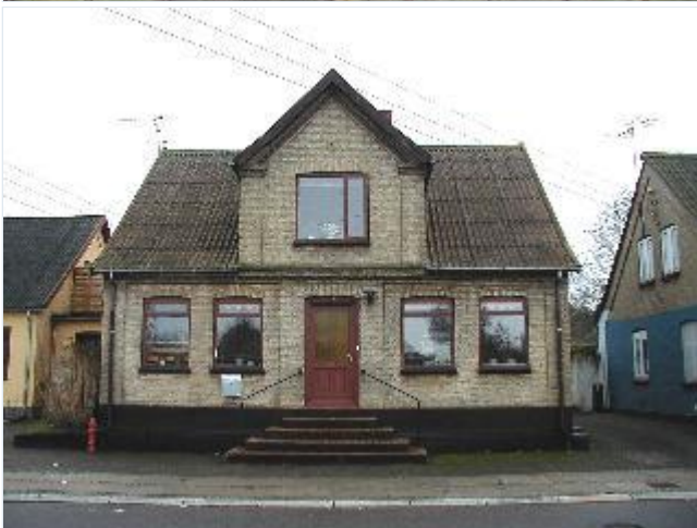
Foto: 18. Harmonisk bygning over for stationen på Jernbanevej, i de karakteristiske lokale gule mursten, fra nord Stort billede