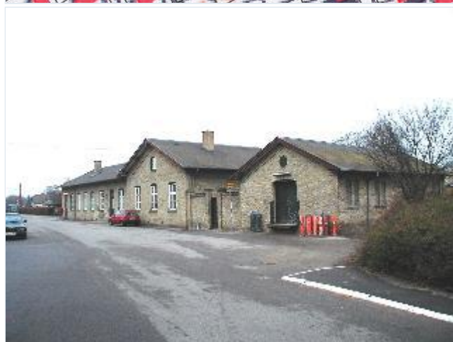
Foto: 1. Stationsbygningen (nu ude af brug) centralt i byen, fra sydøst Stort billede