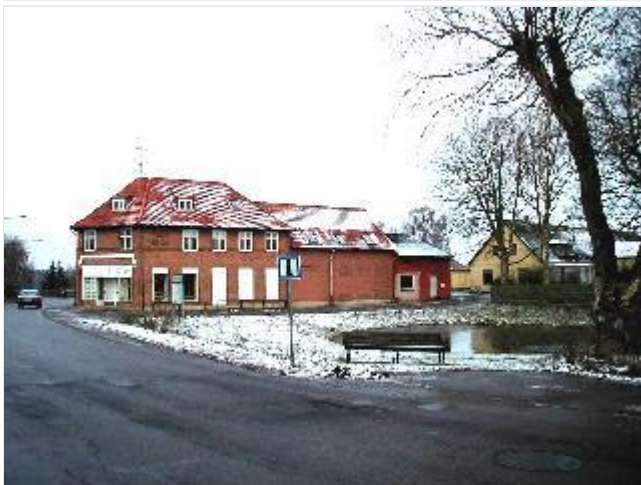
Foto: 3. Det lille gadekær midt i landsbyen med den tidligere brugs og andelsmejeriets bygninger bagved, fra sydvest Stort billede