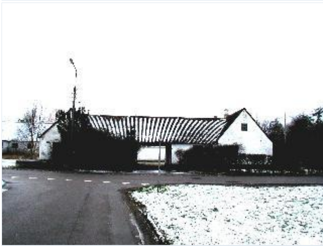
Foto: 10. Den nordligste af de tilbageværende gårde på vestsiden af landsbygaden (Udbyvej), fra øst Stort billede