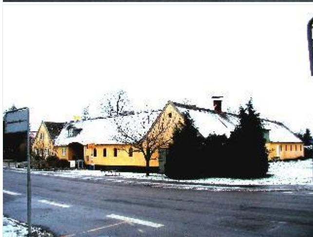
Foto: 14. Den midterste, firelængede gård på østsiden af bygaden, fra sydvest Stort billede