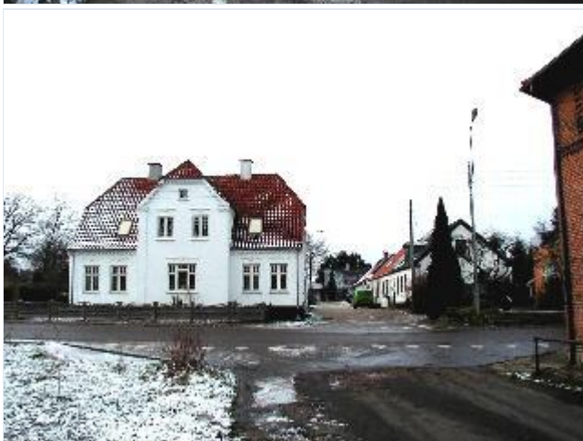
Foto: 12. Herskabelig villa på hjørnet af hovedgaden og et lille stræde med fine små arbejderhuse, fra øst Stort billede