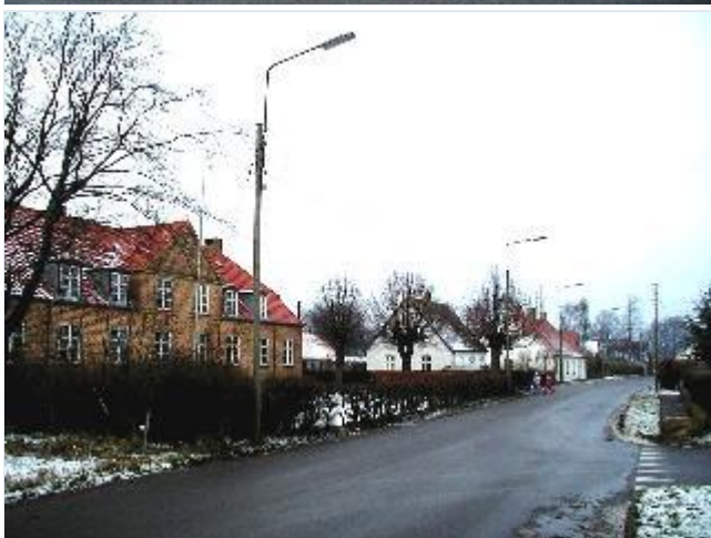
Foto: 8.Alderdomshjemmet fra 1934 i den sydlige del af byen, fra syd Stort billede