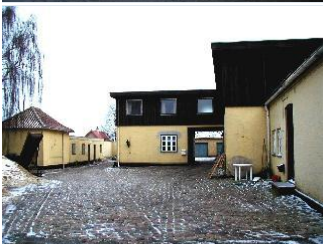
Foto: 4. Det tidligere andelsmejeris gård og bygninger bag den tidligere brugs, fra vest Stort billede