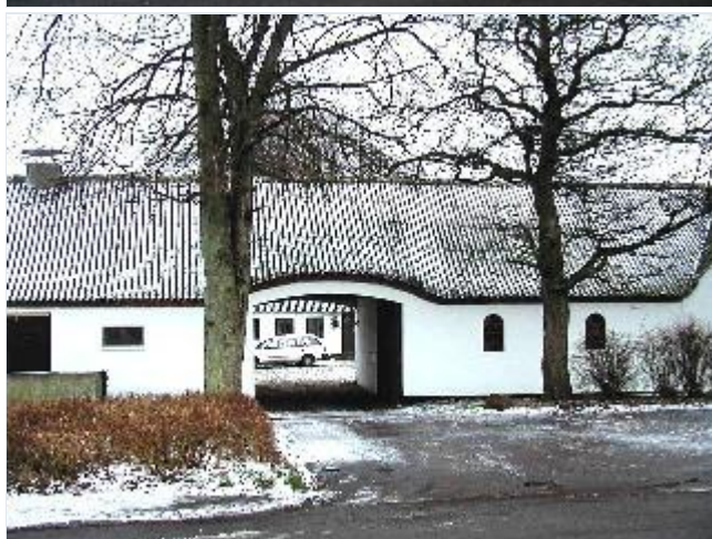
Foto: 16. Portåbning til gårdspladsen i den sydligste gård på østsiden, fra vest Stort billede