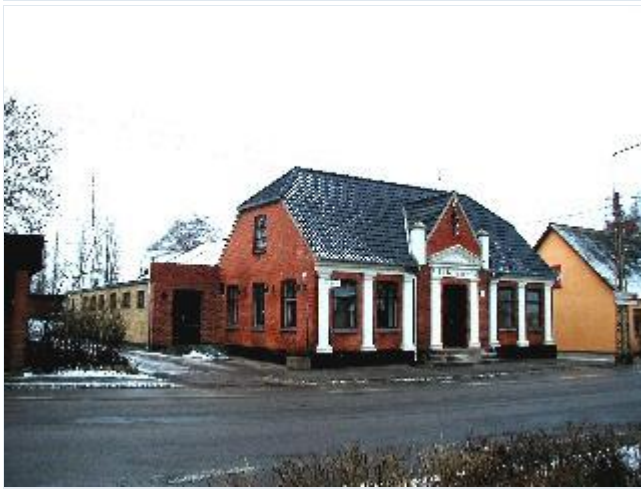
Foto: 6.Udby Forsamlingshus fra 1897 med pynteligt forhus med hovedindgang fra gaden, fra sydøst Stort billede