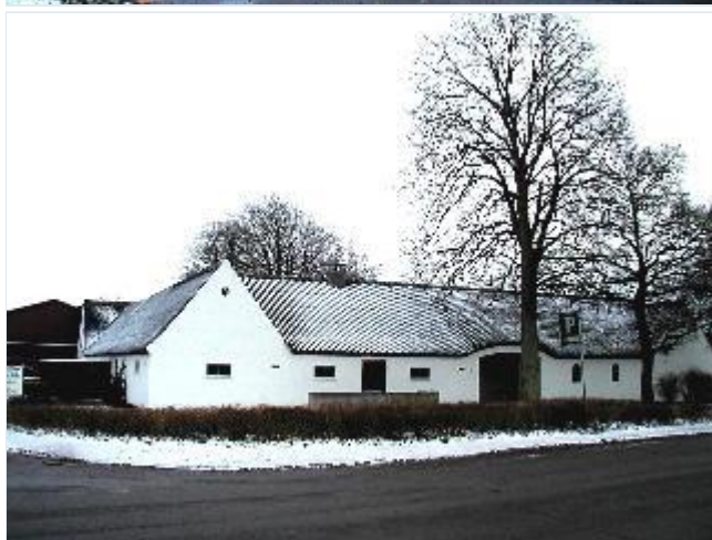
Foto: 15. Den sydligste af de tilbageværende gårde i byen, på hjørnet af Udbyvej og Staslundevej over for forsamlingshuset, fra nordvest Stort billede