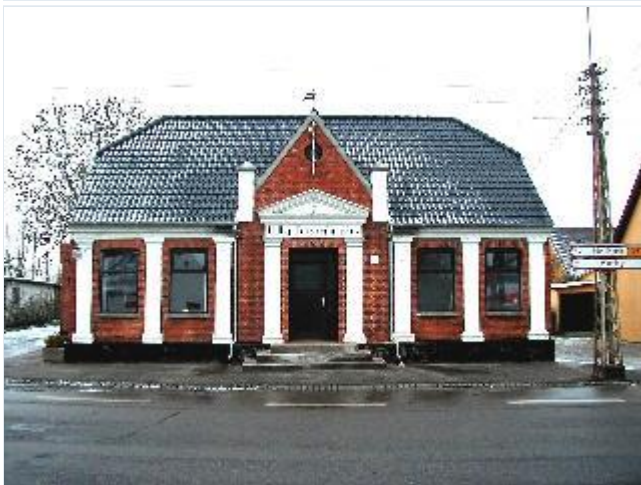
Foto: 7.Forsamlingshusets facade med hvide pilastre og klassicistisk indgangsportal, fra øst Stort billede