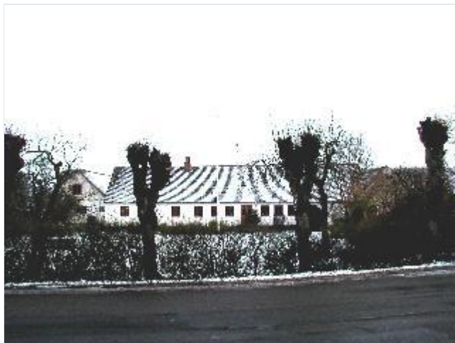
Foto: 13. Den nordligste tilbageblevne gård på østsiden af bygaden, fra vest Stort billede