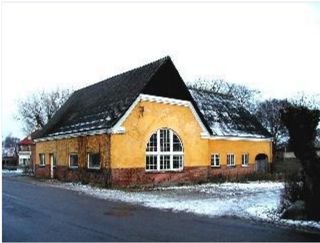
Foto: 5.Landsbyens tidligere elværk syd for gadekæret, fra sydvest Stort billede