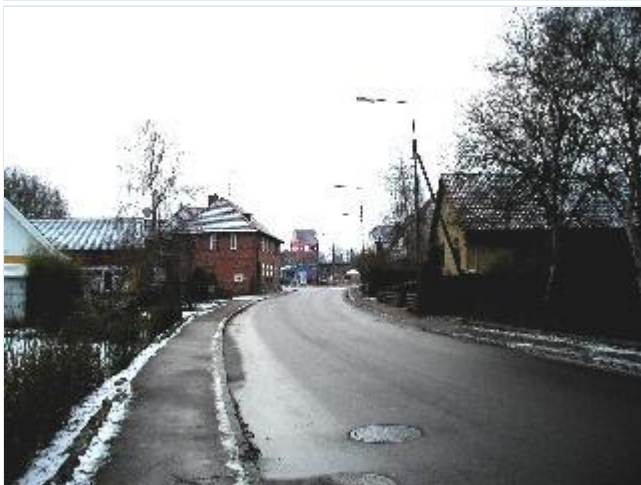
Foto: 11. Bygaden gennem Udby med kirken som pejlemærke, derunder den meget uheldigt anbragte OK-tank, fra nord Stort billede