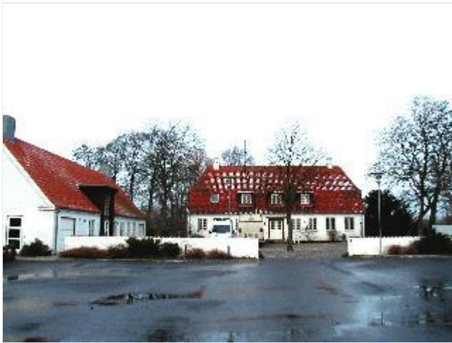
Foto: 2. Præstegården umiddelbart vest for kirken, i "Bedre Byggeskik", fra syd Stort billede