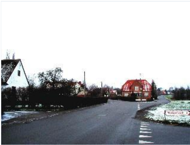
Foto: 9. Villa i vejgaflen (Kisserupvej-Løserupvej) nord for selve landsbyen, fra syd Stort billede