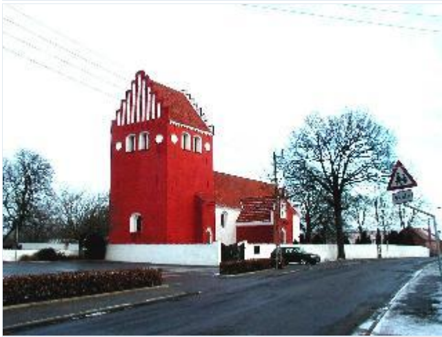
Foto: 1. Udby Kirke midt i byen med rødkalket tårn og våbenhus med hvide vinduesåbninger og blændinger, fra sydvest Stort billede