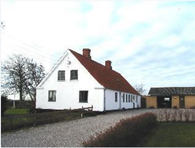
Foto: 2. Den nordligste gårds fine, enkle, grundmurede stuehus, fra øst Stort billede