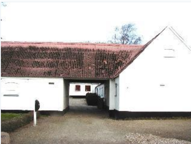
Foto: 7. Portåbning til den brolagte gårdsplads i det firelængede gårdanlægs sydlænge, fra syd Stort billede