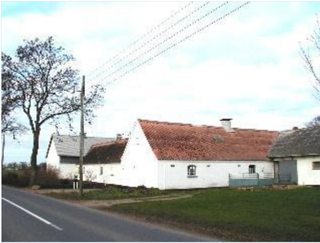
Foto: 6. Landsbyens vestligste gård, grundmuret og hvidkalket, med længer helt ud til vejen, fra øst Stort billede