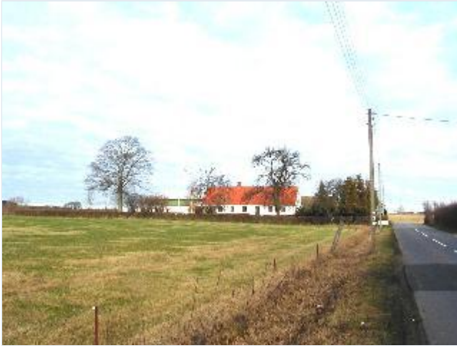
Foto: 1. Landsbyens nordligste gård med enkel, hvidkalket stuehuslænge, fra syd Stort billede