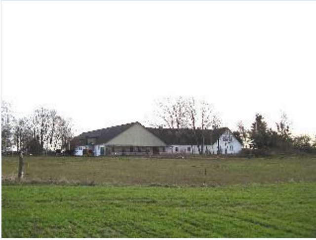
Foto: 5. Den sydligste gård i landsbyen, grundmuret og hvidkalket med moderniseret ladebygning, fra nordvest Stort billede