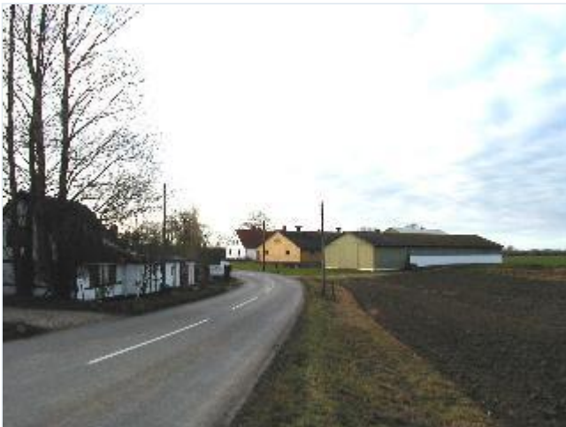
Foto: 11. Landsbyens nordlige indfaldsvej (Søstrupvej), fra nordøst Stort billede