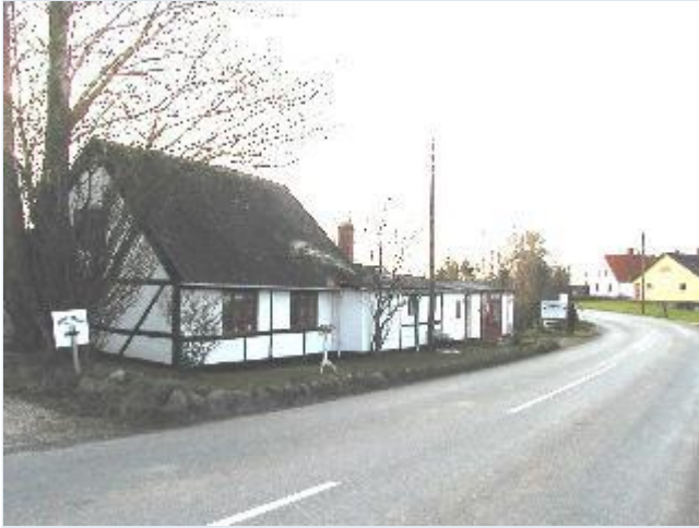
Foto: 10. Lille bindingsværkshus umiddelbart nord for landsbyen, fra nord Stort billede