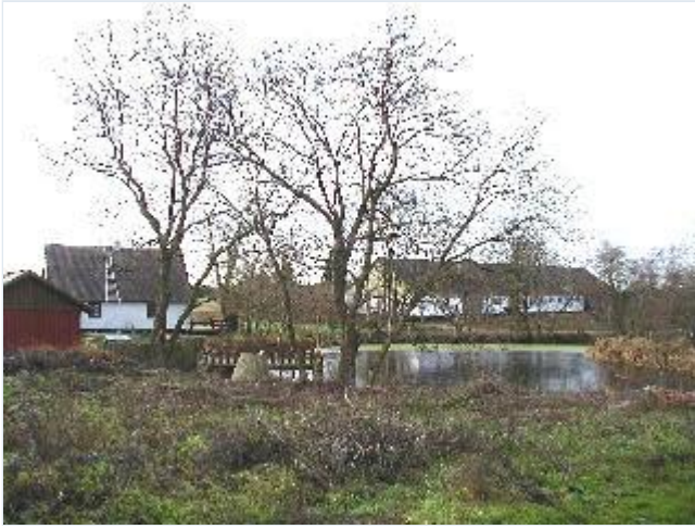
Foto: 9. Lille landarbejderhus og stor gård ved landsbyens gadekær, som har fået "badebro", fra nordøst Stort billede