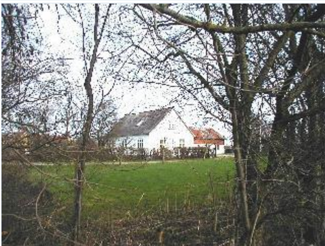
Foto: 3. Det sydligste af landsbyens to husmandsteder, fra sydvest Stort billede