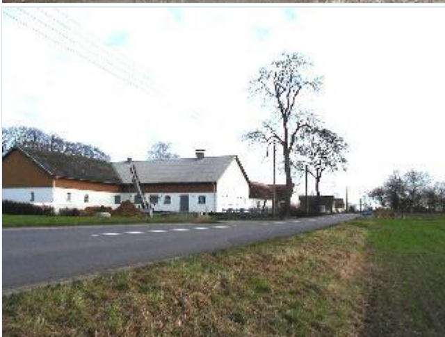
Foto: 8. De to hvidkalkede gårde langs Søstrupvej sydligt i landsbyen, fra vest Stort billede