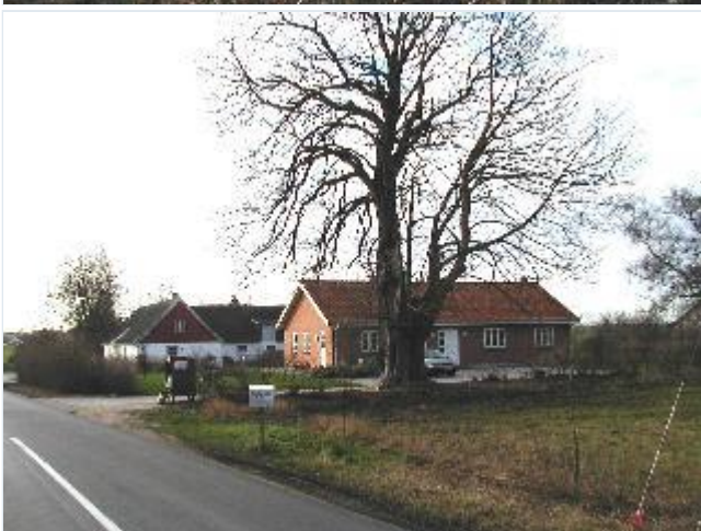
Foto: 4. Gammel gård med nyt stuehus i røde sten, fra nordøst Stort billede