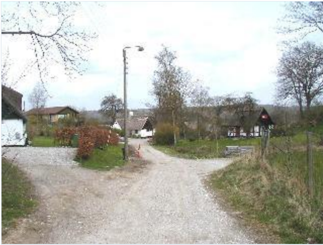
Foto: 8. Småhuse i landsbyens nordøstlige del (ved Kilden) Stort billede