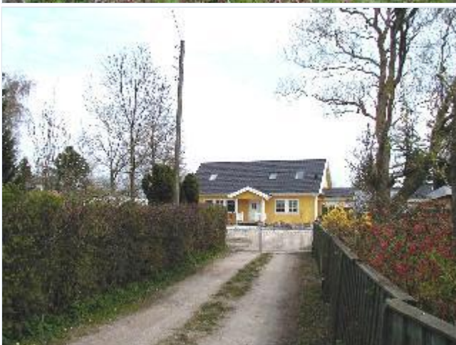
Foto: 10. Nyt svensk træhus over for kirken. Pænt i Sverige, men ikke her. Stort billede