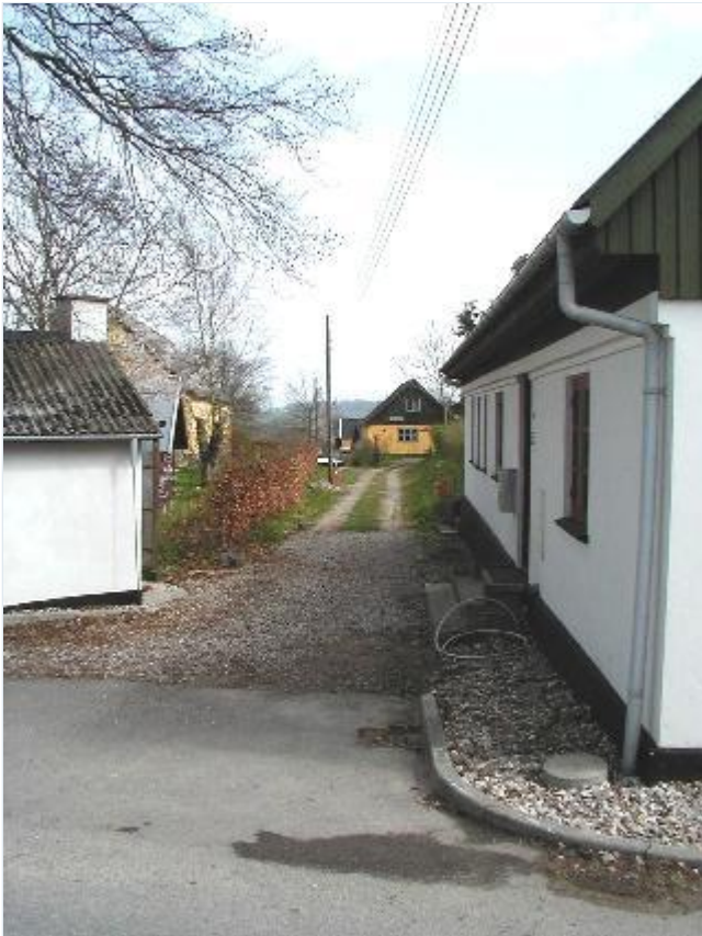
Foto: 5. Gyde (Kilden) fra bygaden (Bukkerupvej) mod øst Stort billede