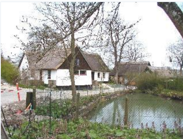
Foto: 9. Småhuse ved gadekæret i landsbyens nordøstligste del Stort billede