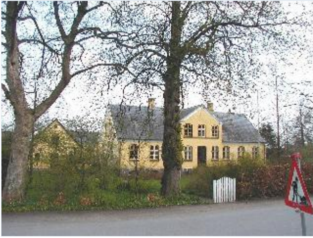
Foto: 4. Hovedbygning til firlænget gård på østsiden af Bukkerupvej overfor præstegården Stort billede