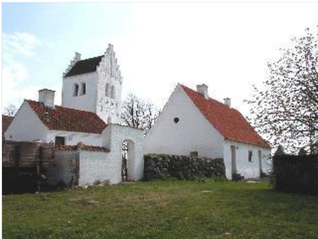
Foto: 2. Hospitalsbygningen ved den vestlige kirkegårdsmur Stort billede