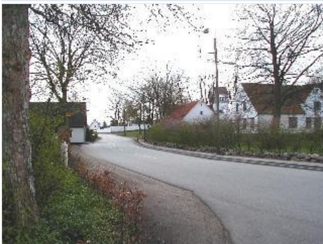
Foto: 3. Gedeforløb (Bukkerupvej) fra nord med præstegård og kirke på vestsiden Stort billede