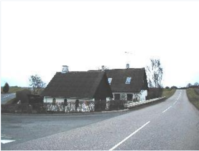
Foto: 6. Landsbyens tidligere smedie og smedens hus nordøst for selve landsbyen, fra syd