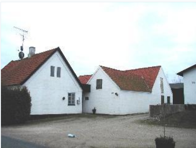
Foto: 7. Enkelt, hvidkalket husmandssted over for smedien, fra nordøst