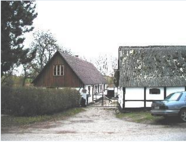
Foto: 5. Stuehuset til den firelængede bindingsværksgård, fra nord