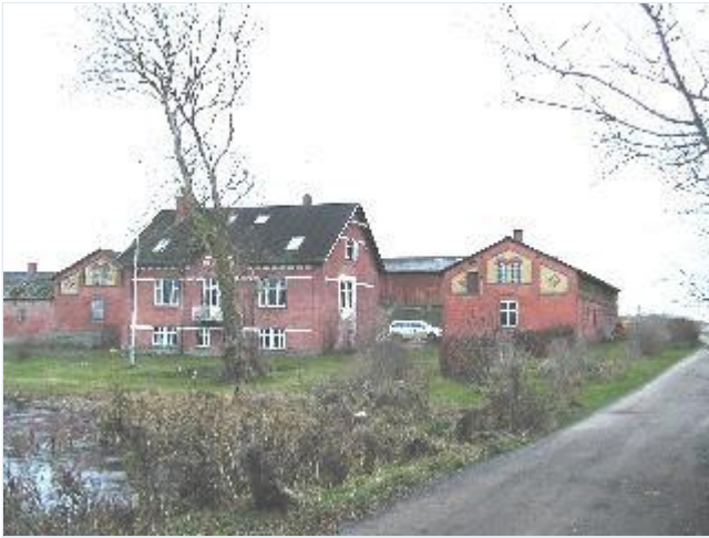
Foto: 2. Landsbyens sydligste gård, Blanksøgård, tæt ved søen, med stuehus og driftsbygninger i røde sten med hvide pyntebånd og mønstermuringer, fra nord Stort billede