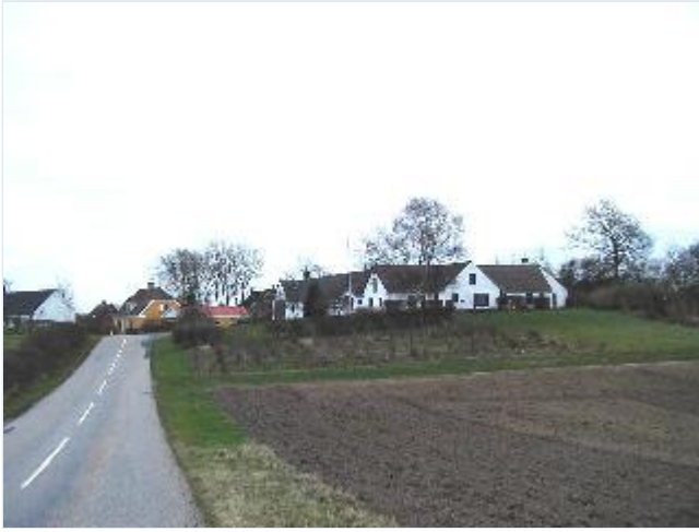
Foto: 1. Den sydvestligste, firelængede, hvidkalkede gård i landsbyen, fra vest Stort billede