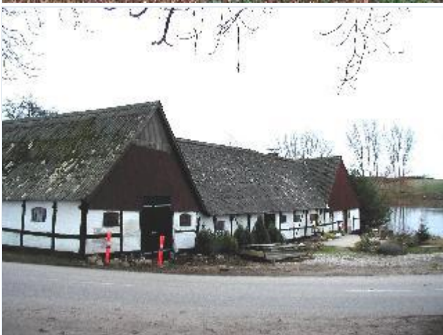
Foto: 4. Firelænget gård med længer i bindingsværk nordøstligt i byen, fra nordvest Stort billede