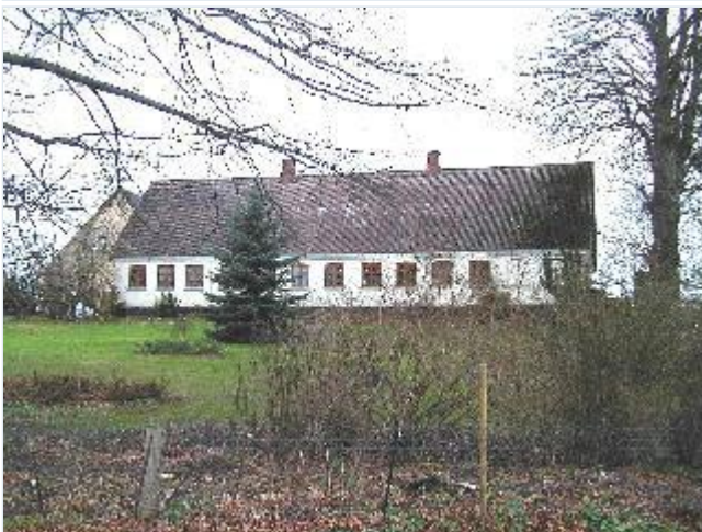
Foto: 3. Langt, enkelt, grundmuret stuehus til den nordvestlige gård i byen, fra sydøst Stort billede