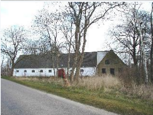
Foto: 12. Den vestligste gårds grundmurede, hvidkalkede vestlænge, fra vest Stort billede