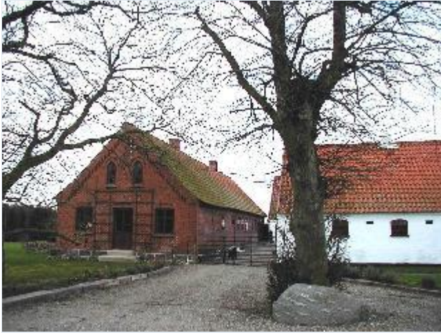
Foto: 2. Den sydøstligste gård i landsbyen, stuehusets gårdfacade i bindingsværk med tegl, fra øst Stort billede