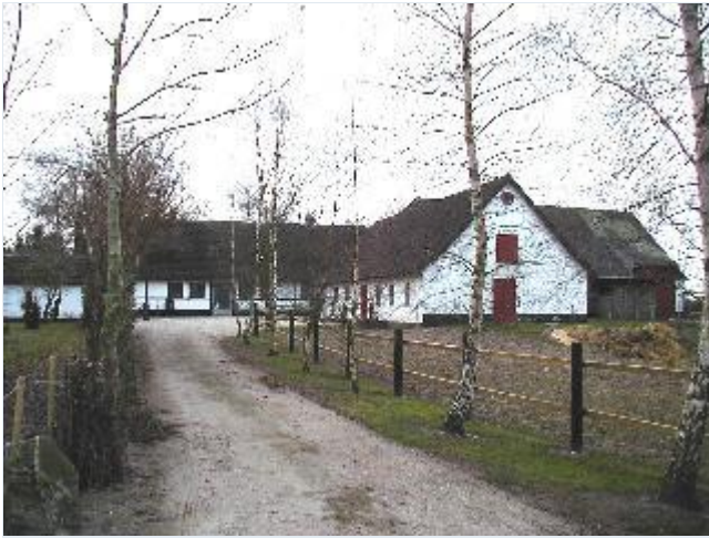
Foto: 6. Mindre landbrug med stuehus i bindingsværk og grundmuret staldlænge, fra nord Stort billede