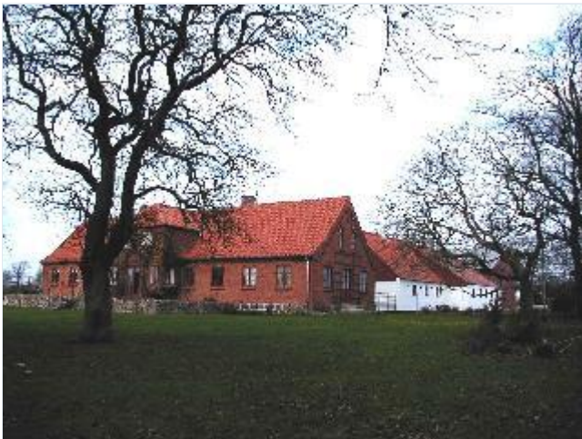
Foto: 3. Gårdens velbyggede stuehus fra 1866 i røde sten på kvaderstensfundament, fra syd Stort billede