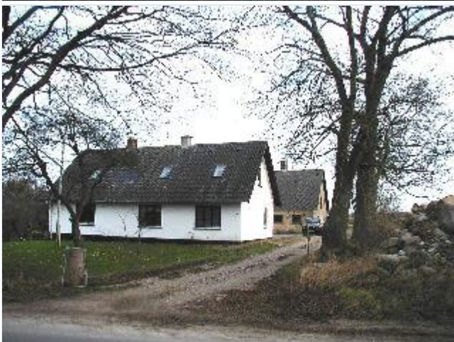
Foto: 4. Mindre landbrug østligt i landsbyen, fra vest Stort billede