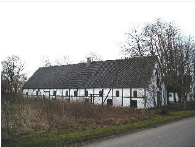
Foto: 11. Den vestligste gårds østlige staldlænge med bindingsværk i østfacaden, fra øst Stort billede