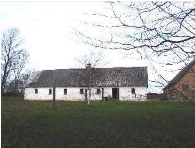
Foto: 9. Den nordligste gårds hvidkalkede svinehus muret delvis af kampesten, fra syd Stort billede