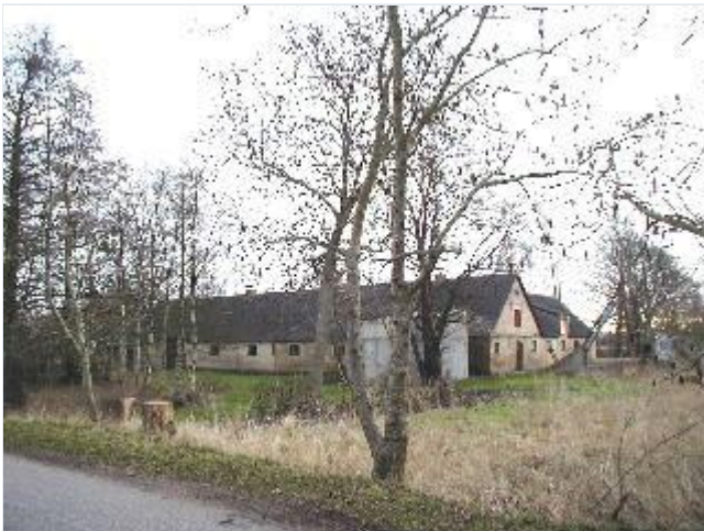
Foto: 7. Gården Kjærgård midt i landsbyen, syd for gadekæret, med driftsbygninger i gule mursten, fra nordvest Stort billede