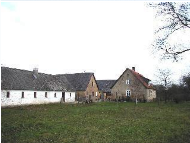
Foto: 8. Landsbyens nordligste gård med stuehus og staldlænge i gule mursten, en anden længe i bindingsværk og hvidkalket svinehus, fra vest Stort billede