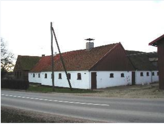
Foto: 1. Landsbyens sydøstligste gård med velholdte driftsbygninger, fra nordøst Stort billede