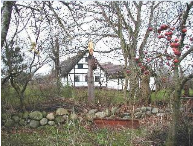
Foto: 5. Mindre landbrug med stuehus i bindingsværk med stendigeomgærdet have, fra øst Stort billede