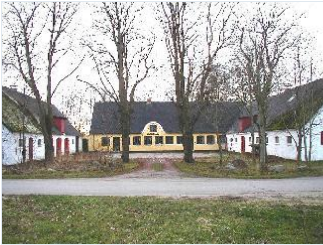
Foto: 10. Landsbyens vestligste gård, Kildebakkegård, med gulkalket stuehus fra 1865 med hvide pyntebånd, hvidkalkede staldlænger med rødmaledede døre og porte samt træække som afgrænsning af anlægget mod vejen, fra nord Stort billede