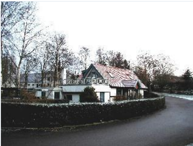
Foto: 7. Lille gadehus i bindingsværk med flere senere tilføjelser, midt i byen, fra nordvest Stort billede