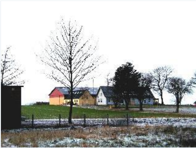
Foto: 2. Bakkegård lidt nord for selve landsbyen, fra sydøst Stort billede