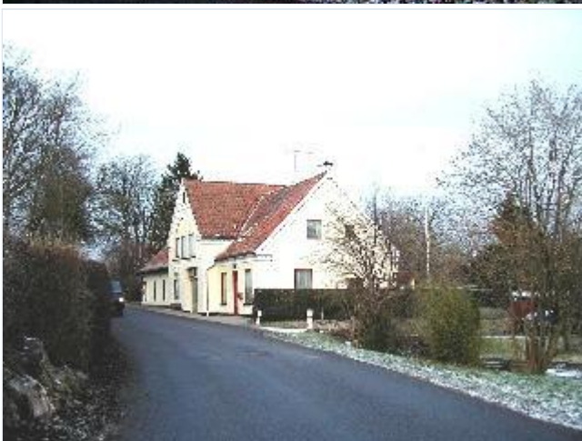
Foto: 4. Det nedlagte andelsmejeri nordøstligt i byen, fra sydvest Stort billede