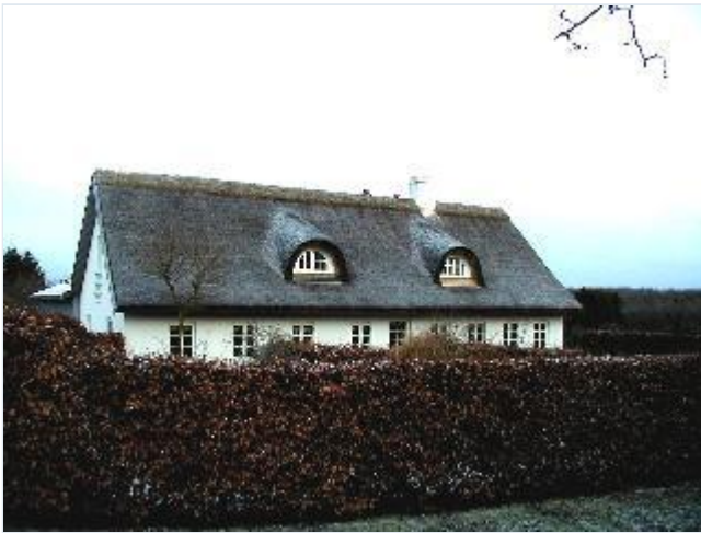
Foto: 13. Tidligere husmandssted på østsiden af den gamle vej til Eriksholm, fra vest