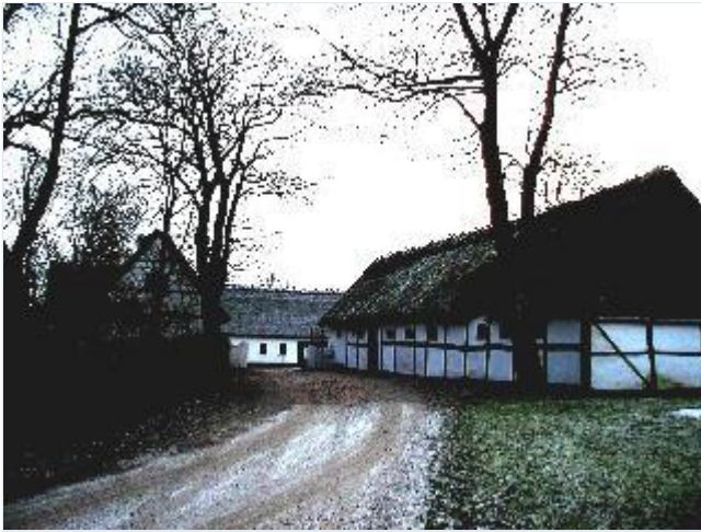
Foto: 6. Strandagergårds sidelænge mod nord og gårdsplads, fra nord Stort billede