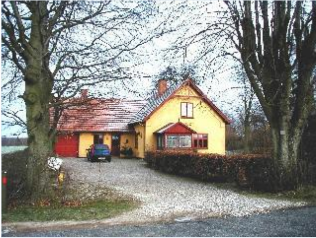
Foto: 10. Villa eller funktionærbolig, Bredvig, med fint træarbejde og lille glasveranda, fra vest Stort billede