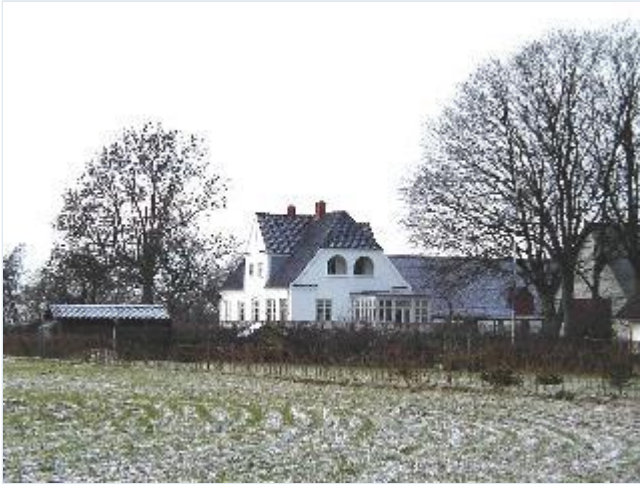
Foto: 9. Landsbyens sydligste gård med herskabeligt stuehus med pyntelig glasveranda, fra sydøst Stort billede