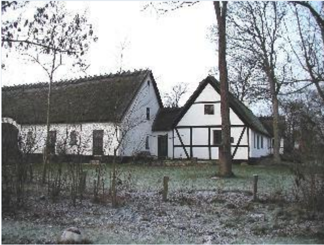
Foto: 5. Stor, velbevaret, stråtækt gård, Strandagergård, i bymidten, overvejende i bindingsværk, med stor have, fra syd Stort billede