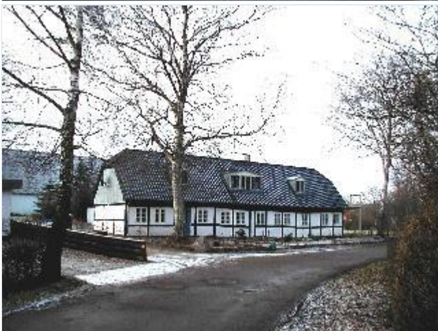
Foto: 8. Længehus, tidligere stråtækt og med flere arbejderboliger, nu stærkt moderniseret med tungt, sortglaseret tegltag og kviste, fra sydøst Stort billede