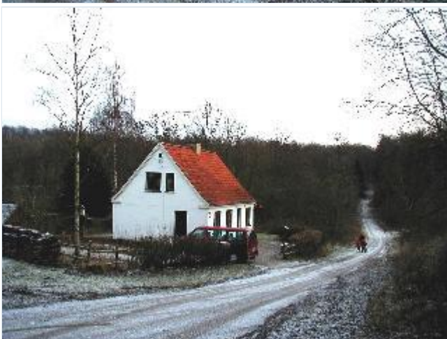
Foto: 16. Gl. Skyttehus, et af Eriksholms godshuse, på vejen gennem skoven til Eriksholm, fra nordvest