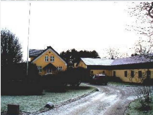
Foto: 12. Den lille gård Skovhøj på vestsiden af den gamle vej til Eriksholm, fra nord Stort billede