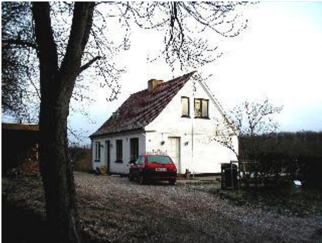
Foto: 14. Lille arbejderhus på østsiden af den gamle vej til Eriksholm, fra vest