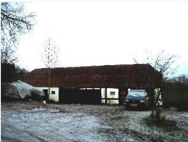
Foto: 15. Driftsbygning i bindingsværk på østsiden af vejen, fra vest