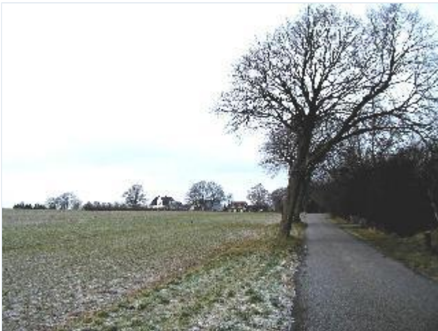
Foto: 11. Den gamle landevej fra Eriksholm mod Bredetved og Holbæk, fra sydøst Stort billede