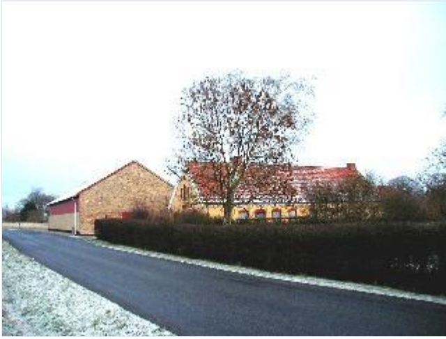
Foto: 1. Pilegården, den østligste af de firelængede gårde i landsbyen, fra vest Stort billede