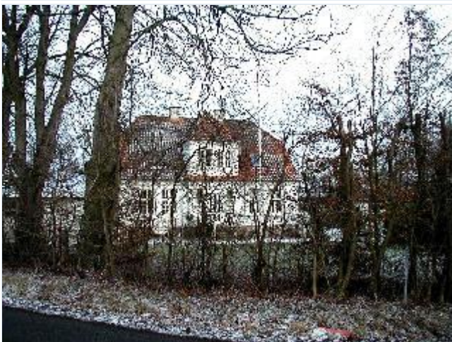
Foto: 3. Hvidkalket villa i "Bedre Byggeskik" nordligt i landsbyen ved siden af mejeriet, fra vest Stort billede