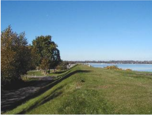
Foto: 7. Lammefjordsdæmningen, fra sydøst Stort billede