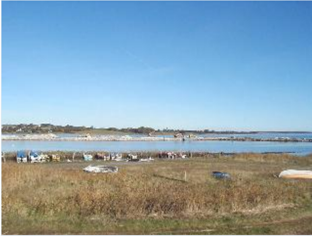
Foto: 14. Dækmole til ny lystbådehavn under opførelse ud for fiskerihavnen ved nordre kanals udløb, fra syd Stort billede