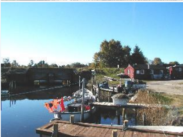
Foto: 12. Den lille fiskeri- og bådhavn med redskabsskure ved den nordre landvandskanals udmunding i fjorden, fra nordøst Stort billede