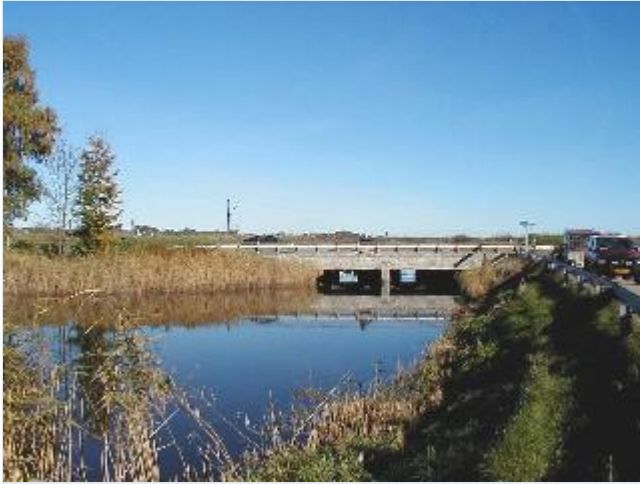
Foto: 10. Nordre landvandskanals udløb ved Gundestrup, fra sydvest Stort billede