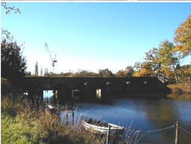
Foto: 5. Sluseportene ved hovedudløbet ved Audebo, fra nordvest Stort billede