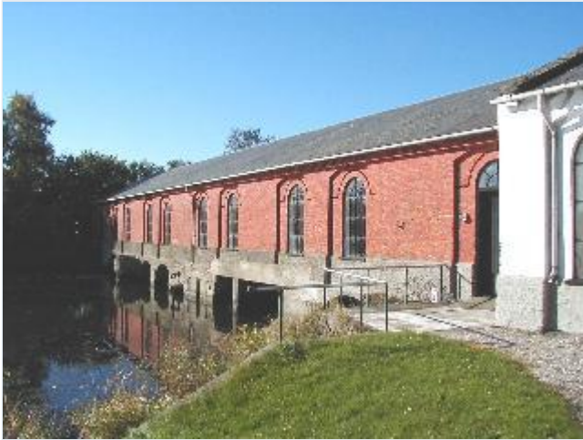
Foto: 2. Pumpestationen ved Audebo, som pumper vandet op fra den inddæmmede Lammefjords centralkanal, fra nord Stort billede