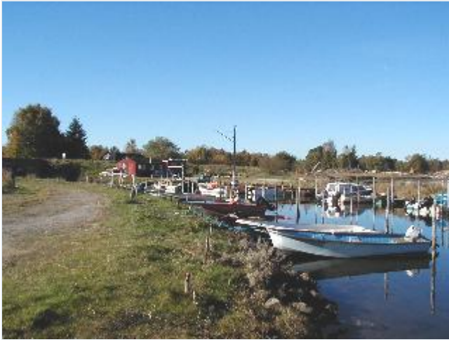
Foto: 13. Fiskeri- og bådehavnen med redskabsskure m.m. ved den nordre kanals udløb, fra øst Stort billede