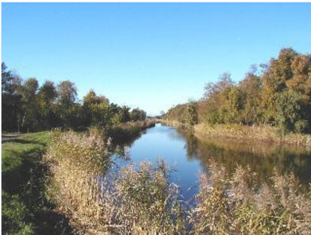
Foto: 11. Nordre landvandskanal syd for Gundestrup Færgetro, fra øst Stort billede