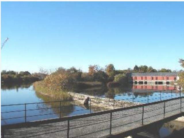
Foto: 4. Pumpestationen og de to adskilte kanaler (søndre landvandskanal til venstre og centralkanal til højre) ved sluseportene, fra nordøst Stort billede