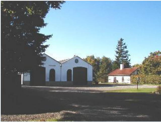
Foto: 3. De to store maskinhuse og den lille bindingsværkssmedie ved pumpestationen ved Audebo, fra nord Stort billede