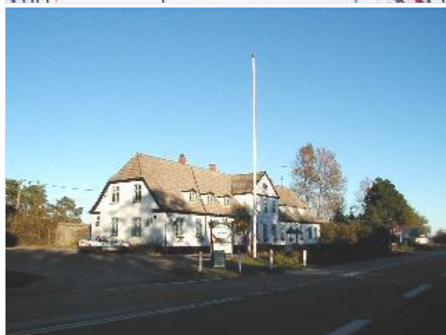
Foto: 1. Gundestrup Færgekro på nord (-vest-)siden af dæmningen, hvor der tidligere var færgested for overfarten over fjordmundingen, fra vest Stort billede