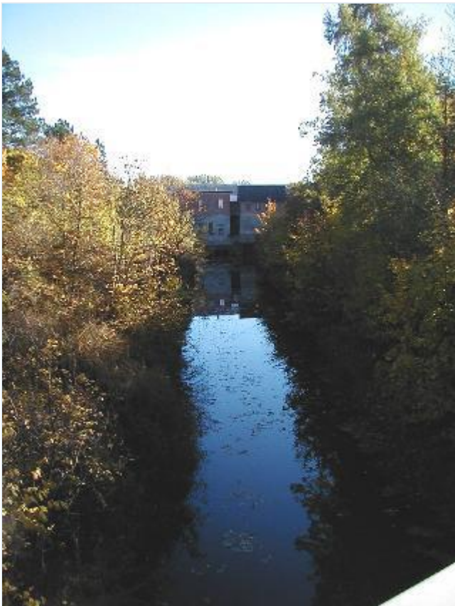
Foto: 8. Centralkanalen vest for pumpestationen, fra vest Stort billede