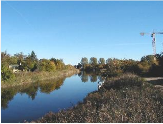
Foto: 9. Søndre landvandskanal ved Audebo, fra sydvest Stort billede