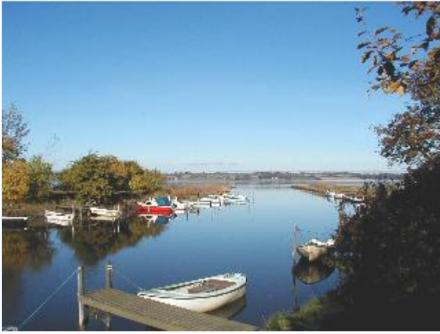
Foto: 6. Fjordens søndre udløb ved Audebo med småbåde, fra syd Stort billede