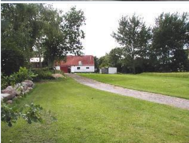
Foto: 4. Bagsiden af gårdanlægget ved den tidligere kro, set fra øst.