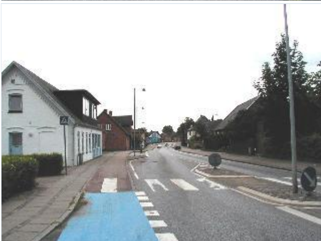
Foto: 12. Hovedgaden/landevejen set fra nord