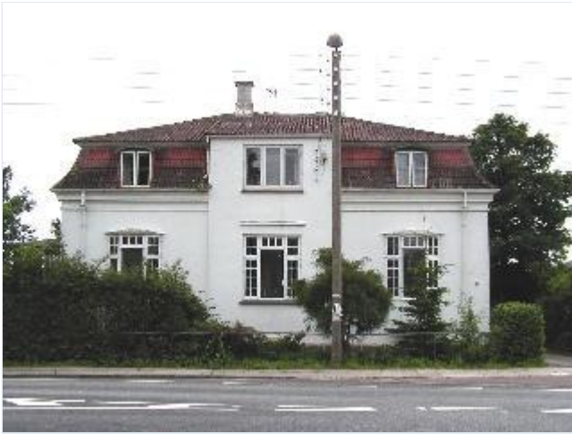
Foto: 14. Villa på sydsiden af Bonderupvej. Stort billede