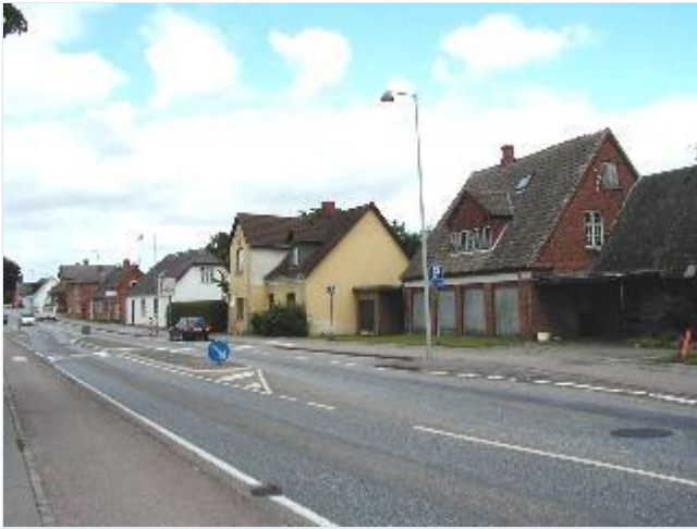
Foto: 2. Husrækken med nedlagte butikker på østsiden af hovedgaden, set mod nordøst.