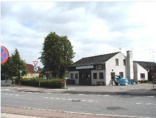
Foto: 7. Vejkrydset midt i byen ved kirken, med smedie, brugs og tidl. kro. Stort billede