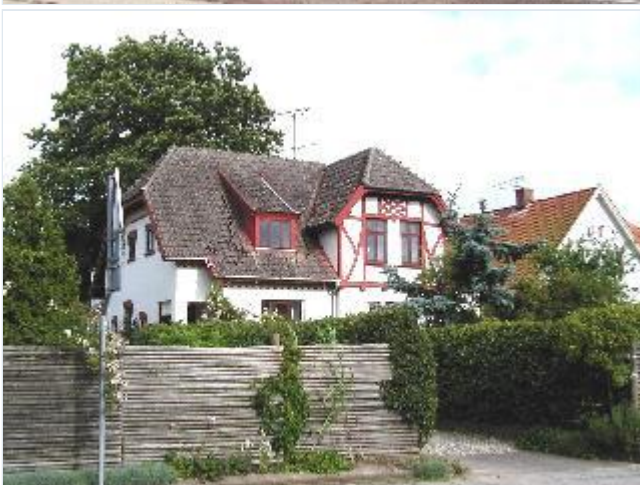
Foto: 8. Villaer på østsiden af hovedgaden sydligt i byen. Stort billede