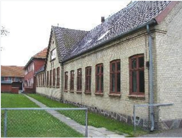
Foto: 6. Den ældste del af skolen fra 1924 på vestsiden af hovedgaden, set mod syd. Stort billede