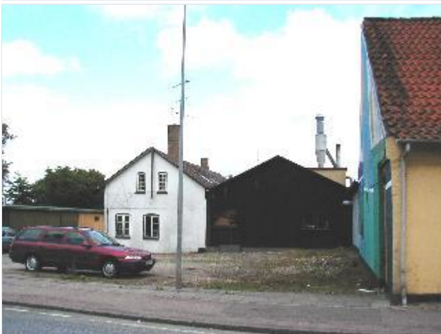
Foto: 3. Tidligere tømreværksted på østsiden af hovedgaden.