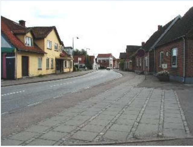
Foto: 1. Landevejen/hovedgaden gennem byen, fra nord.