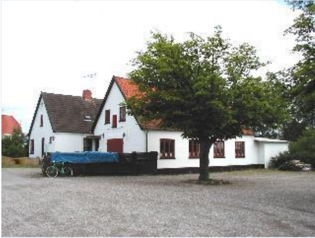
Foto: 10. Håndværkerhus med værksted, pladsen ved friluftsbadet vest for landevejen.