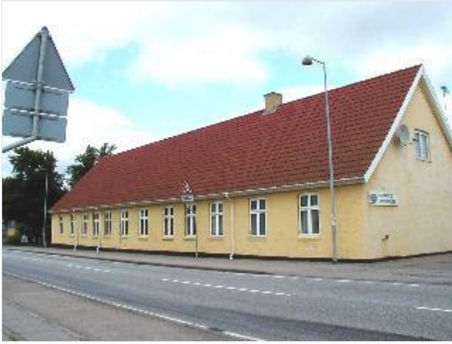
Foto: 5. Den tidligere kro på østsiden af hovedgaden overfor Brugsen. Stort billede