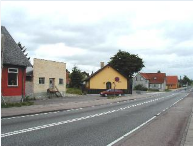
Foto: 13. Håndværkerværksted og missionshuset Sarepta ved T- krydset Tølløsevej- Bonderupvej. Stort billede