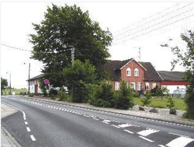
Foto: 15. Gård yderst mod øst i byen ved Bonderupvej. Stort billede