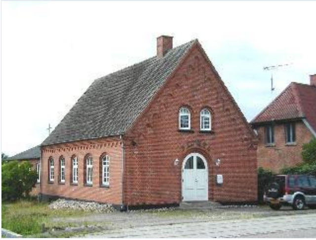
Foto: 9. Missionshuset Bethel på vestsiden af hovedgaden sydligt i byen.