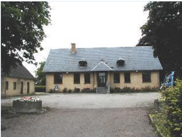
Foto: 11. Den tidligere præstegård nordligst i byen vest for landevejen