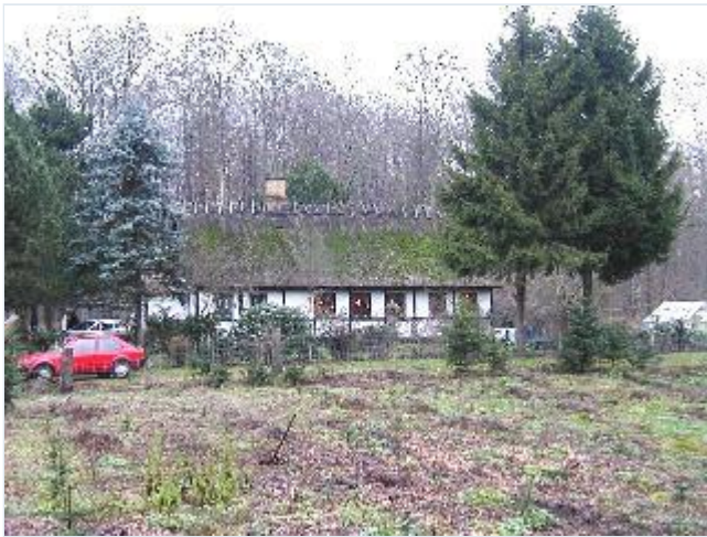
Foto: 14. Skovløberstedet Lisedal i Nørreskov, fra syd Stort billede