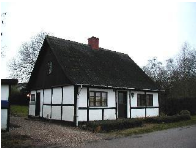
Foto: 8. Lille landarbejderhus mellem gårdene i den østlige del af landsbyen, fra nordøst