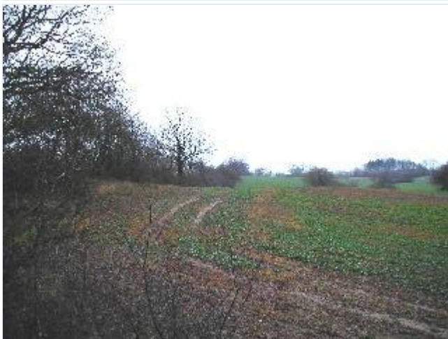
Foto: 16. Landsbyejerlavets grænsedige mod øst med gammel bevoksning, fra nord Stort billede