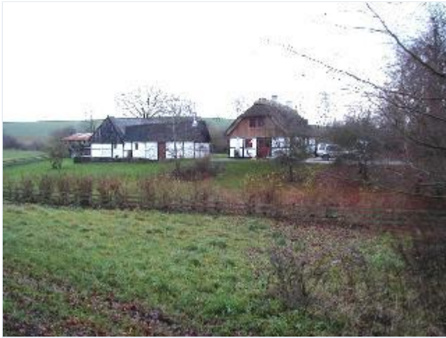
Foto: 15. Husmandssted med bindingsværksbygninger i det nordligste hjørne af ejerlavets dyrkede jord, fra vest Stort billede