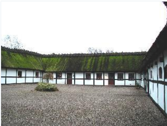
Foto: 3. Gårdspladsen i den sydvestligste gård i landsbyen, fra nord Stort billede