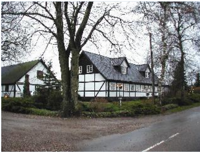
Foto: 6. Den midterste gård i landsbyen, Anneksgården, i bindingsværk, stærkt restaureret, fra øst