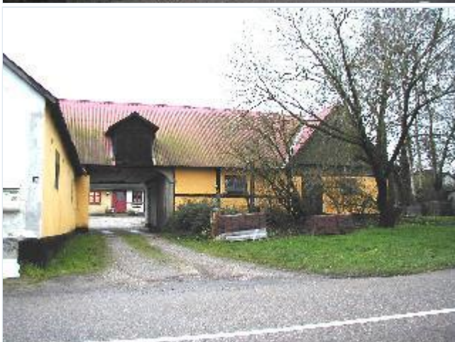
Foto: 9. Den østligste gård i byen, firelænget og delvis i bindingsværk, fra nord