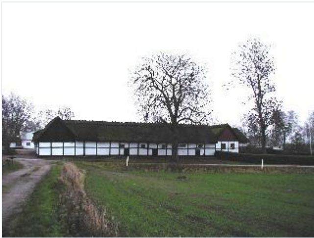
Foto: 2. Den yderste gård, helt i bindingsværk og med stråtag, i den vestlige del af landsbyen, fra vest Stort billede