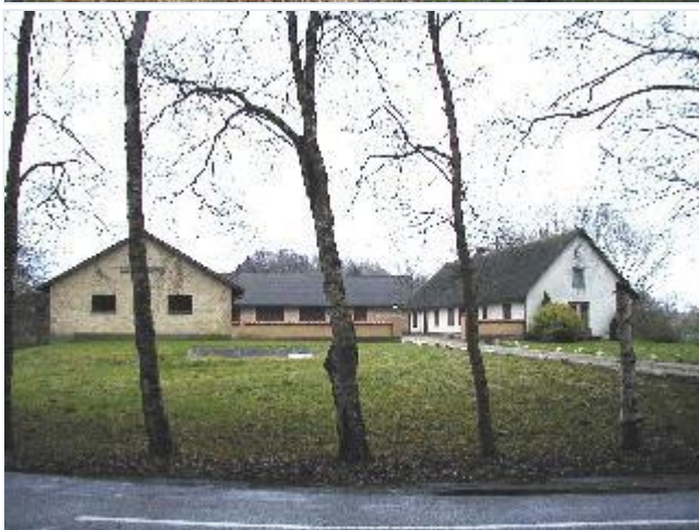
Foto: 12. Én af ejerlavets udflyttede gårde, Rønneskovgård, ved skoven nord for selve landsbyen, fra vest