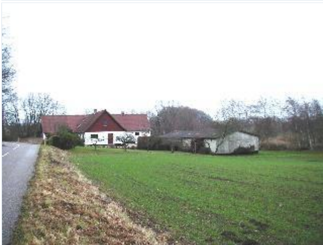
Foto: 11. Husmandssted ved skoven nord for selve landsbyen, fra sydvest