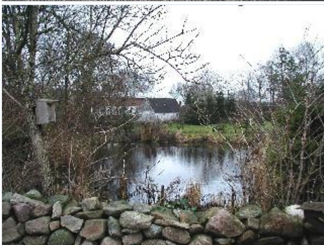
Foto: 4. Den firelængede Dansbjerggård nord for det lille gadekær i den vestlige del af byen, fra syd Stort billede