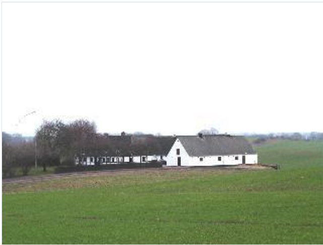
Foto: 10. Én af ejerlavets udflyttede gårde nord for selve landsbyen, fra sydvest