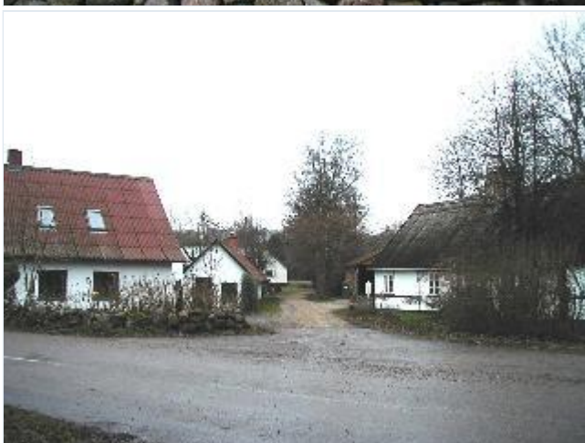
Foto: 5. Gadehuse og den tidligere smedie i den vestlige del af landsbyen, fra sydøst Stort billede