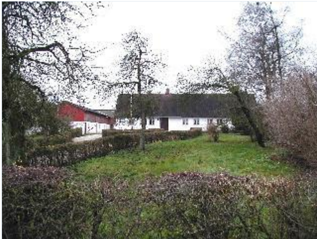
Foto: 7. Den næstøstligste gård, med velbevaret stuehus i overkalket bindingsværk i gammelt haveanlæg med plæner og klippede hække, fra nord