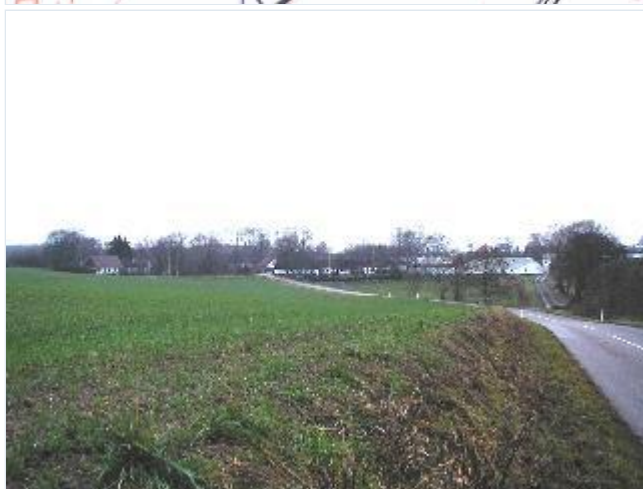
Foto: 1. Den lille, sluttede landsby med 6 udflyttede gårde og enkelte huse omkring et vejkrøds mellem Store Åmose og de omgivende skove, fra sydvest Stort billede