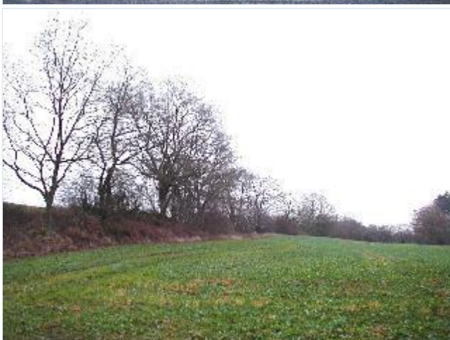
Foto: 13. Markant jorddige fra udskiftningen af ejerlavet i 1796 med gammel bevoksning, nord for Rønneskovgård, fra vest