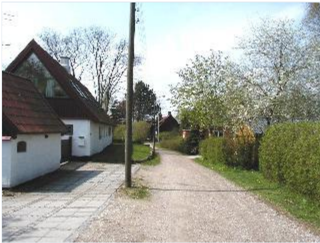
Foto: 12. Kærvej mod vest Stort billede