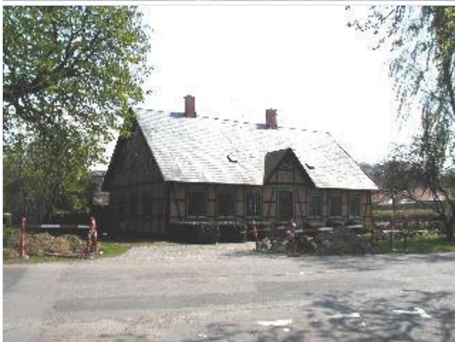
Foto: 7. Tølløsegårds forvalterbolig sydligst i landsbyen Stort billede