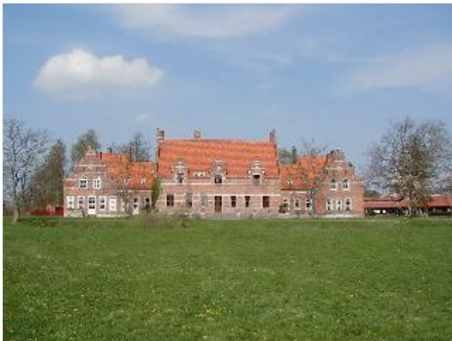
Foto: 2. Tølløsegårds hovedbygning set fra parken fra syd. Stort billede