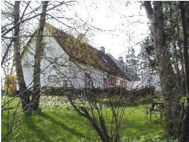
Foto: 13. Sammenbyggede småhuse langs Møllegårdsvej, bagsiden Stort billede