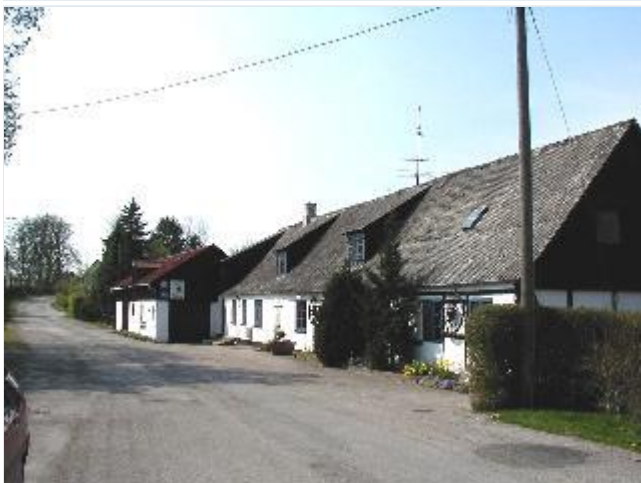
Foto: 14. Den tidligere købmandsforretning på Møllegårdsvej Stort billede