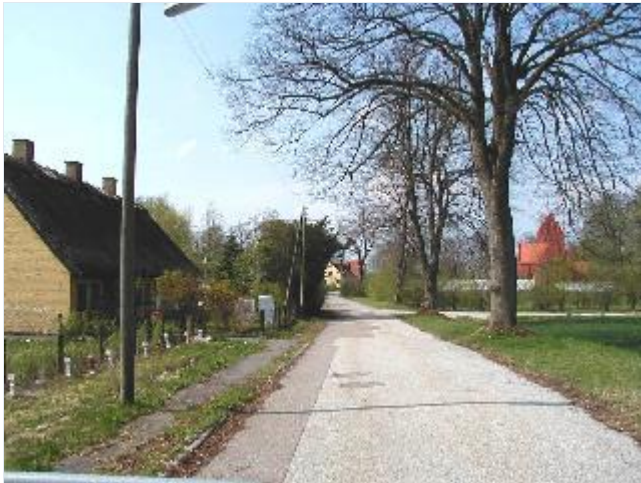
Foto: 5. Den gamle indfaldsvej (nu Nordstjernevej) til landsbyen fra øst Stort billede