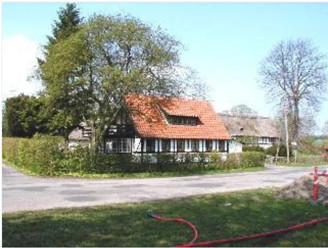
Foto: 8. Småhuse i bindingsværk på Nybyvejs vestside modsat kirken