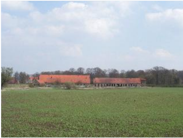
Foto: 17. Tølløsegårds avlsgård set fra vest Stort billede