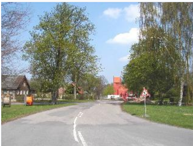
Foto: 6. Indfaldsvejen (Nybyve) til landsbyen fra syd Stort billede