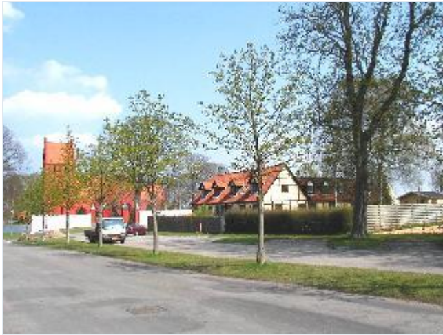
Foto: 9. Kirken og bebyggelsen syd for