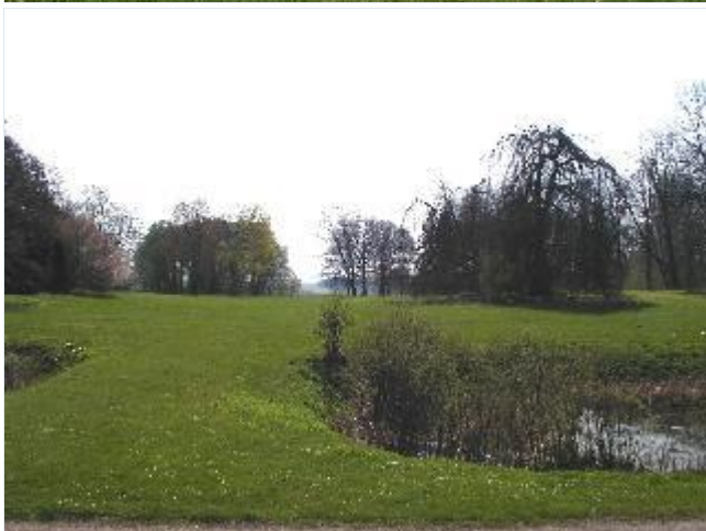
Foto: 3. Tølløsegårds park set mod syd fra hovedbygningen Stort billede