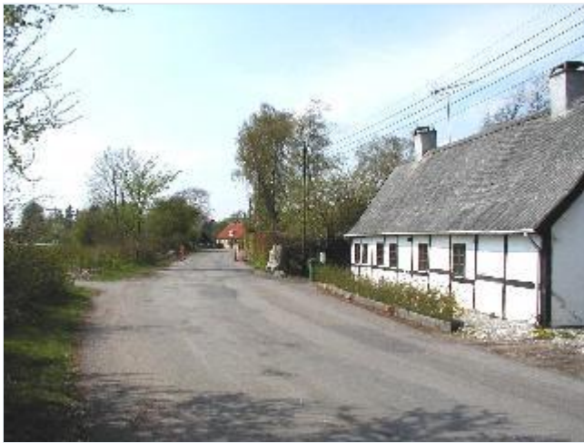
Foto: 16. Bindingsværkshus på Møllegårdsvej Stort billede