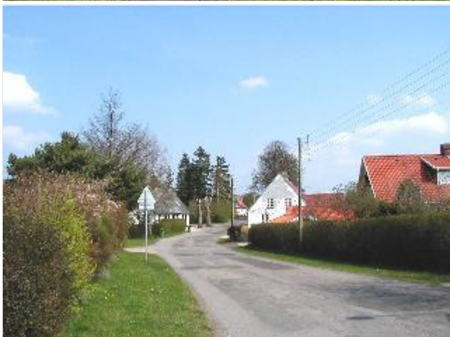
Foto: 11. Møllegårdsvej mod øst