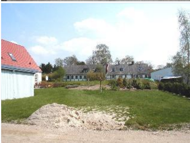
Foto: 15. Ny bebyggelse nord for smedien, set mod den gamle bebyggelse øst for Stort billede