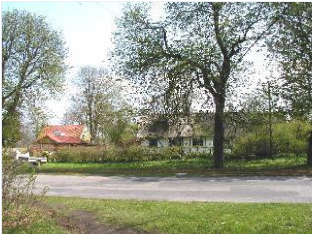
Foto: 10. Bebyggelsen syd for kirken på Nybyvejs østside