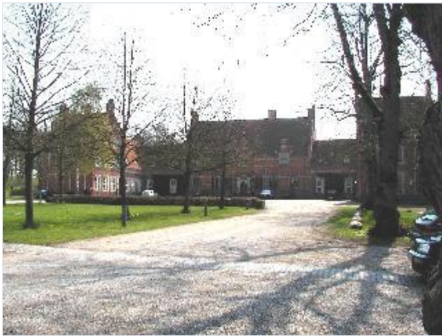
Foto: 4. Tølløsegårds hovedbygning set fra nord Stort billede