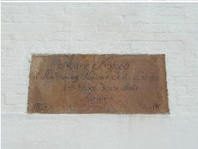
Foto: 4. Mindetavle på nordgavlen af den gamle skole på hjørnet af Sløjfen og Tingerupvej Stort billede