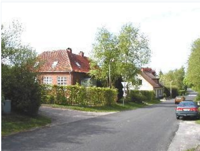
Foto: 7. Gadehuse og byens yngre skole, set fra sydøst Stort billede