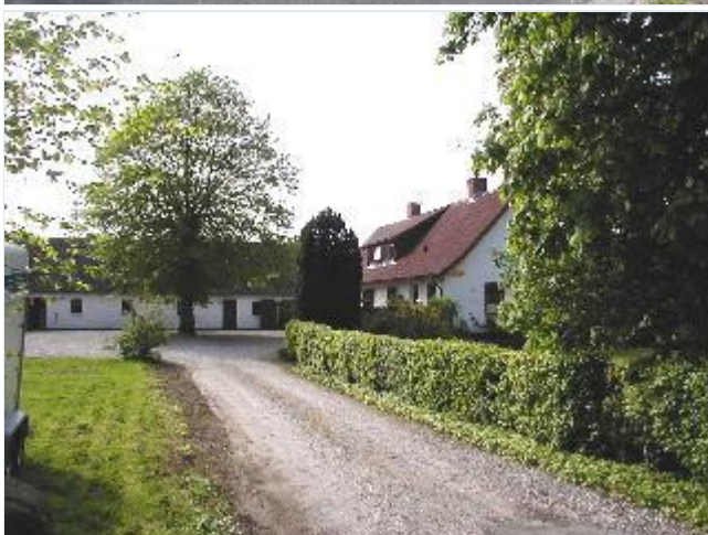
Foto: 8. Byens sydligste gård på vestsiden af gaden, fra øst Stort billede