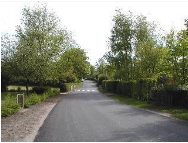
Foto: 5. Landsbygaden (Tingerupvej) kantet af velklippede hække, set mod syd Stort billede