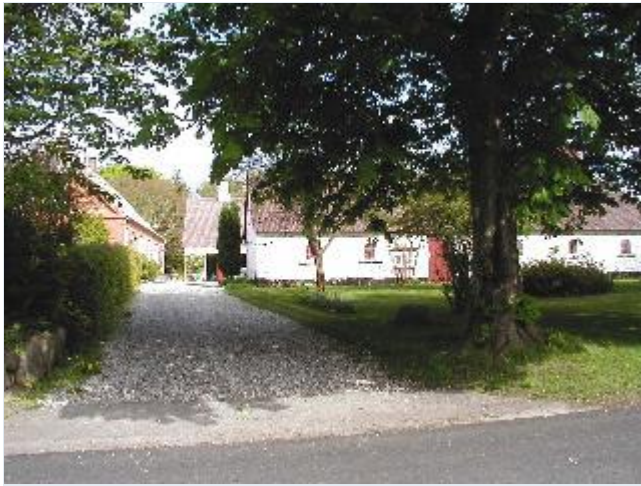
Foto: 6. Den sydligste gård på gadens østside, set fra vest Stort billede