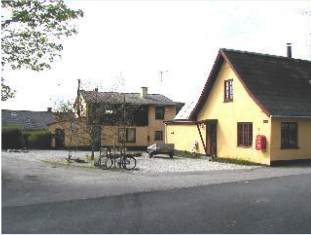
Foto: 10. Huse vest for gaden i byens nordlige del Stort billede