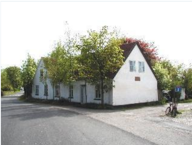
Foto: 3. Byens ældste skole fra 1815, på hjørnet af Tingerupvej og Sløjfen, fra nordøst Stort billede