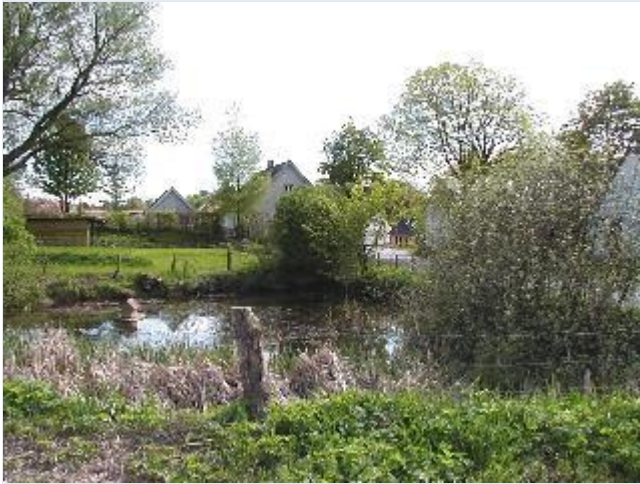
Foto: 1. Gadekæret nordligt i byen, fra nordøst Stort billede