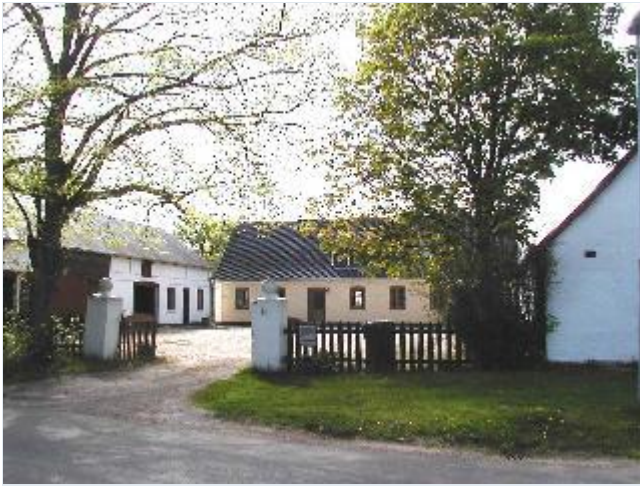
Foto: 2. Den nordligste gård på vestsiden af gaden (Tingerupvej), fra øst Stort billede