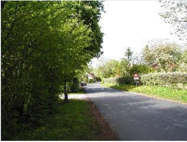
Foto: 9. Landsbygadens sydlige del, set mod nord Stort billede