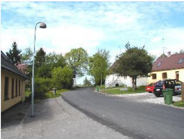
Foto: 11. Huse ved gaden i byens nordlige del Stort billede