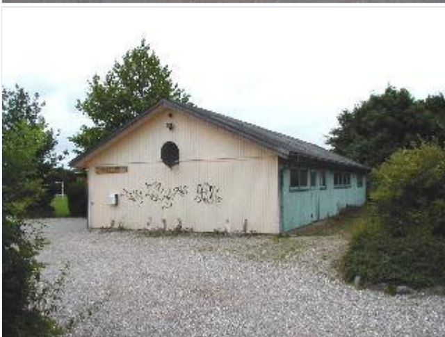
Foto: 18. En af idrætsforeningens bygninger ved sportspladsen nord for banen, set fra sydvest. Stort billede