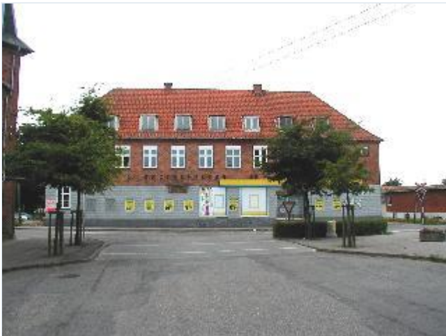
Foto: 5. L. Jørgensen og Søns store købmands- og korn- og foderstofforretn. fra 1925 Stort billede