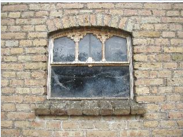
Foto: 22. Vindue i den tidligere lægeboligs staldbygning.