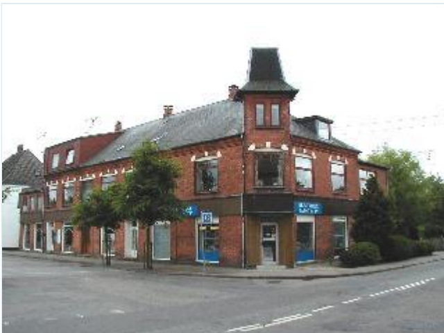
Foto: 26. Hjørneejendommen ved Banevej-Holbækvej, tidligere manufakturforretning og boghandel.