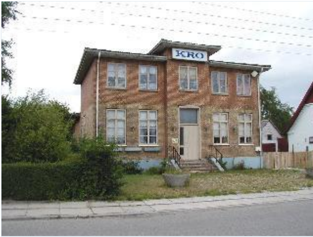
Foto: 16. Den tidligere tekniske skole på østsiden af den gamle Holbækvej nord for banen. Stort billede