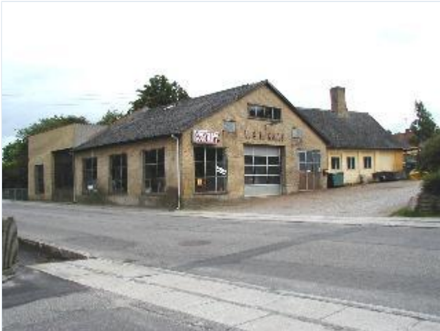
Foto: 25. Smede- og maskinværksted på sydsiden af Bygaden, mellem Toften og Bybjærgvej.