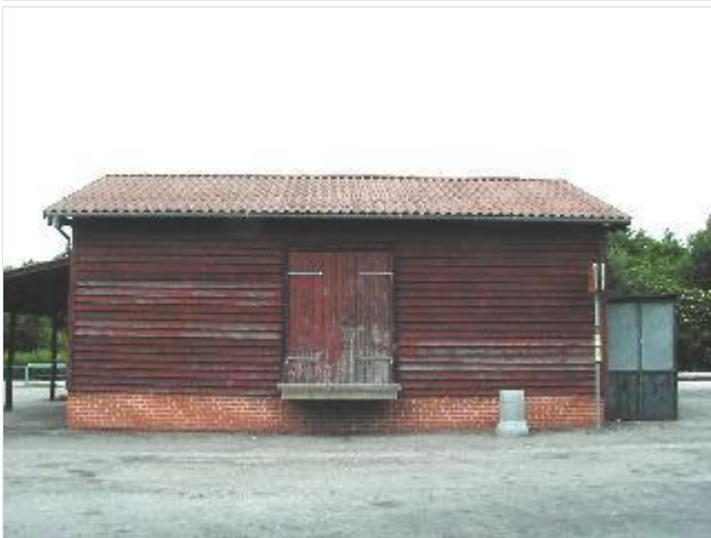
Foto: 13. Stationens pakhus, sydfacaden. Stort billede