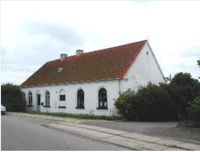
Foto: 15. Tidl. missionshus på vestsiden af den gamle Holbækvej nord for banen. Stort billede