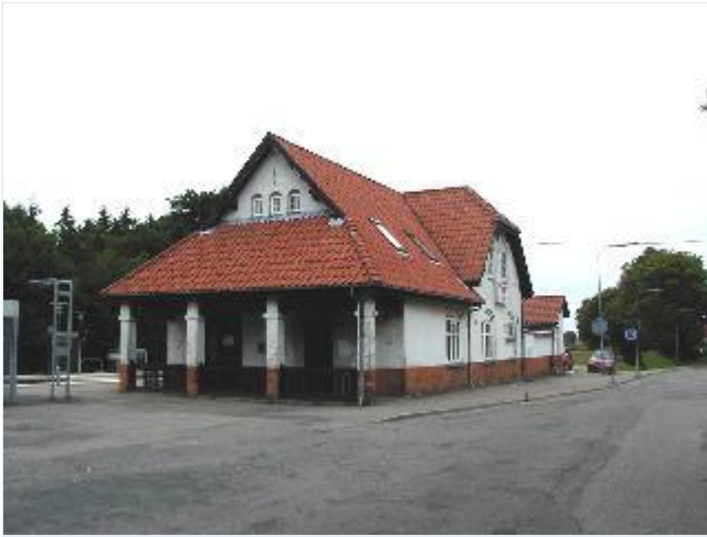
Foto: 12. Stationsbygningens vestgavl. Stort billede