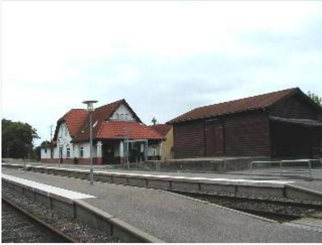
Foto: 3. Stationen og jernbanen, fra nordvest. Stort billede