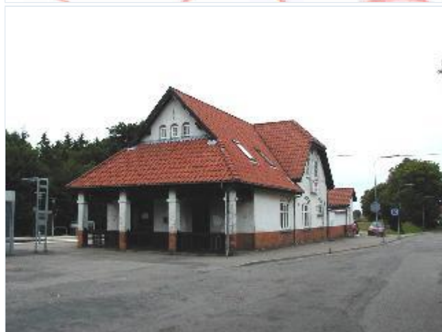
Foto: 1. Stationsbygningen fra sydvest. Stort billede