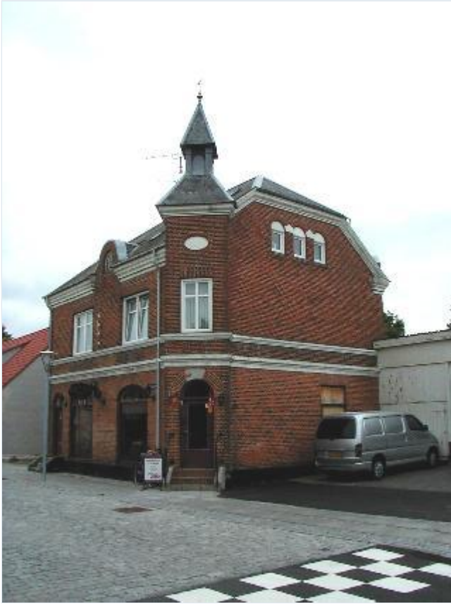
Foto: 9. Statelig butiksejendom med tårn på sydsiden af Bygaden, fra nordvest. Stort billede