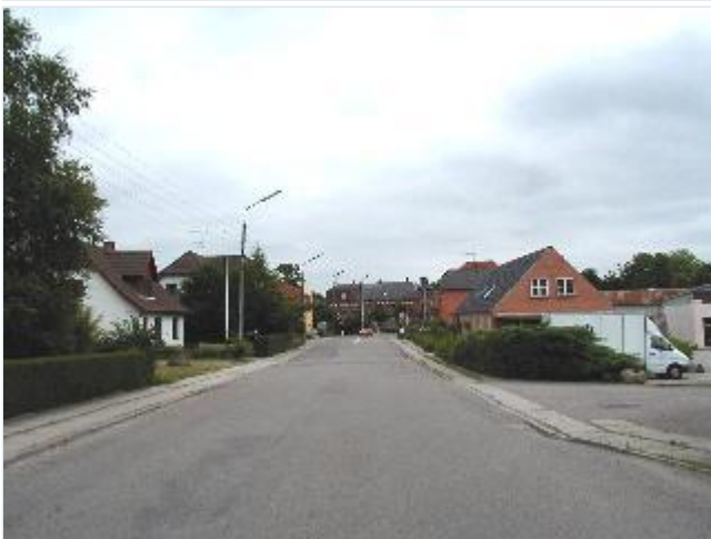
Foto: 17. Holbækvej mod jernbaneoverskæringen, set fra nord. Stort billede