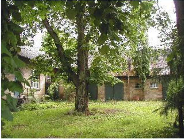
Foto: 24. Den tidligere lægebolig på sydsiden af Bygaden, gårdspladsen.