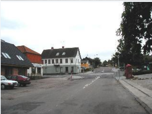
Foto: 6. Holbækvej mod syd mod krydset med Bygaden. Stort billede