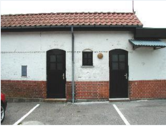
Foto: 11. Stationens retrader, set fra øst. Stort billede