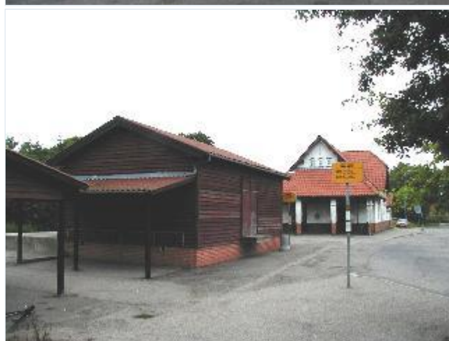
Foto: 2. Pakhuset og stationen, set fra sydvest. Stort billede