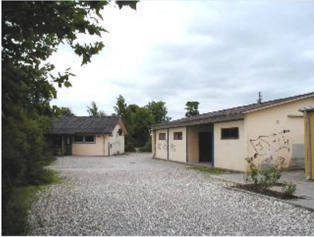
Foto: 20. Idrætsforeningens bygninger ved sportspladsen.