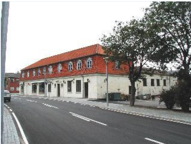
Foto: 8. Den tidl. krobygning på nordsiden af Bygaden, med "sal" i sidebygningen, fra sydøst. Stort billede