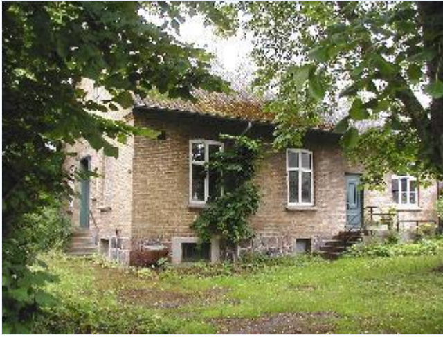
Foto: 23. Den tidligere lægebolig på sydsiden af Bygaden, fra nord.