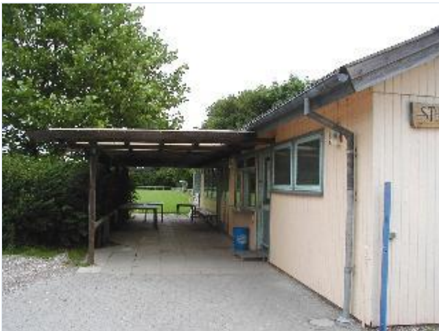
Foto: 21. Billet- og iskiosk, kontor m.m. ved sportspladsen, set mod øst