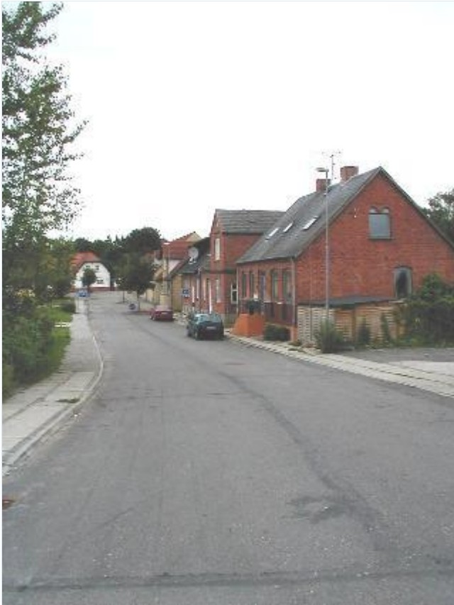
Foto: 10. Stationen for enden af Tvæervej, set mod nord. Stort billede