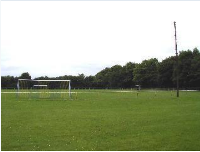
Foto: 19. Sportspladsen nord for banen og byen, set mod øst.