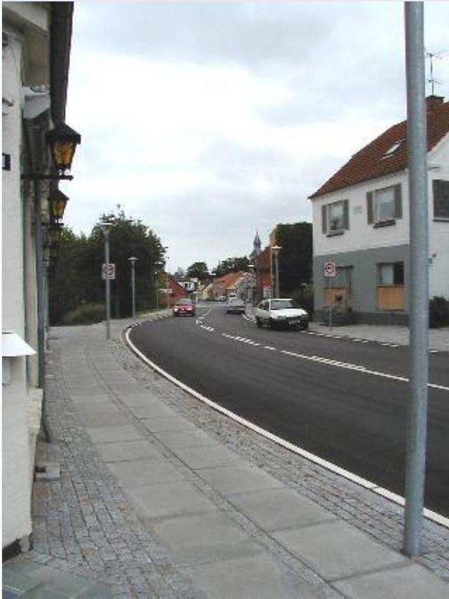
Foto: 7. Bygaden fra Holbækvejen mod øst. Stort billede