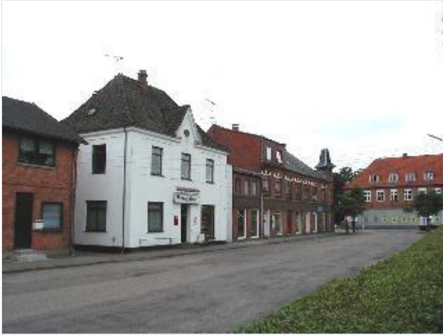
Foto: 4. De statelige bygninger ved "banepladsen", Banevej, fra nordøst. Stort billede