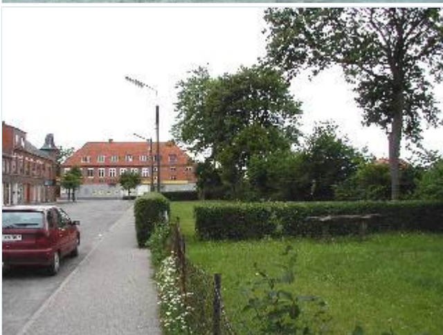
Foto: 14. Banevej med grønt anlæg langs banen og bred plads foran forretningerne, set mod vest Stort billede