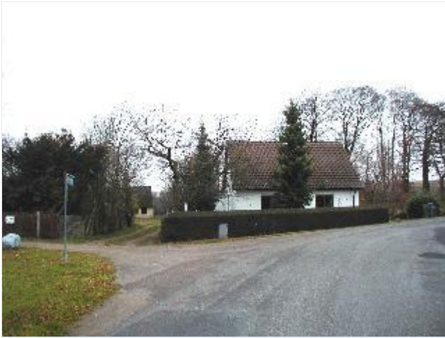
Foto: 6. Lille grundmuret, hvidkalket hus bag velklippet hæk mellem gårdene, fra syd Stort billede