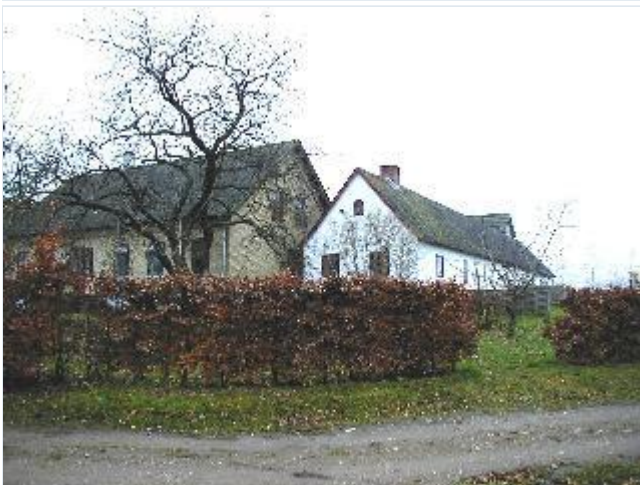
Foto: 8. Den nordligste gård i byen med gulstens stuehus og nordlænge delvis i rødt bindingsværk, fra nordøst Stort billede