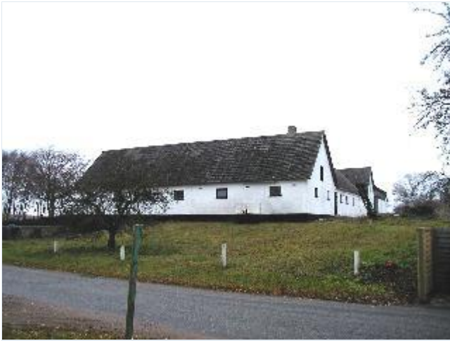
Foto: 2. Landsbyens østligste gård, Kragedyssegård, med hvidkalkede, grundmurede længer, fra sydvest Stort billede