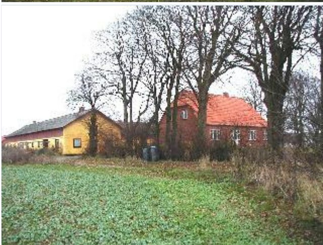
Foto: 4. Landsbyens vestligste gård med rødstens stuehus og gulkalkede udlænger samt store træer omkring haven, fra sydvest Stort billede