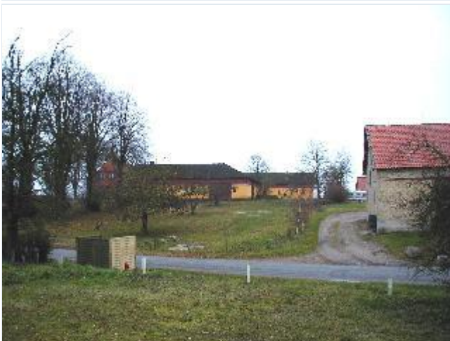
Foto: 3. Den vestligste gård i landsbyen med rødstens stuehus og grundmurede, gulkalkede længer med trempel, fra øst Stort billede