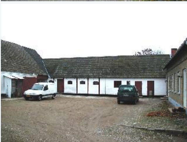
Foto: 9. Gårdsplads og udlænger til den nordligste gård, fra syd Stort billede