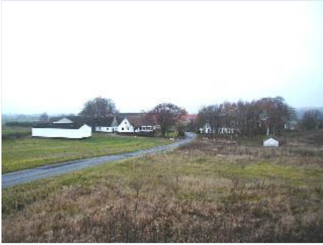
Foto: 1. Landsbyen Sørninges 5 udflyttede gårde og nogle få huse ligger tæt sammen neden for dyssen Kragedysse øst for landsbyen, som billedet er taget fra Stort billede