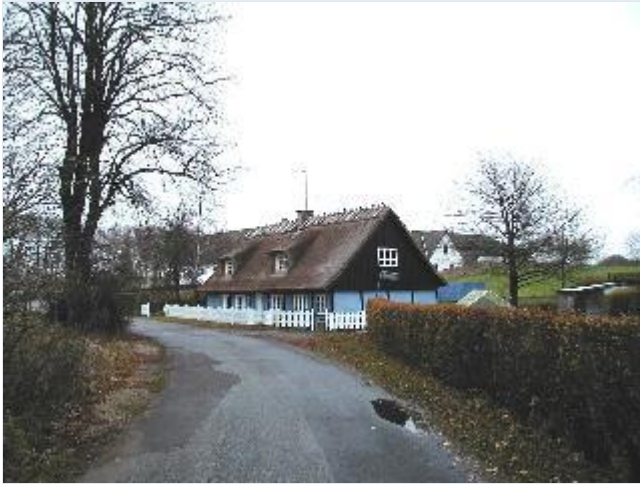
Foto: 10. Blåkalket bindingsværkshus med nyt stråtag og stakit mellem gårdene i landsbyen, fra sydvest Stort billede