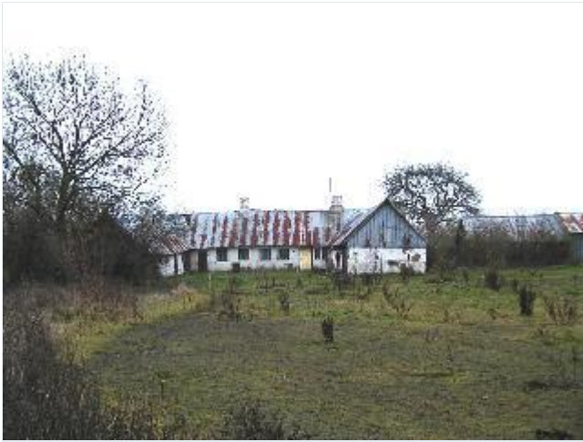
Foto: 11. Lille, stærkt forfalden trelænget gård med længer overvejende i bindingsværk, fra nord Stort billede