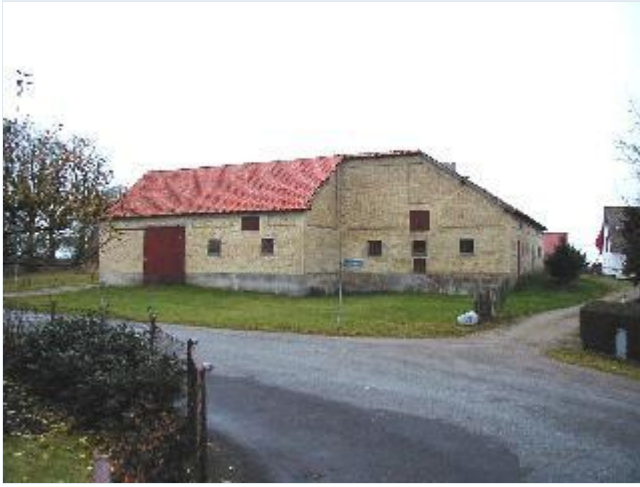
Foto: 5. De tilbageværende gulstens længer til landsbyens midterste gård, fra øst Stort billede