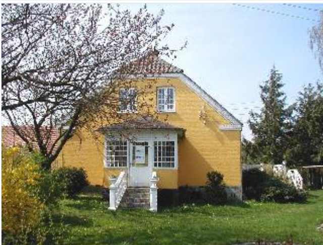
Foto: 3. Stuehuset til den østligste gård på sydsiden af bygaden (Nederskovvej 111), gavl Stort billede