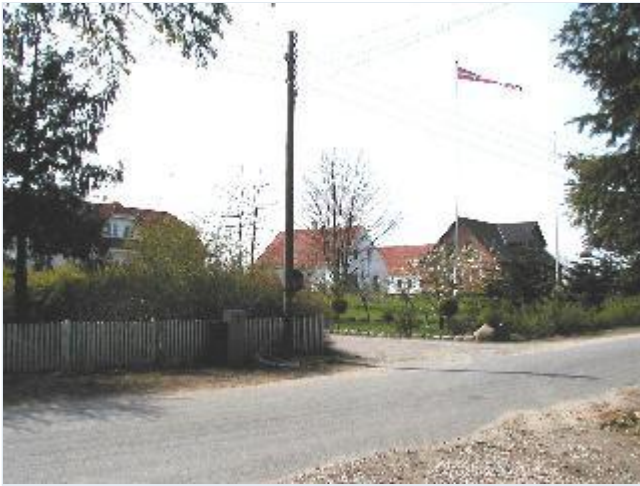
Foto: 2. To af de tre firelængede gårde på landsbygadens sydside (Nederskovvej 115 og 119) Stort billede