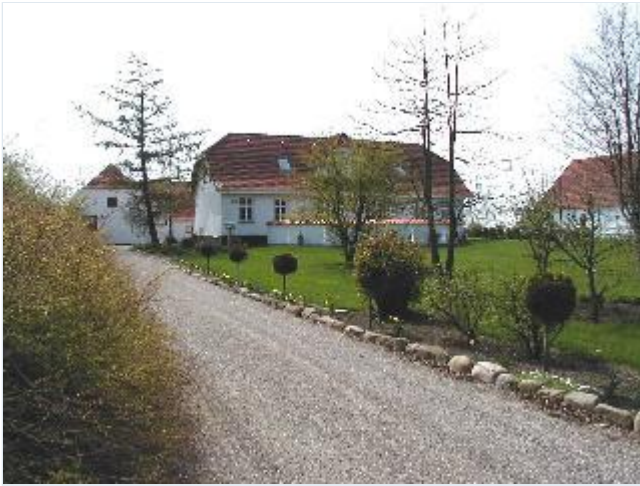
Foto: 6. Gården Nederskovvej 115, oprindelig i "Bedre byggeskik" Stort billede