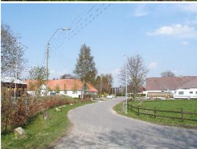
Foto: 4. Nederskovvejs indfald i landsbyen fra sydøst Stort billede