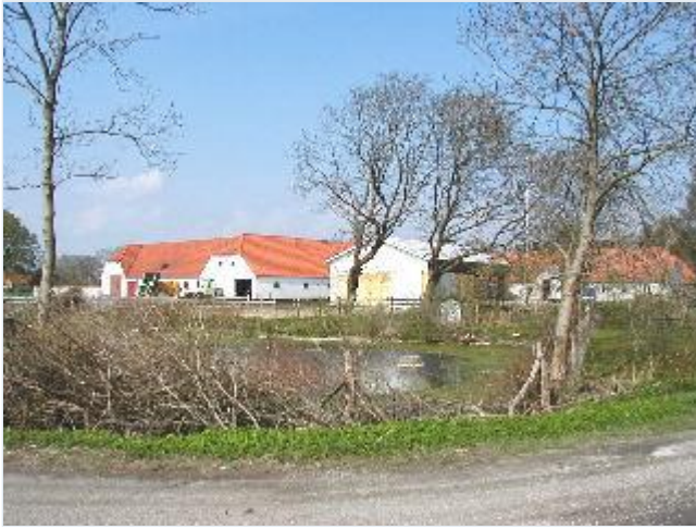
Foto: 5. Gadekær og bagsiden af de store gårde på sydsiden af bygaden Stort billede