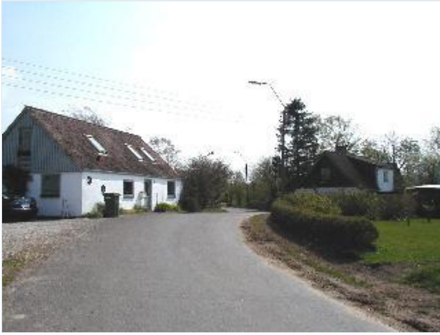
Foto: 1. Nederskovvejs indfald til landsbyen fra vest Stort billede