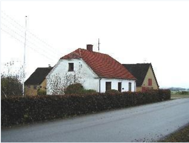
Foto: 2.Husmandssted yderst mod nord i landsbyen, fra sydøst Stort billede