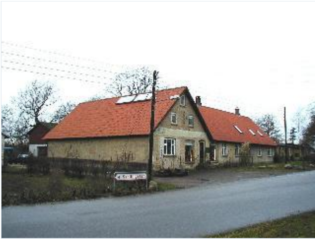
Foto: 6. Den store, gamle købmandsgård over for kirken, fra sydøst Stort billede