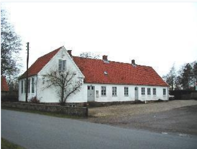
Foto: 3.Landsbyen tidligere hovedskole ved kirken og præstegården, fra sydøst Stort billede