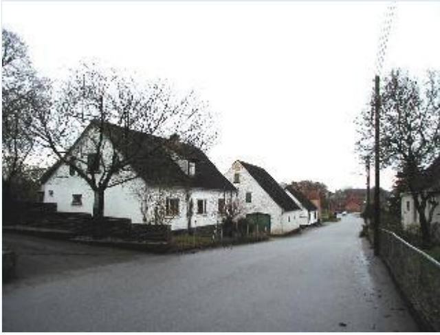
Foto: 9. Bebyggelsen på østsiden af landsbygaden med tidligere rejsestald og kro og flere forretninger, fra nord Stort billede