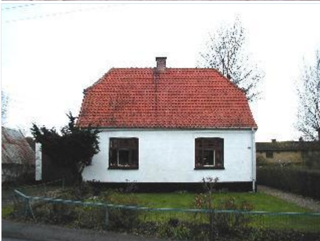
Foto: 12. Mindre hvidkalket villa over for gadekæret, fra øst Stort billede