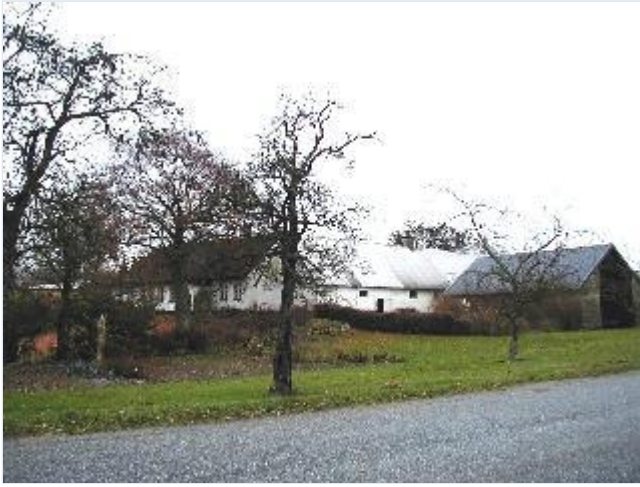
Foto: 13. Den sydligste gård bag husrækken på vestsiden af landsbygaden, fra sydvest Stort billede