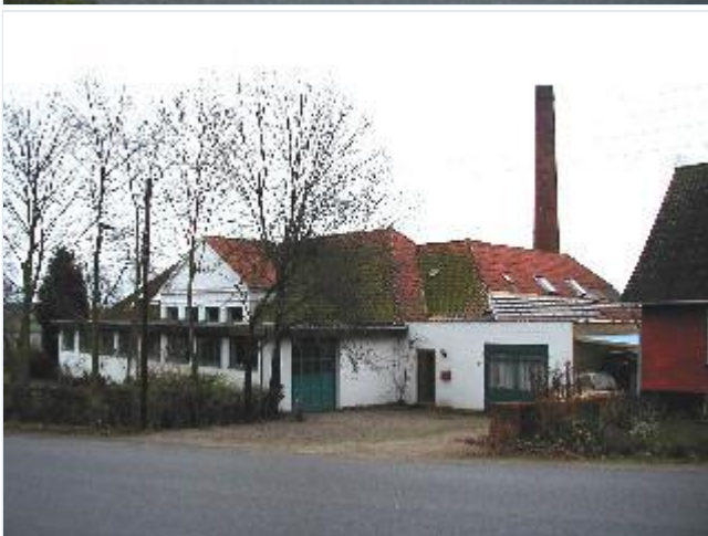
Foto: 4.Det tidligere andelsmejeri fra 1926 øst for landsbyen, fra nordvest Stort billede