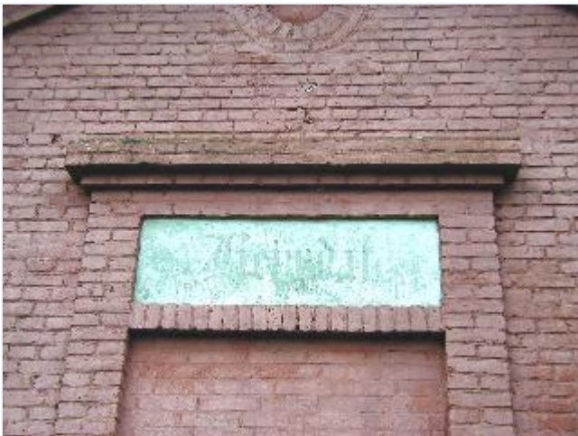
Foto: 11. Forsamlingshusets gamle indgangsparti i vestgavlen, fra vest Stort billede