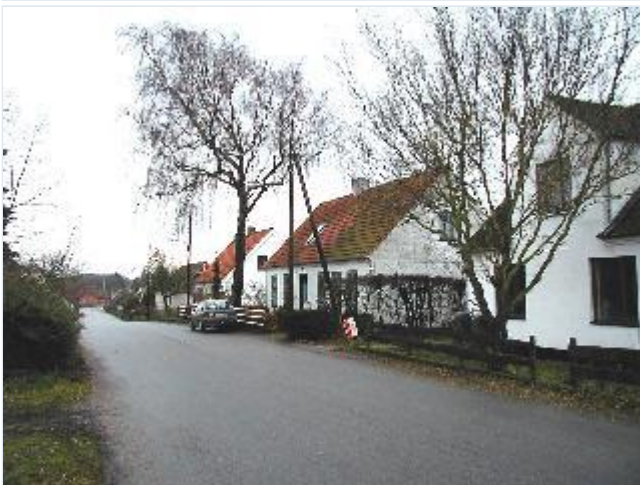
Foto: 7. Husrækken på vestsiden af landsbygaden, fra nordøst Stort billede