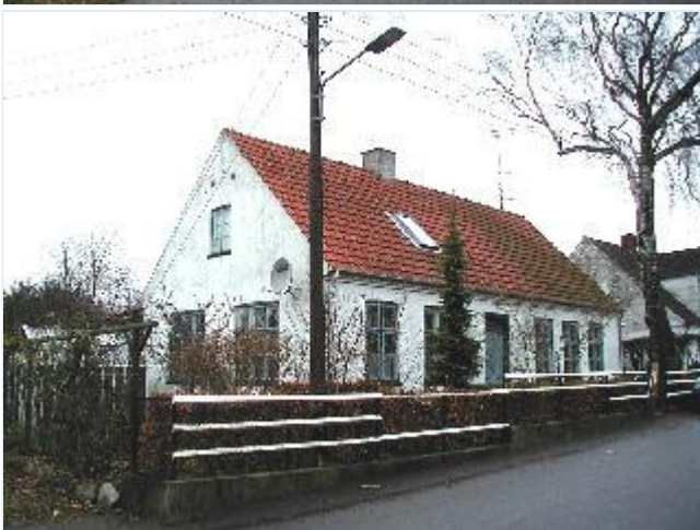
Foto: 8. Den tidligere forskole på vestsiden af landsbygaden, fra sydøst Stort billede