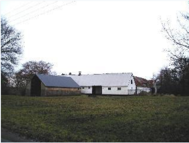
Foto: 14. Den sydligste gård på vestsiden af landsbygaden, driftsbygningerne, fra sydøst Stort billede