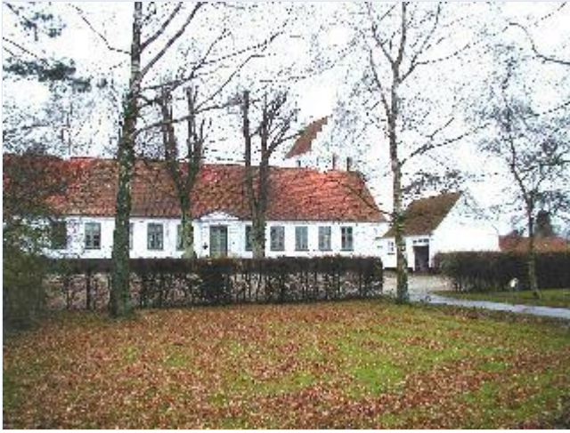
Foto: 1.Præstegården nordligst i landsbyen, fra nordvest Stort billede