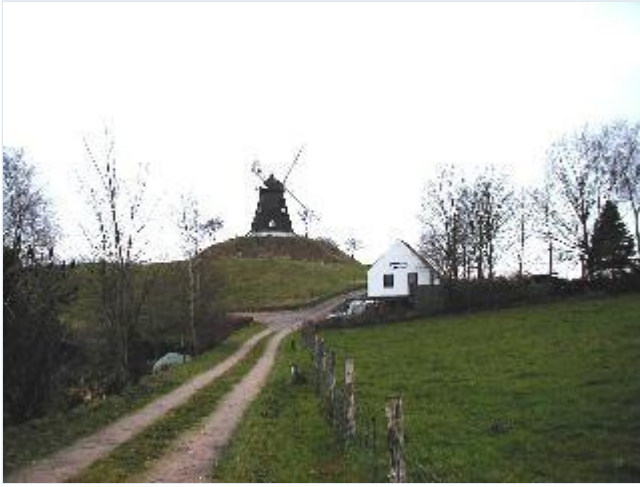
Foto: 5. Den smukt restaurerede Skamstrup Mølle på Gerrebjerg øst for landsbyen, fra nord Stort billede