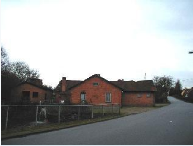
Foto: 10. Forsamlingshuset "Højmdal" ved gadekæret sydligt i landsbyen, fra nord Stort billede