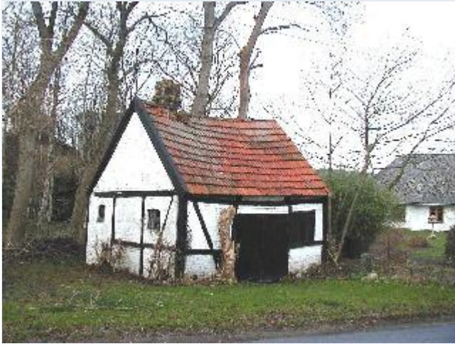
Foto: 5. Den lille smedie i bindingsværk over for kirken, fra sydøst Stort billede