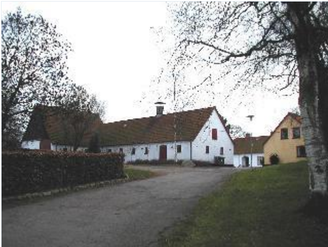
Foto: 2.Den firelængede Sønder Jernløse Præstegård med gulkalket sidelænge og hvidkalkede driftsbygninger og stuehus lige øst for kirkegården, fra nord Stort billede