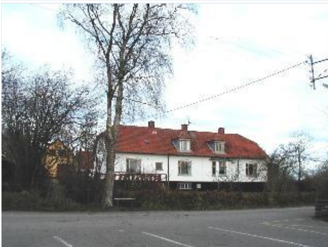
Foto: 3.Præstegårdens hvidkalkede stuehus, fra syd Stort billede