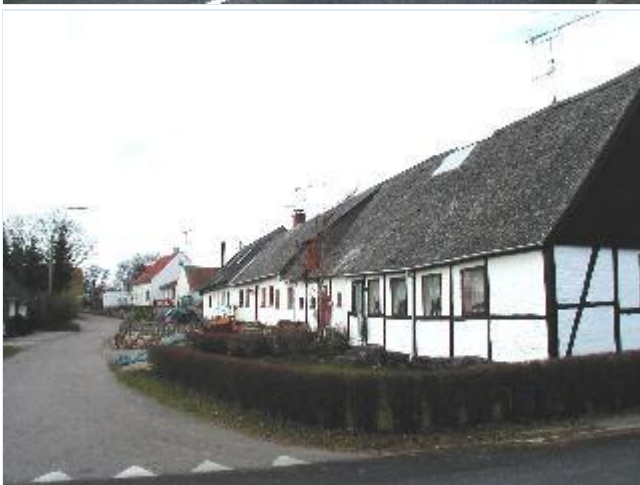
Foto: 8. Delvis sammenbygget række af arbejderboliger, de fleste i bindingsværk, i Strædet sydligt i landsbyen, fra øst Stort billede