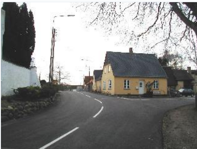
Foto: 11. Landsbygaden forbi kirkegårdsmuren, fra nord Stort billede