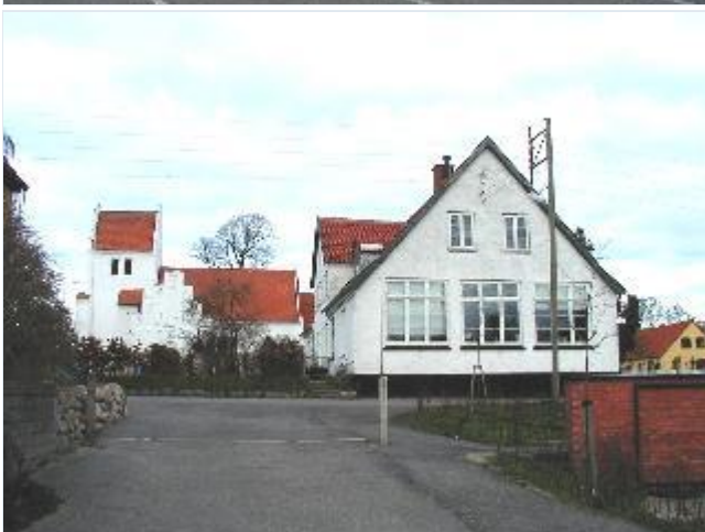
Foto: 4.Den gamle, hvidkalkede skolebygning fra 1924 syd for kirkegården, fra syd Stort billede