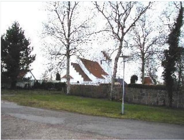
Foto: 1.Sønder Jernløses romanske sognekirke midt i landsbyen, fra nordøst Stort billede