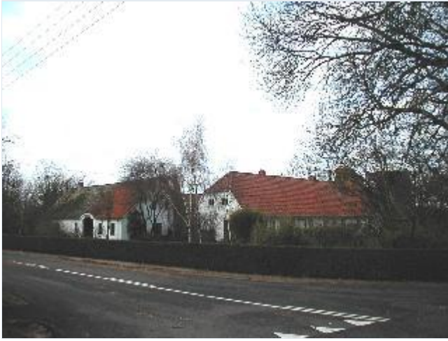
Foto: 9. Én af landsbyens få tilbageværende gårde, Kirkebjerggård, over for kirken ved Krøjerupvej, fra sydøst Stort billede