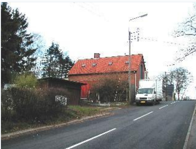
Foto: 7. Købmandsgårdens lagerbygning sammenbygget med forretningen, fra syd Stort billede