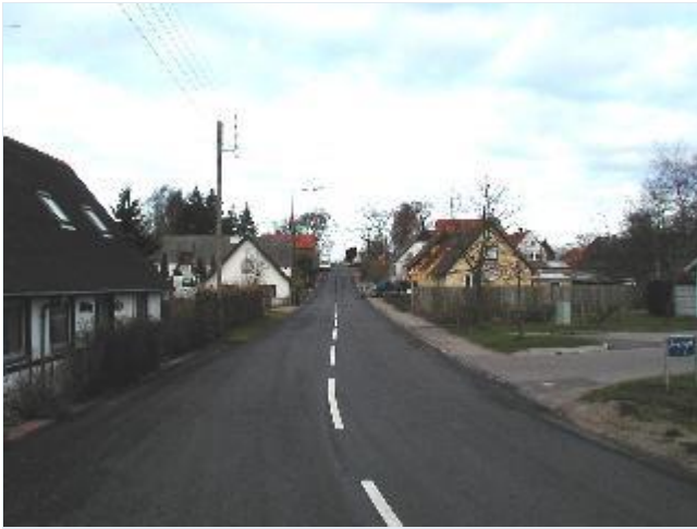
Foto: 10. Landsbygaden (Sønder Jerløsevej) gennem Sønder Jernløse, fra syd Stort billede