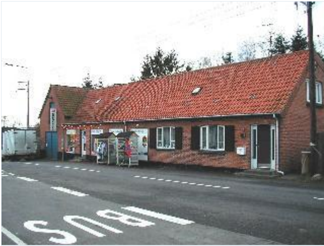
Foto: 6. Købmandsgården på vestsiden af landsbygaden (Sønder Jernløvsvej) over for skolen, fra nordøst Stort billede