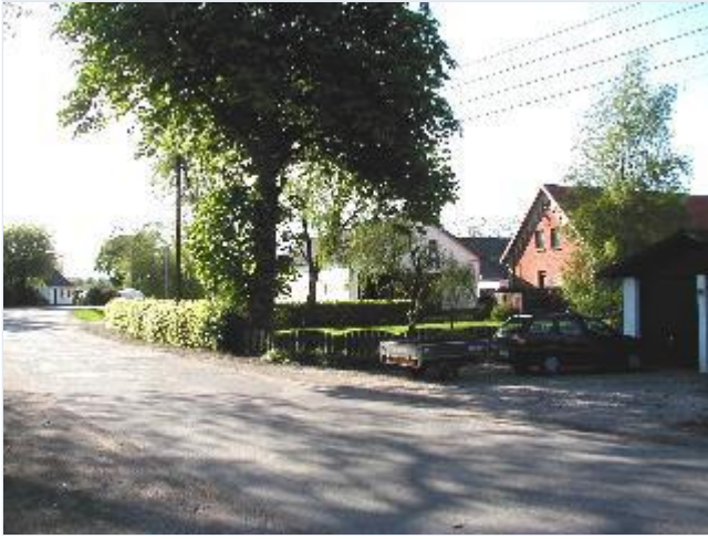
Foto: 7. Gården nord for bygaden, set mod vest