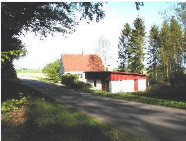
Foto: 9. Skovløbersted i Sønderkov vest for landsbyen, fra nordvest