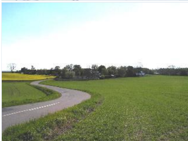
Foto: 1. Landsbyen fra nordøst Stort billede

Foto: Kort: De sorte tal på kortet viser numre på fotografierne og hvor fotografierne er taget fra Stort billede