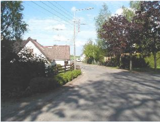
Foto: 8. Småhuse langs gaden i landsbyens østlige del