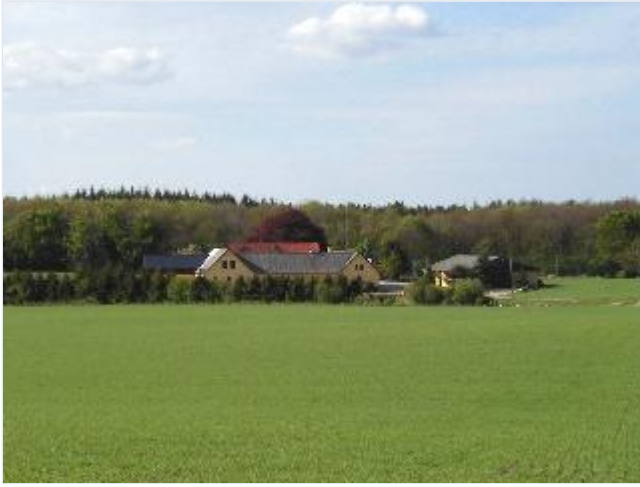
Foto: 3. Udflyttet gård nord for landsbyen, fra syd