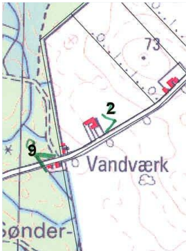
Foto: Kort: De sorte tal på kortet viser numre på fotografierne og hvor fotografierne er taget fra Stort billede