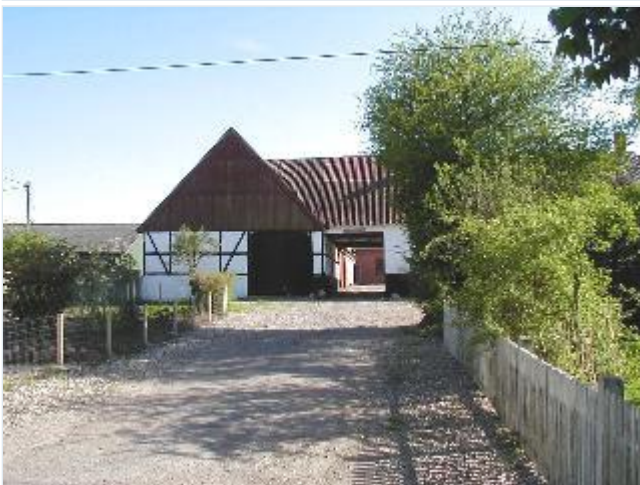
Foto: 5. Den midterste af de store gårde på sydsiden af gaden bag gadehusene