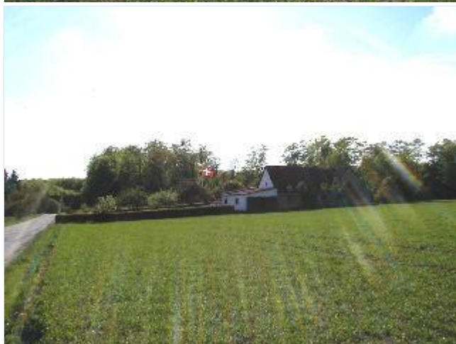
Foto: 2. Husmandssted sydvest for landsbyen Stort billede

Foto: 1. Landsbyen fra nordøst Stort billede