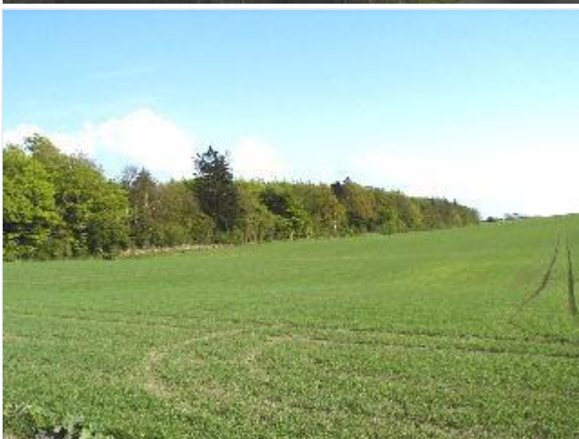
Foto: 10. Skovbryn ved Rullebanke, Mølleskov, øst for landsbyen, fra Stenhallervej mod sydøst