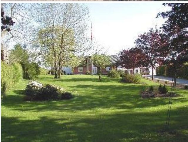
Foto: 6. Den østligste gård syd for gaden, fra nord