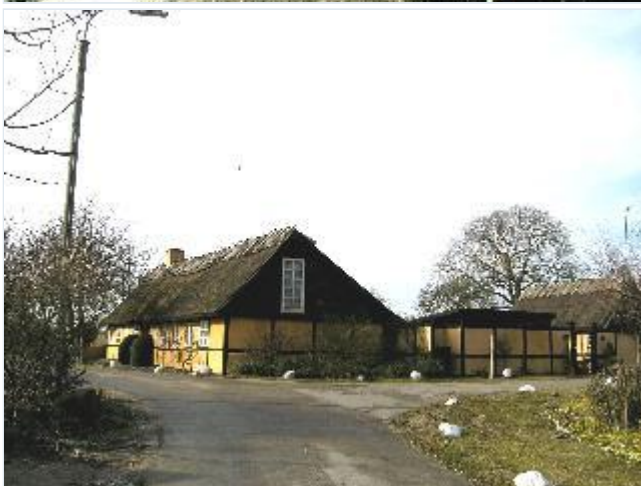
Foto: 7. Velbevaret bindingsværkshus med udskud på hjørnet af Næsbygade og Enghavegårdsvej, fra øst Stort billede