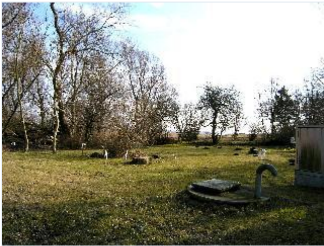
Foto: 25. Lille fælles grønning syd for fiskerhusrækken, fra nord Stort billede