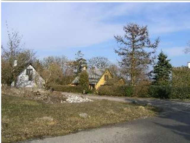
Foto: 16. De nordøstligste huse ved Næsbygade, fra sydvest