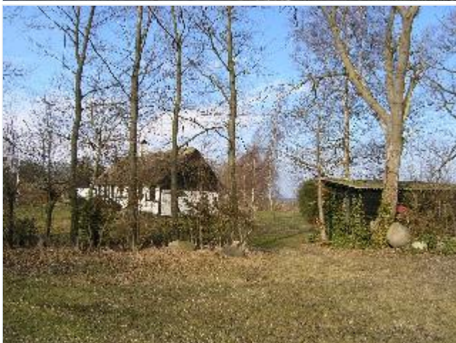
Foto: 24. Det sydligste af de tidligere fiskerhuse i bindingsværk tæt ved stranden, fra syd Stort billede