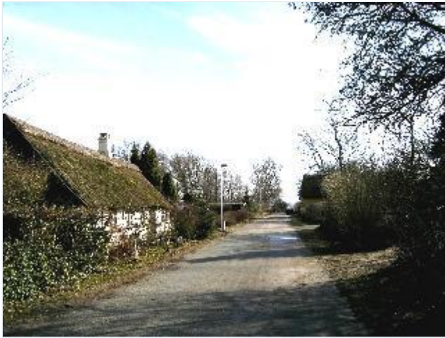
Foto: 22. Den sydlige del af husene langs Snavevej mod færgestedet, fra nord Stort billede