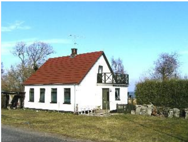
Foto: 19. Et af de små fiskerhuse direkte til vandet på Snavevej, fra sydvest Stort billede