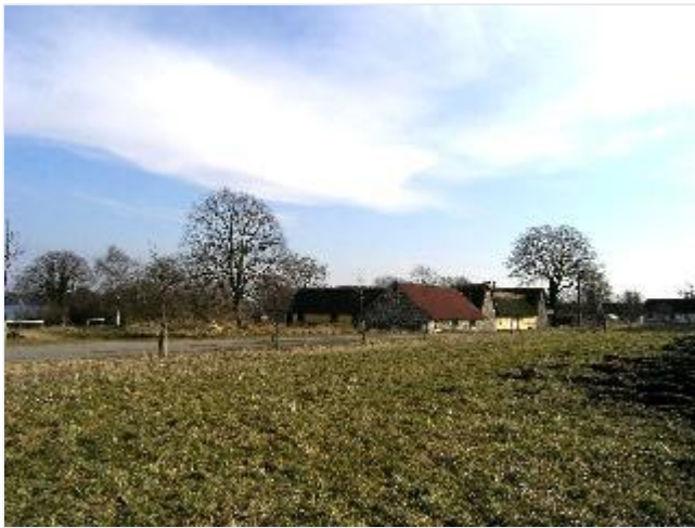
Foto: 1. Den nordvestligste gård i Næsby med kampestenslænge og -gavle, fra nordvest Stort billede