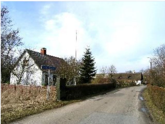
Foto: 11. Den sydlige del af landsbygaden (Næsbyvej) med mindre beboelseshuse med haver og hække, fra syd Stort billede