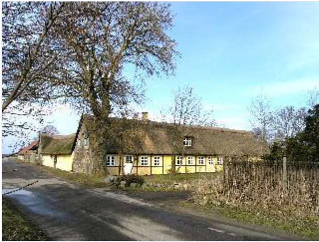
Foto: 2. Det stråtækte bindingsværksstuehus til den nordvestligste gård i byen, fra syd Stort billede