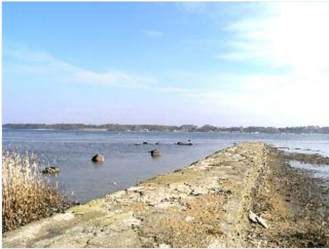
Foto: 26. Kampestensmolen (med cementbehandling) ved det tidligere Snave Færgested (færge til Rendebæk), syd for Næsby, fra vest Stort billede