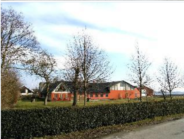
Foto: 12. Den sydligste gård, Højagergård, med moderne udlænger, fra vest Stort billede