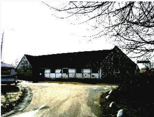
Foto: 6. Landsbyens vestligste gård, med kampestensgavl, fra øst Stort billede