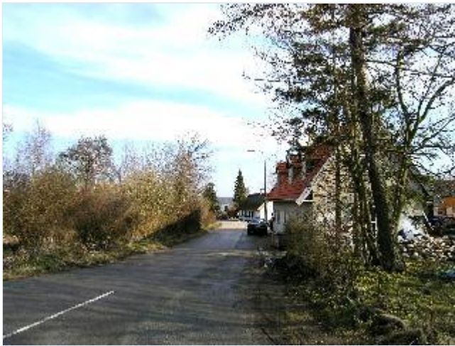
Foto: 13. Den sydlige del af Næsbygade mod Issefjordens Østerløb, fra vest