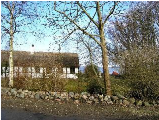
Foto: 23. Det sydligste af de gamle fiskerhuse på Snavevej, fra vest Stort billede