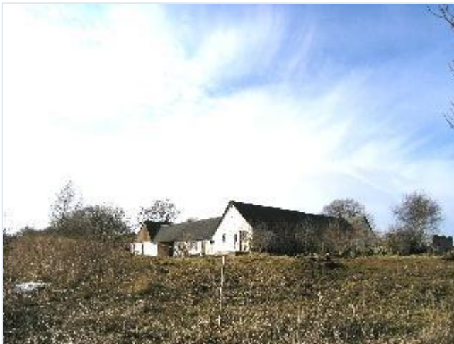
Foto: 3. Den nordøstligste gård i byen beliggende på skråningen over strandene langs kysten, fra sydøst Stort billede