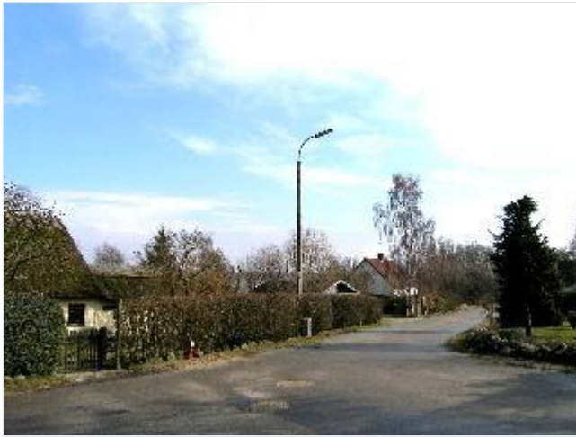
Foto: 18. En del af husrækken mod vandet langs Næsbygade og Snavevej, fra nord Stort billede