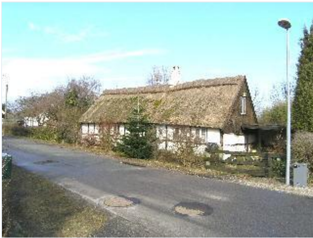
Foto: 21. Langt fiskerhus i bindingsværk med grund til vandet, på Snavevej, fra sydvest Stort billede