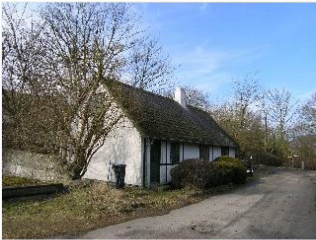
Foto: 17. Lille bindingsværkshus bag Truelskærgård, fra syd Stort billede