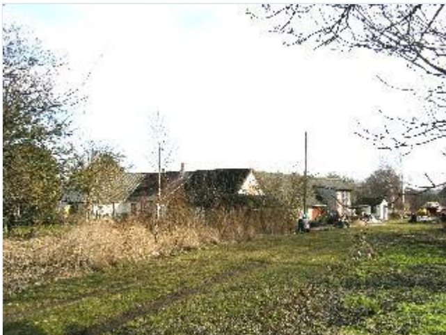
Foto: 4. Den nordøstligste firelængede gård, fra nordvest Stort billede