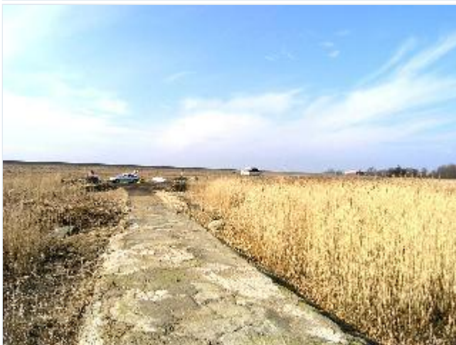
Foto: 27. Molen og den lille vendeplads med vinteroplagte småbåde ved det tidligere Snave Færgested, fra øst Stort billede