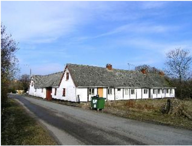
Foto: 10. Den midterste gård i byen, stuehuset i bindingsværk, fra sydvest Stort billede