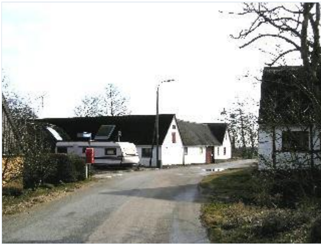
Foto: 5. Den midterste gård i byen, fra nordvest Stort billede