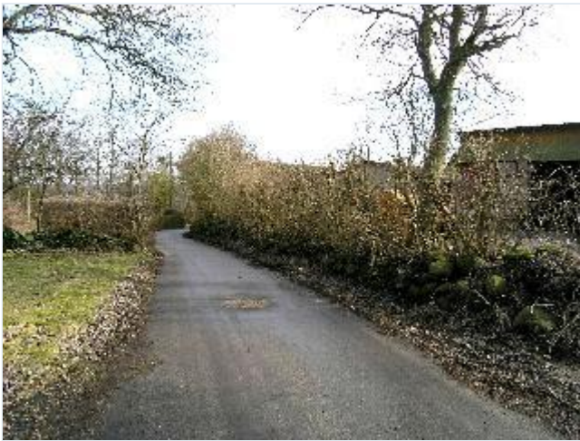
Foto: 9. Den nordlige del af landsbygaden (Næsbygade) kantet af gammelt toftedige, fra vest Stort billede