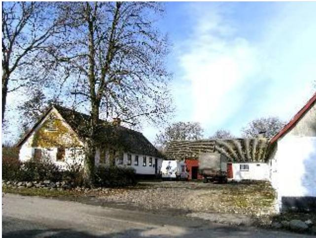
Foto: 14. Den østligste gård i byen, Truelskærgård, fra syd