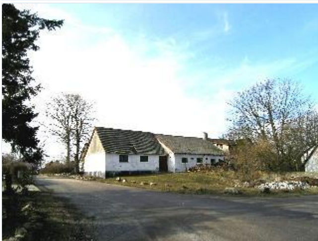
Foto: 15. Truelskærgårds østlænge og tidligere møddingsplads, fra sydøst