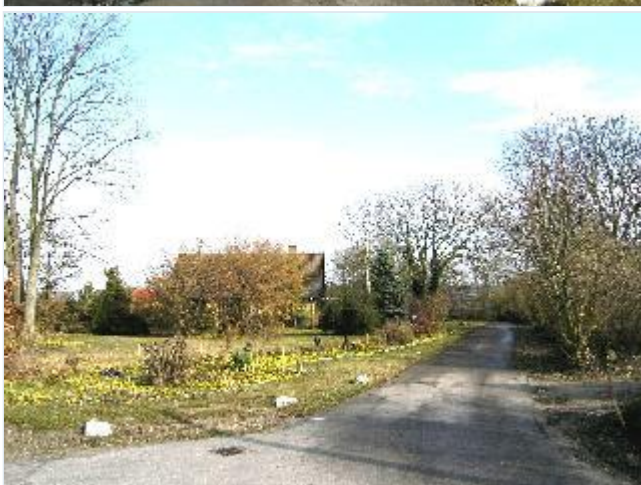
Foto: 8. Moderne villa på den tidligere skolelod, omtrent hvor landsbyens skole lå, fra vest Stort billede