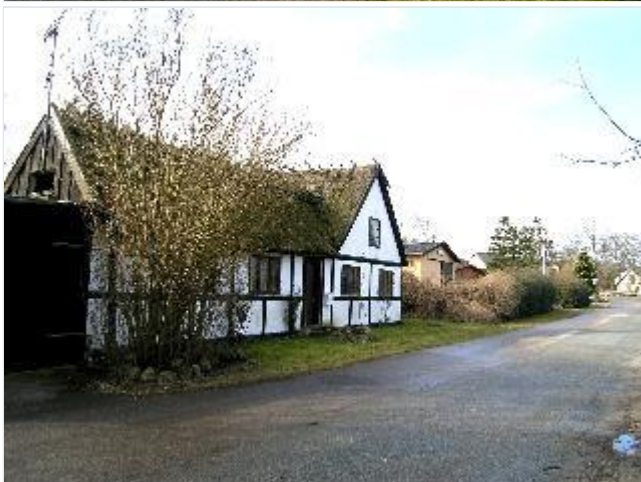
Foto: 20. Vinkelbygget bindingsværkshus på "landsiden" af Snavevej, fra sydøst Stort billede