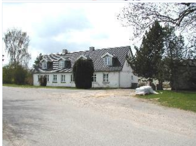
Foto: 1. Beboelsen til den sydvestlige gård i byen (Marupvej 15) Stort billede