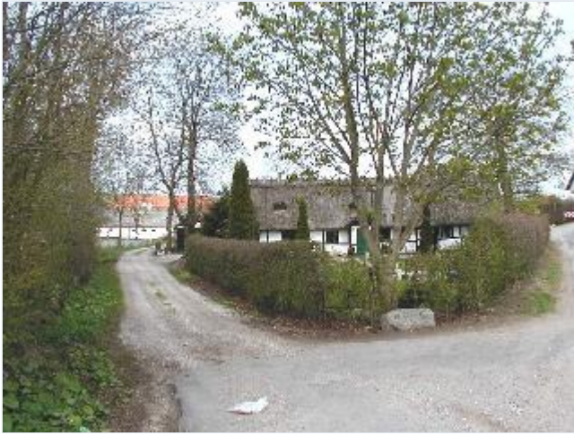
Foto: 2. Kik til den nordvestligste gård i landsbyen (Marupvej 21) og gadehus (Marupvej 23) Stort billede