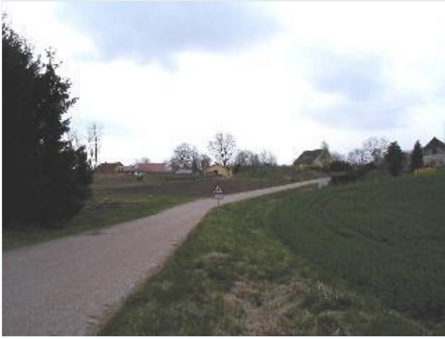
Foto: 6. Indfaldsvejen fra nordøst Stort billede