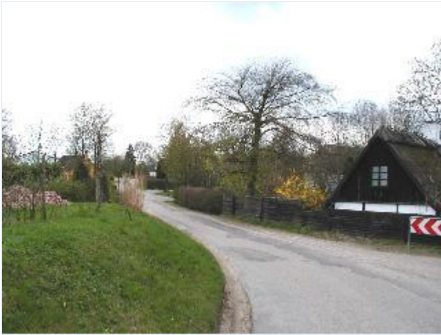
Foto: 3. Gadeforløbet gennem byen fra nord Stort billede