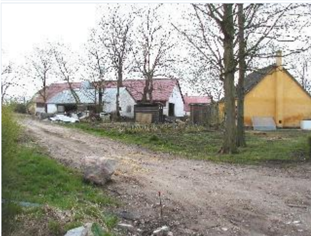
Foto: 4. Den sydøstlige gård i landsbyen (Marupvej 14) og gadehus, fra nord Stort billede