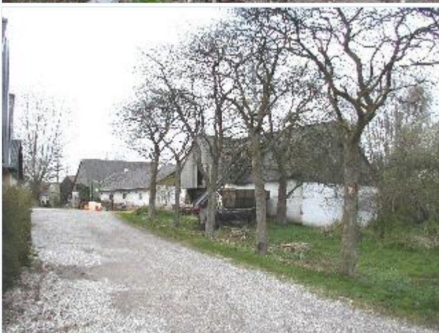
Foto: 5. Den midterste gård mod vest (Marupvej 19), set langs de sydligste bygninger Stort billede