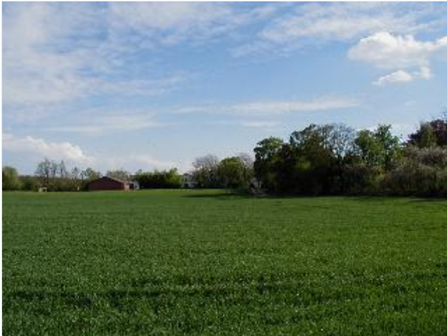
Foto: 3. Den østligste gård, Byagergård, set fra nord