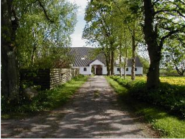
Foto: 2. Indkørslen til Jonstrupgård, fra nord