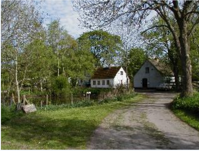
1. Småhuse syd for gadekæret, fra nordvest