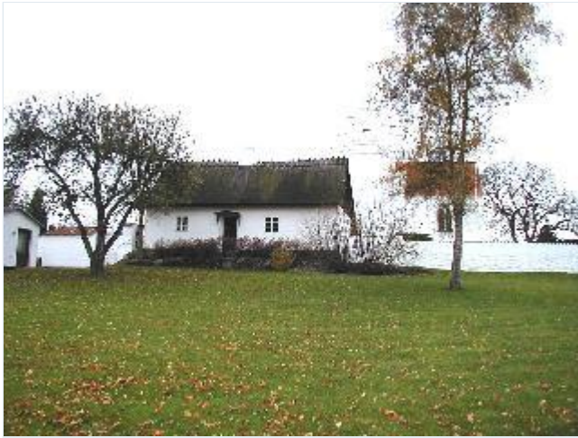
Foto: 3. Den tidligere kirkelade indbygget i kirkegårdsmuren øst for kirken, fra øst Stort billede