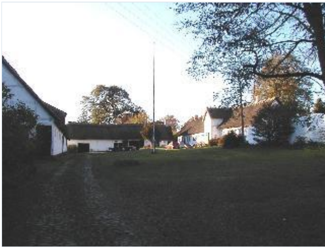
Foto: 2. Den store fredede præstegård med stuehus og vest- og sydlænge med overkalket bindingsværk fra ca. 1700 syd for kirkegården, fra øst Stort billede