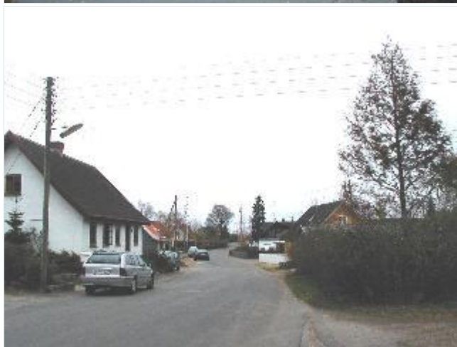
Foto: 7. Den østlige del af bygaden med gadehuse fra forskellige perioder, fra nordvest