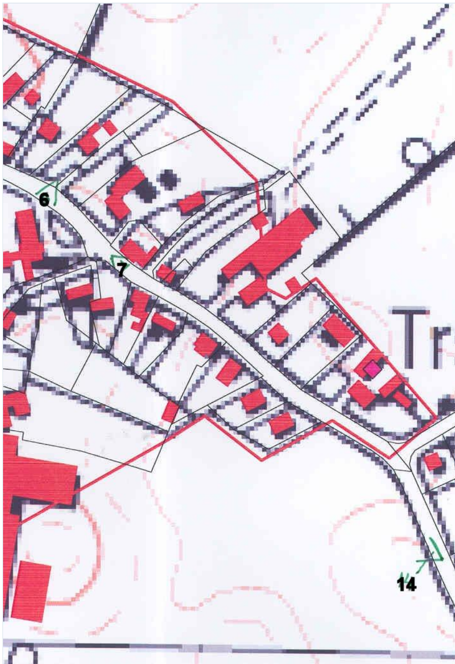
Foto: Kort: De sorte tal på kortet viser numre på fotografierne og hvor fotografierne er taget fra.