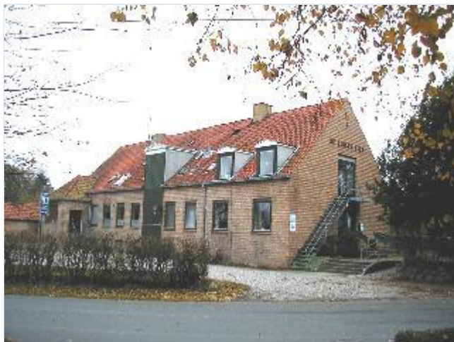
Foto: 6. Byens tidligere alderdomshjem - nu vandrerrhjem - vest for kirke- og præstegård, fra vest