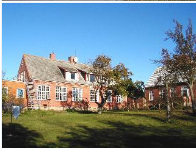
Foto: 12. Skolen (opført 1906 med senere til- og ombygninger, nu efterskole) i den lille bebyggelse omkring skole og forsamlingshus sydvest for landsbyen, fra sydvest Stort billede