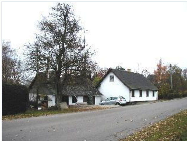
Foto: 11. Tidligere smedie i landsbyens sydvestlige udkant, fra nord Stort billede