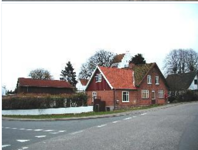
Foto: 8. Tidligere købmandsforretning på gadehjørnet vest for kirken, fra vest