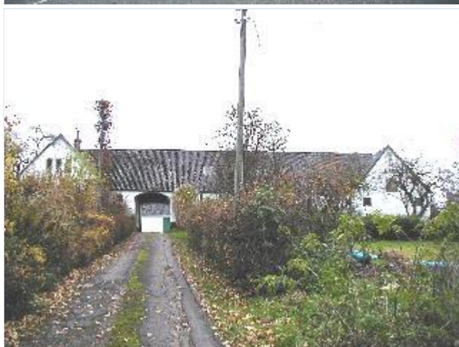
Foto: 9. Æn af de få tilbageværende gårde i landsbyen beliggende lidt tilbagetrukket fra gaden vest for kirken, fra øst