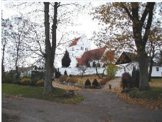
Foto: 1. Hjembæk kirke på sit højdedrag med præstegården til venstre og den tidligere kirkelade (med udhus) til højre, fra sydøst