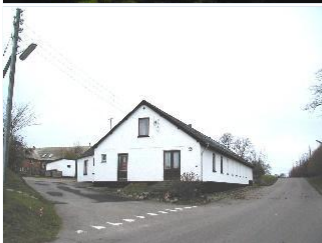
Foto: 13. Forsamlingshuset i den lille bebyggelse sydvest for den gamle landsby, fra nord Stort billede