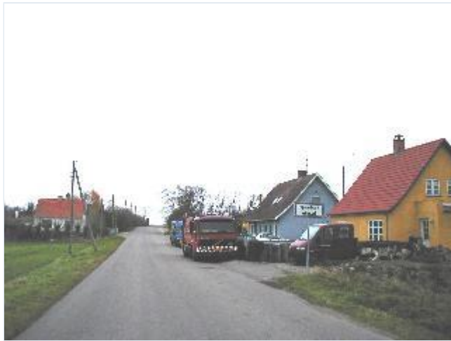
Foto: 14. Mindre beboelseshuse i bebyggelsen omkring skole og forsamlingshus sydvest for landsbyen, fra sydvest Stort billede