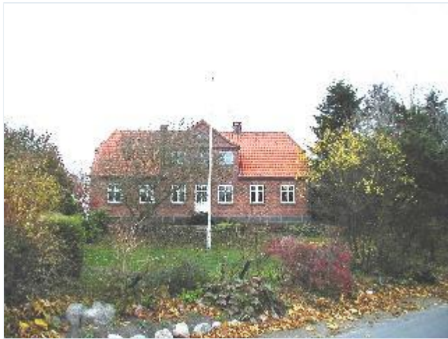
Foto: 10. Harmonisk grundmuret stuehus til mindre gård nordøst for kirken, fra vest Stort billede