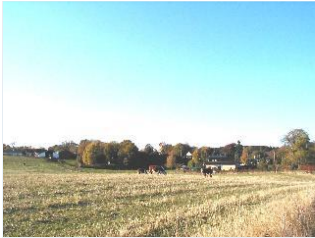
Foto: 15. Landsbyen Hjembæk med den højtliggende kirke og mange gamle træer i og omkring byen, fra øst Stort billede