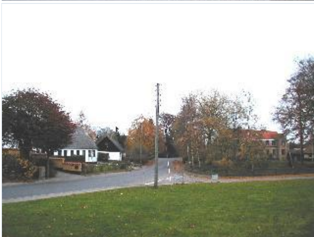
Foto: 5. Den centrale forte foran kirkegården med gadekær (i krattet til højre), bygade og gadehuse, fra vest Stort billede