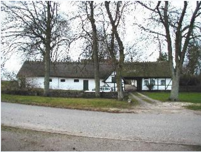
Foto: 2. Firelænget gård i bindingsværk på vestsiden af landsbygaden, fra øst Stort billede