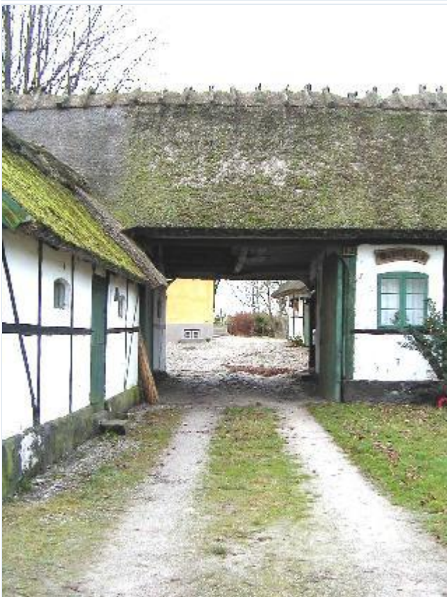
Foto: 3. Portåbning til den brolagte gårdsplads i den sydvestlige gård, fra øst Stort billede