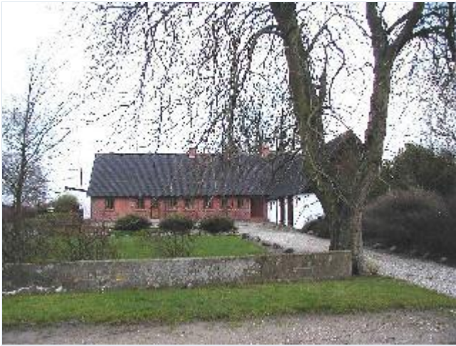
Foto: 5. Rødstens stuehus og hvidkalket sidelænge af tidligere firelænget gård nordligst på østsiden af landsbygaden, fra vest Stort billede