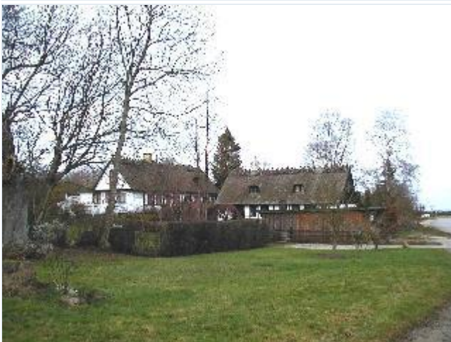
Foto: 6. Landsbyen Dramstrup To mindre huse i bindingsværk vest for landsbygaden, fra sydøst Stort billede