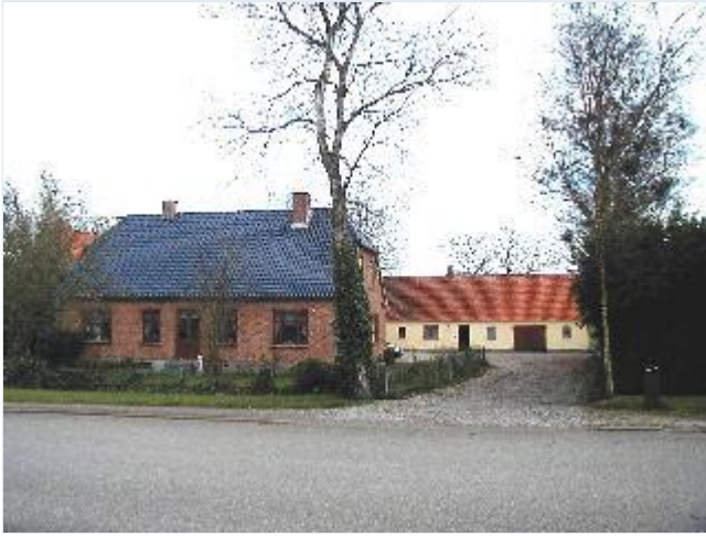
Foto: 4. Den midterste, tidligere firelængede gård på østsiden af landsbygaden med gulkalket staldlænge og stuehus i røde sten, fra vest Stort billede