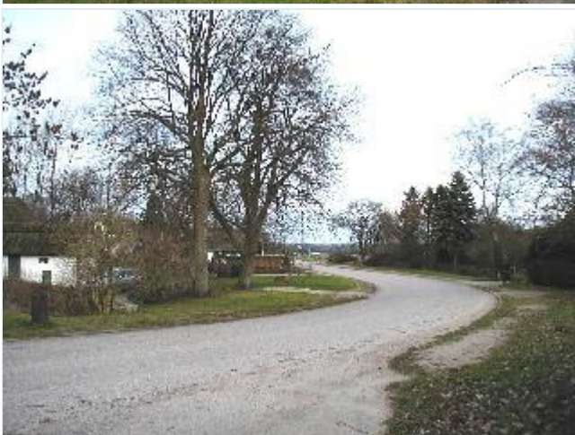
Foto: 7. Den brede landsbygade gennem Dramstrup, fra syd Stort billede