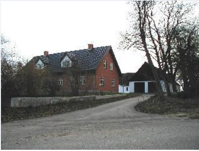
Foto: 1. Den sydligste gård i landsbyen med 4 hvidkalkede længer og stort stuehus i røde sten, fra nord Stort billede