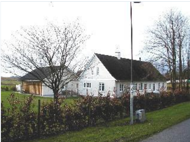
Foto: 16. Stuehus og moderne udlænge til den vestligste gård på sydsiden af bygaden, fra øst Stort billede