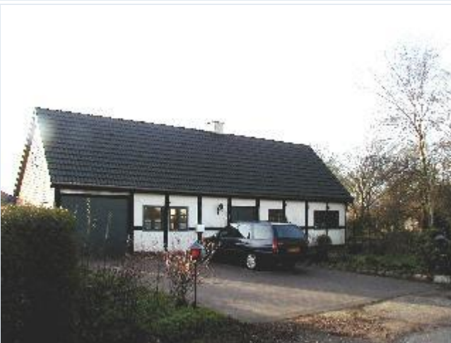
Foto: 3. Lille hus i bindingsværk over for kirken, fra nord