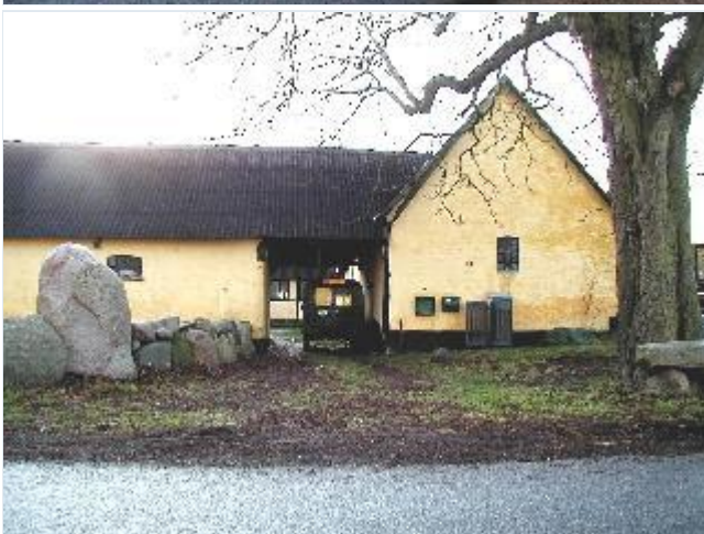
Foto: 8. Den østligste gård på sydsiden af bygaden, fra nord Stort billede