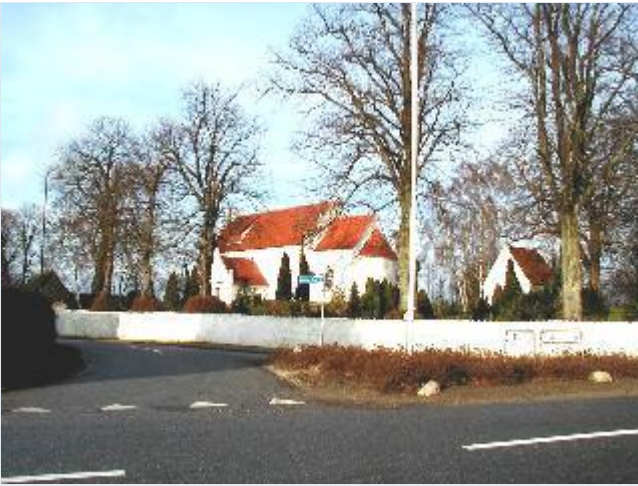
Foto: 1. Butterups fine lille romansk kirke ligger længst mod øst i byen, fra sydøst