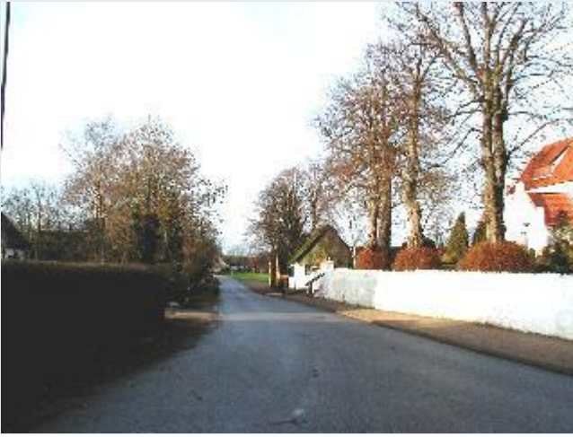
Foto: 2. Den østlige del af landsbygaden (Butterup Byvej), fra øst