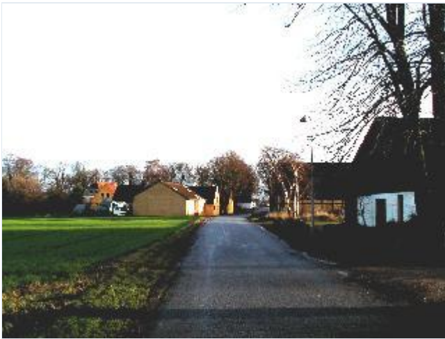
Foto: 9. Den østlige del af Butterup Bygade med gårde på begge sider, fra vest Stort billede