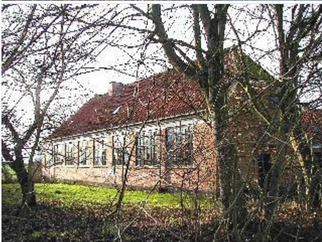
Foto: 12. Skolens østlige længe, fra nordøst Stort billede