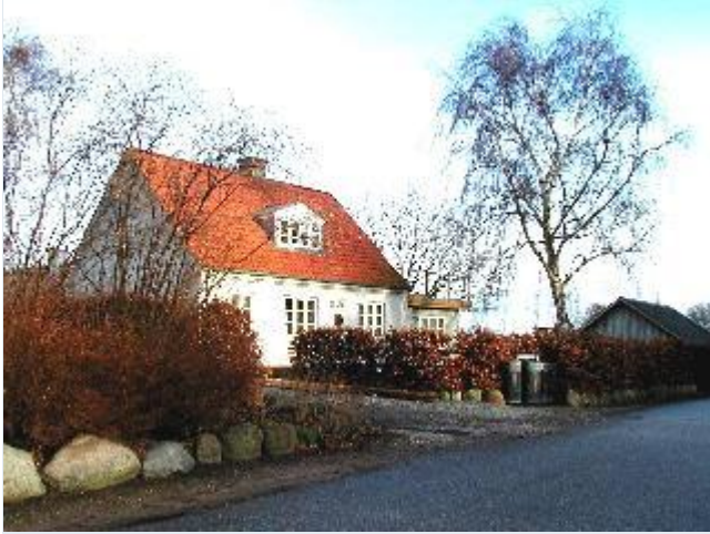
Foto: 14. Mindre villa på nordsiden af bygaden i den vestlige del af byen, fra vest Stort billede