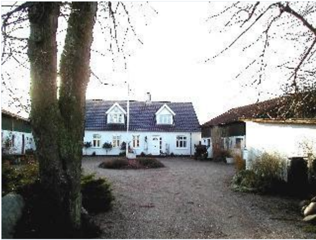
Foto: 10. Trelænget gård på sydsiden af bygaden, fra nord Stort billede