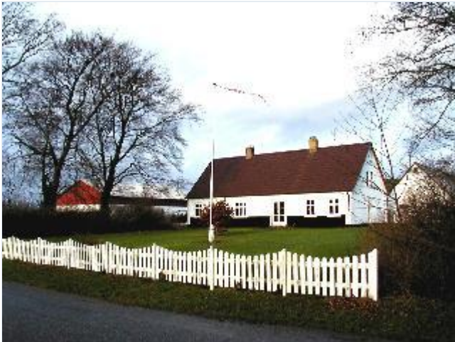
Foto: 15. Den vestligste gård på nordsiden af bygaden, fra syd Stort billede