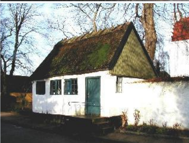
Foto: 4. Den lille ringerbolig, der er bygget ind i kirkegårdsmuren, fra sydøst