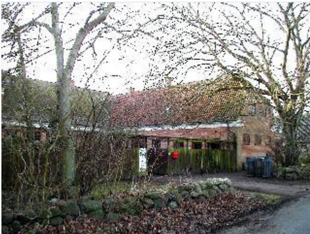
Foto: 11. Den trelængede skolebygning fra 1920 på sydsiden af bygaden, fra nordøst Stort billede