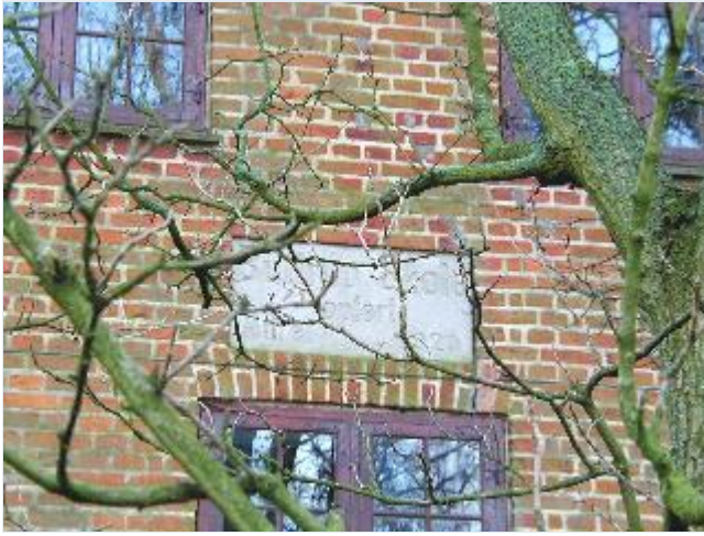
Foto: 13. Indskrifttavle, "Butterup Skole opført Aaret 1920", i østlængens nordgavl, fra nord Stort billede