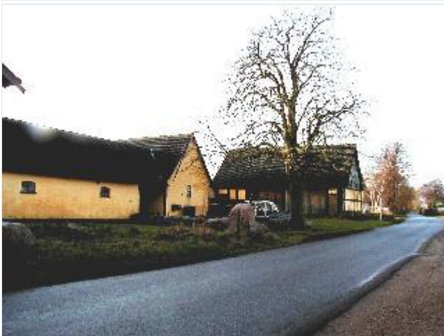
Foto: 7. Den tidligere smedie på sydsiden af Butterup Bygade, fra øst Stort billede