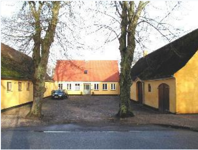
Foto: 6. Harmonisk lille trælænget gård vest for præstegården, fra syd Stort billede