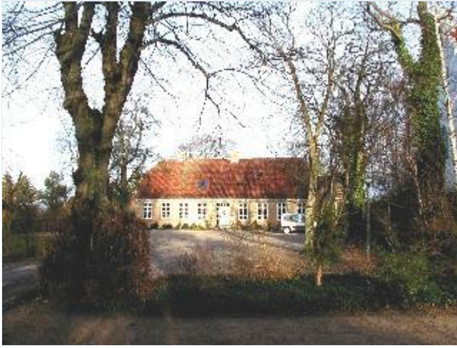
Foto: 5. Præstegården umiddelbart vest for kirken, fra sydvest Stort billede