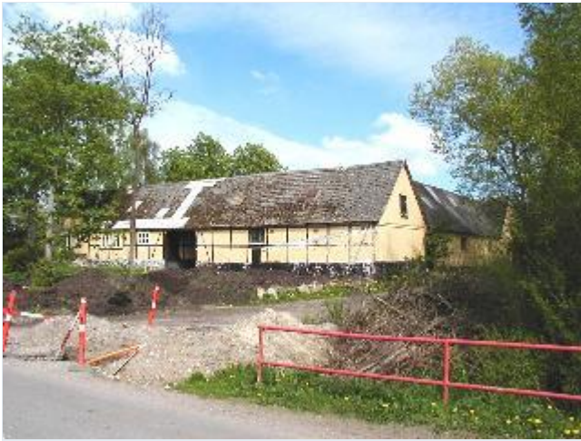
Foto: 2. Stor firelænget gård på østsiden af gaden (Bukkerupvej) centralt i landsbyen