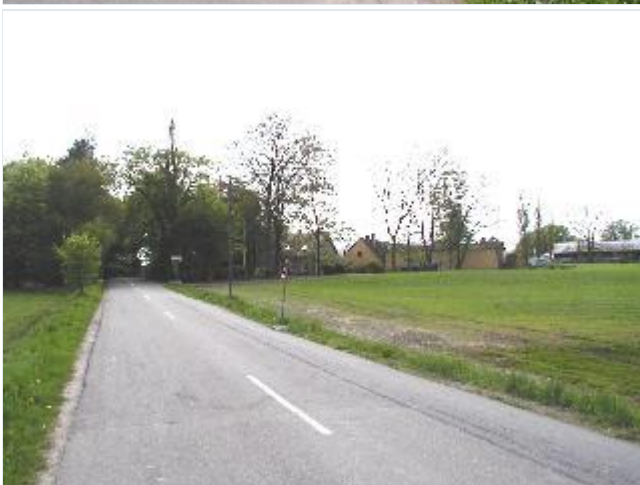
Foto: 4. Landsbyen set fra nord