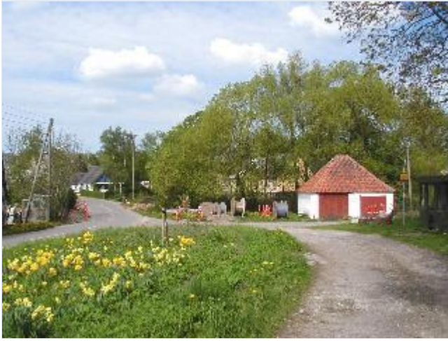
Foto: 1. Smedien ved åen i den sydlige del af landsbyen, fra syd