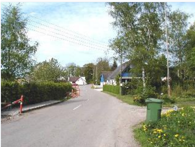
Foto: 3. Landsbygaden (Bukkerupvej) med gadehuse, fra centrum mod nord