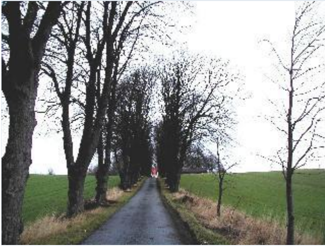
Foto: 2. Den lange allé op til pladsen for den tidligere hovedgård, Søgård, fra syd Stort billede