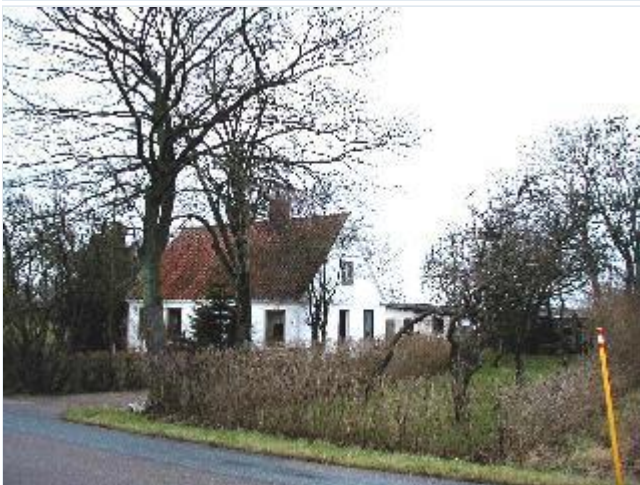
Foto: 4. Velbevaret lille husmandssted øst for Søgårdsvej på nordsiden af Gammel Skovvej, fra syd Stort billede