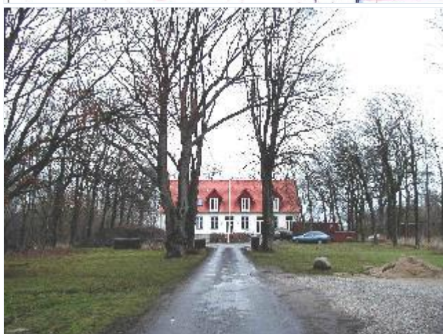
Foto: 1. Nyere hus på pladsen for den lille hovedgård Søgårds hovedbygning. Gården jorder blev i 1923 udstykket til statshusmandsbrug, fra syd