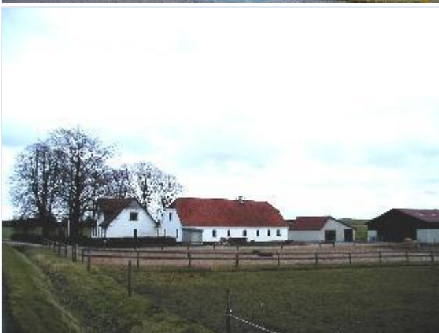
Foto: 5. Større, gårdlignende husmandssted i udstykningsen på sydsiden af Gammel Skovvej, fra vest Stort billede