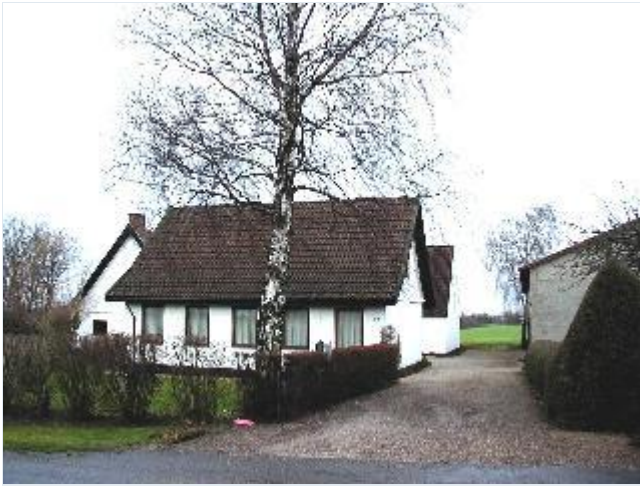
Foto: 3. Det vestligste husmandsbrug på nordsiden af Gammel Skovvej, i "Bedre Byggeskik", men med nyere tagløsning, fra syd Stort billede