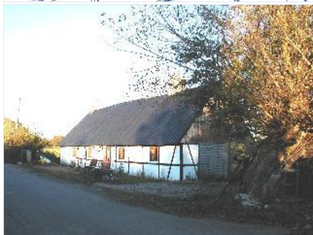
Foto: 1. Et af de få tilbageværende husmandshuse i bindingsværk i den ældste del af Kolonihuse (på østsiden af Kundby Koloni) fra omkring 1790, fra sydvest