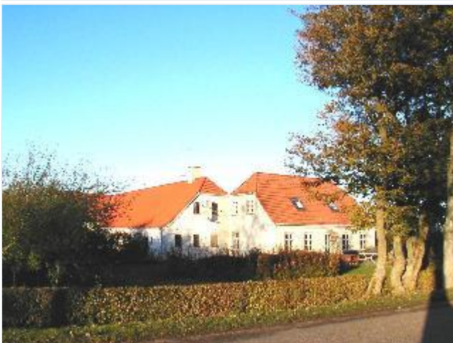
Foto: 4. Et af de husmandssteder, der i 1920-erne udstykkedes fra Vognserup og bebyggedes med huse i "Bedre Byggeskik". Stuehuset har fået moderne overfladebehandling, fra sydvest