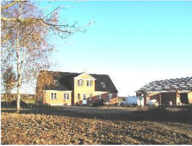
Foto: 2. Helt nyt "husmandshus" opført ved tomten af et af de oprindelige husmandssteder på østsiden af vejen Kundby Koloni, fra vest