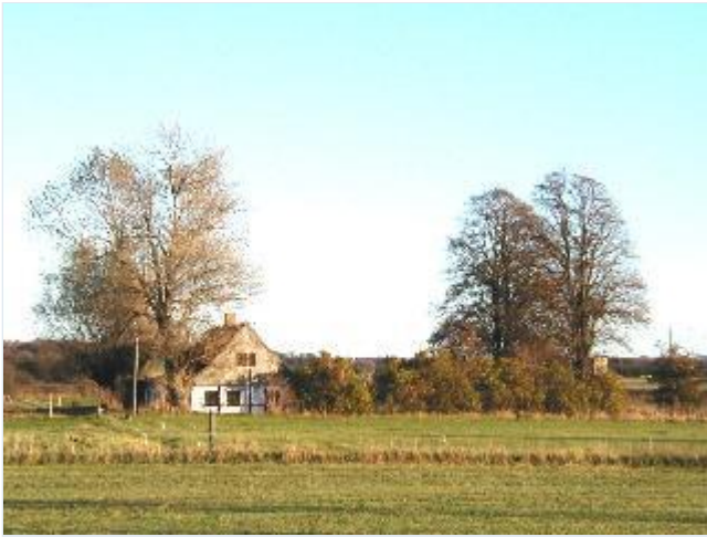
Foto: 3. Lille husmandshus i bindingsværk midt i den gamle del af Kolonihuse, fra vest