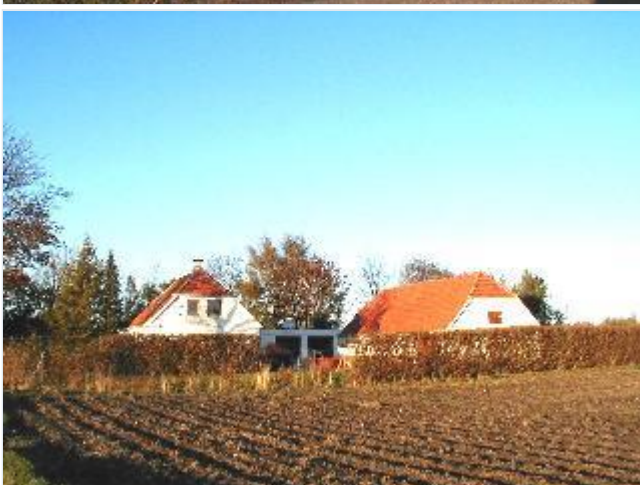
Foto: 5. Karakteristiske Bedre Byggeskik-gavle på et af de husmandssteder, der i 1920-erne blev udstykket fra Vognserup i den østlige del af bebyggelsen, fra syd