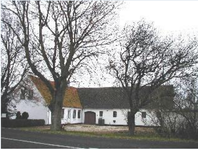
Foto: 5. Meget velbevaret og velholdt husmandsbrug i koloniens sydvestlige del, gårdspladsen med indkørselspartiet, fra nordøst Stort billede