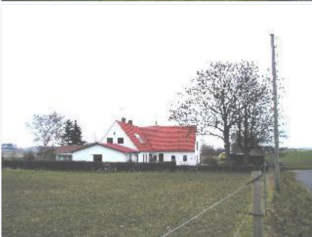
Foto: 3. Velbevaret husmandssted med sammenbyggede bygninger og nyere udbygning af stuehuset, i koloniens nordøstlige del, fra vest