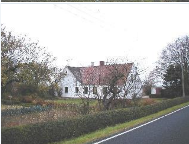
Foto: 4. Meget velbevaret brug (med nyere vinduer) med pryd- og køkkenhave, frugthave, hække og store træer mod vejen, i koloniens sydvestlige del, fra sydøst