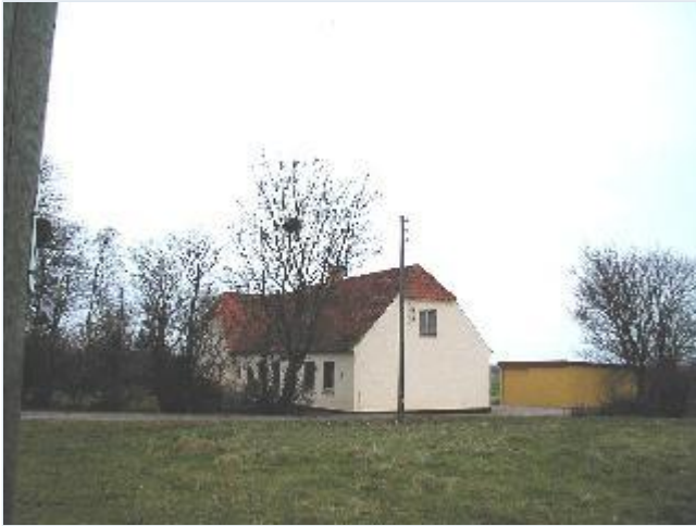
Foto: 1. Velbevaret statshusmandsbrug i koloniens nordlige del, fra øst