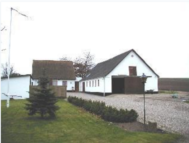
Foto: 2. Velbevaret husmandsbrug med separate bygninger i koloniens nordlige del, fra nord