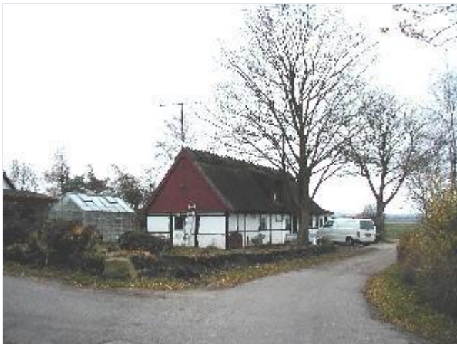
Foto: 21. Lille velbevaret landarbejderhus med bindingsværk og stråtag og rester af (sten-?)dige (under fjernelse) mod strædet i den sydvestligste del af landsbyen, fra nordøst Stort billede