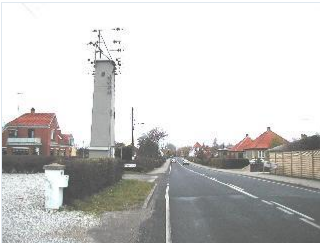
Foto: 14. Bebyggelsen i den yngre del af byen med villaer og butikker langs landevejen/hovedgaden, fra syd