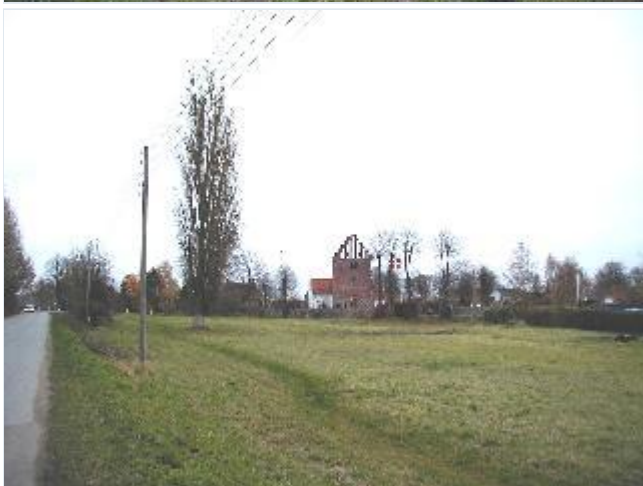
Foto: 3.Den åbne forte mellem Bjergbygård, kirken og den vestlige del af landsbyen, fra vest Stort billede