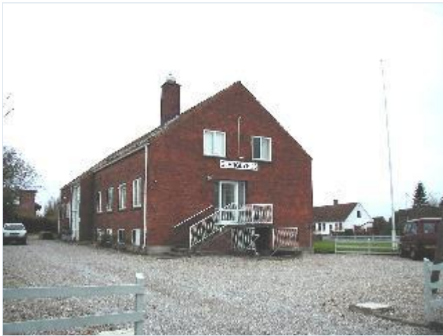
Foto: 9. Alderdomshjemmet fra 1953, nu med anden funktion, fra nord Stort billede