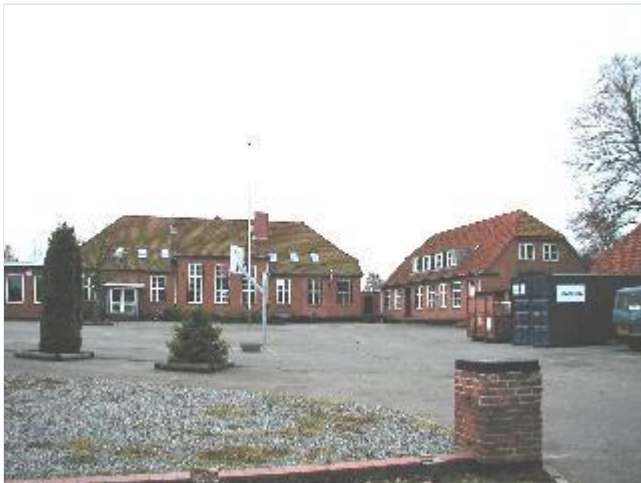
Foto: 7. Skolen fra 1930 (med senere ændringer) syd for kirken, fra nord Stort billede