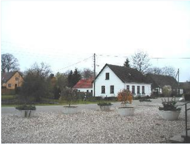
Foto: 6. Bebyggelsen med mindre huse nord for gadekæret i den østlige del af landsbyen, fra sydøst Stort billede