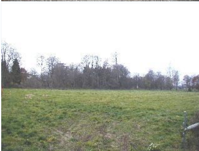
Foto: 2.Engen mellem gården og åen i forlængelse af Bjergbygårds haveanlæg, fra nordøst Stort billede