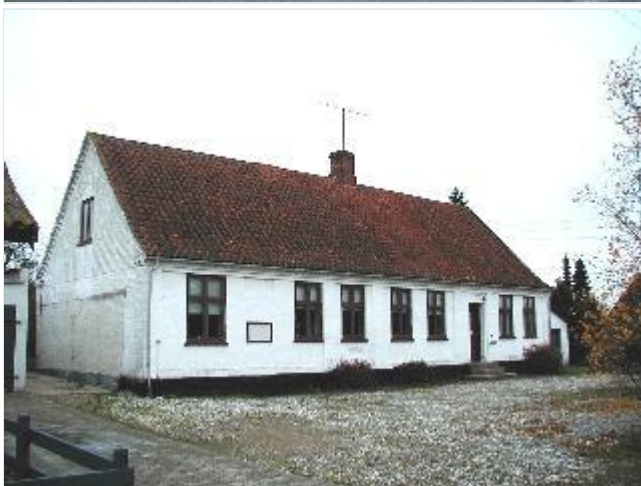
Foto: 11. Den tidligere skole, bygget af Bjergbygårds ejer i 1879 og overdraget til sognet, fra øst Stort billede