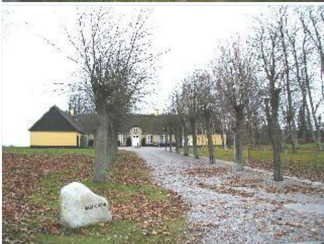
Foto: 4.Den velholdte stråttækte præstegård med allé og grønne omgivelser østligt i landsbyen, fra nord Stort billede