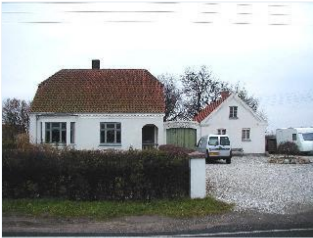
Foto: 13. Ældre villa med værksted i den sydligste del af byen ud til hovedgaden, fra øst