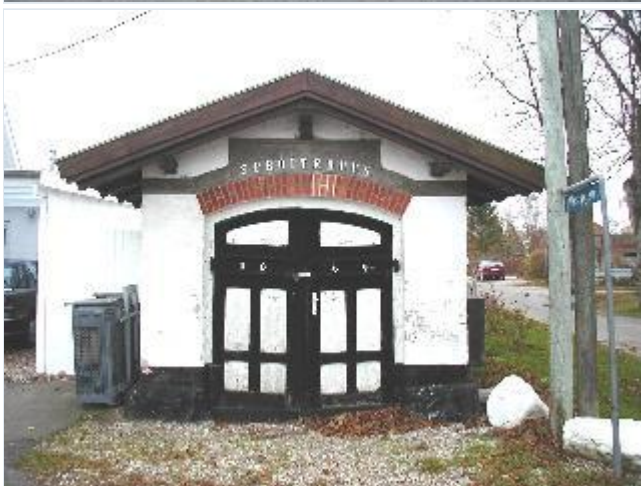
Foto: 19. Den fine lille sprøjtehus fra 1864 ved gadekæret i den vestlige bydel, fra nord Stort billede