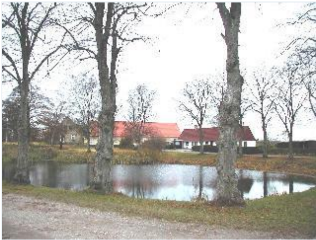
Foto: 17. Gadekæret i den vestlige bydel omgivet af store træer og ældre bygninger, fra sydøst Stort billede