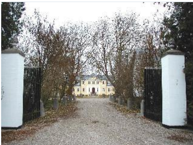
Foto: 1.Hovedgården Bjergbygård i den nordlige udkant af landsbyen, indkørsel, hovedbygning og gårdsplads, fra sydøst Stort billede