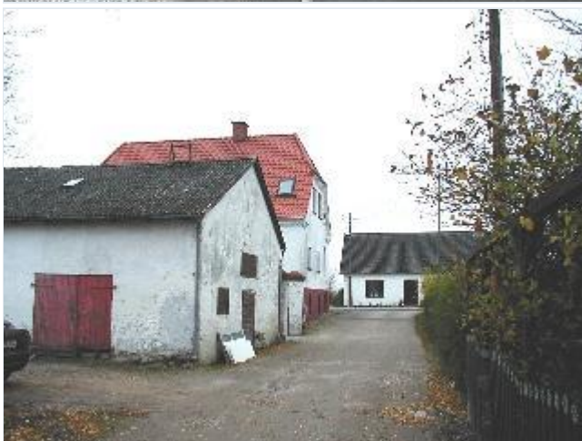
Foto: 15. Værkstedsbygning bag husrækken langs landevejen/hovedgaden, fra nord