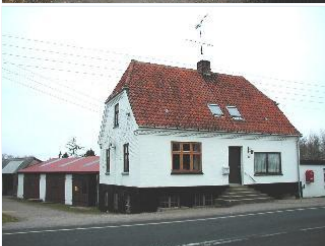
Foto: 16. Solid villa ved hovedgaden med tidligere butik i den nordlige del og garager bag huset, fra øst