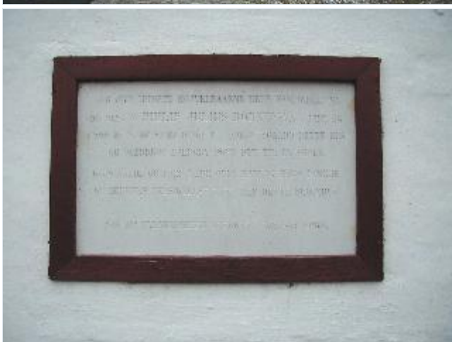
Foto: 12. Mindeplade på skolebygningen fra 1879 Stort billede