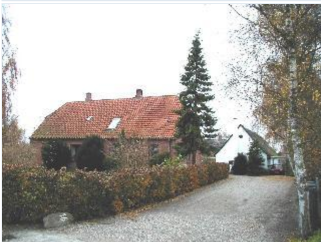
Foto: 22. Firelænget gård med bygninger fra forskellige perioder, stuehus i røde mursten mod strædet, fra øst Stort billede