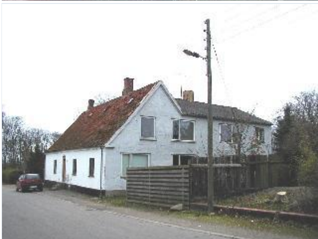
Foto: 8. Hospitalet skråt over for kirken, oprettet i 1783, med store nyere til- og ombygninger, fra vest Stort billede