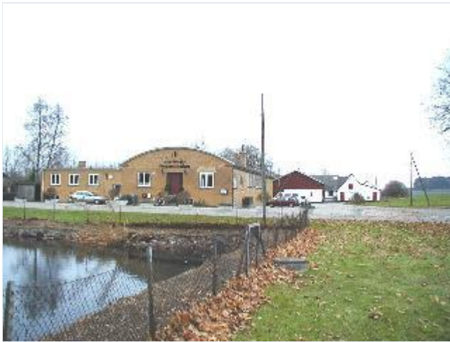
Foto: 5. Gadekæret og Forsamlingshuset fra 1950 samt den østligste gård i landsbyen, fra sydvest Stort billede