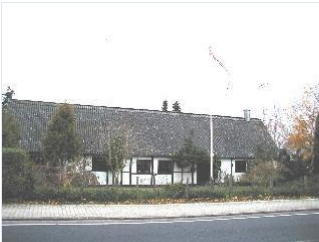
Foto: 10. Langt beboelseshus i bindingsværk (tidligere fattighus) ud til landsbyens nyere hovedgade, fra sydøst Stort billede