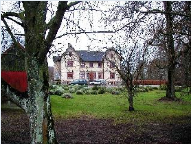
Foto: 7. Hovedbygningen til Sofieholm (tidligere Grøntvedgård) lidt vest for Sofieholm Avlsgård, fra øst Stort billede