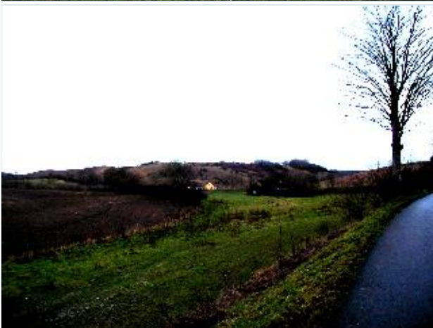
Foto: 3. Lille husmandssted i kanten af overdrevet med de store, grusede bakker, der udnyttes til grusgravning, i baggrunden, fra nordøst Stort billede