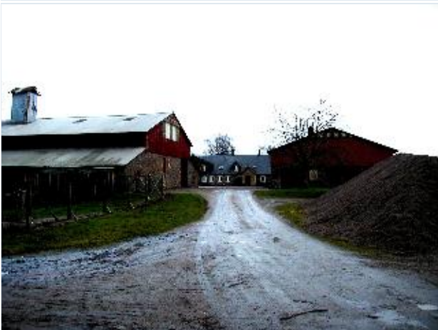
Foto: 8. Sofieholms avlsgård med bygninger opført af kampesten, fra vest Stort billede