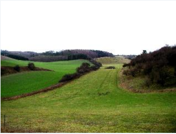
Foto: 1. Dalstrøg i den nordøstlige del af området med tidligere opdyrkede arealer, der er ved at få overdrevskaracteren tilbage, fra øst Stort billede