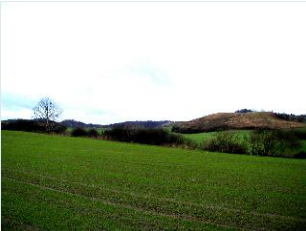
Foto: 2. Overdrevets gamle grænsedige mod øst og overdrevsbakker med forskellig arealanvendelse: ager, opgivet ager og skov, fra nordøst Stort billede