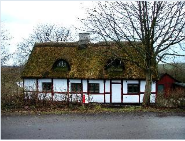
Foto: 5. Lille velbevaret bindingsværkshus i udkanten af overdrevet, fra nord Stort billede