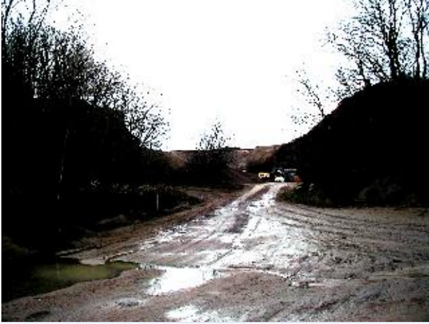
Foto: 6. Den store grusgrav i områdets centrale del ved Sofieholm, fra nord Stort billede