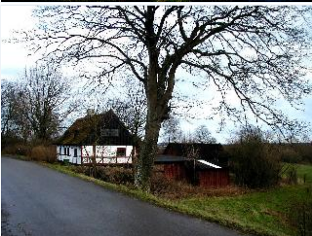
Foto: 4. Lille bindingsværkshus i udkanten af overdrevet, fra vest Stort billede