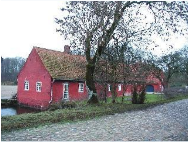
Foto: 6. Avlsgårdslænge ud til voldgraven vest for hovedbygningen, fra øst Stort billede