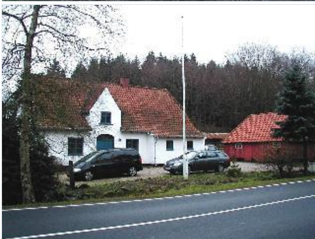
Foto: 10. Skovfogedbolig under Kongsdal i kanten af skovområdet Friheden, fra øst Stort billede