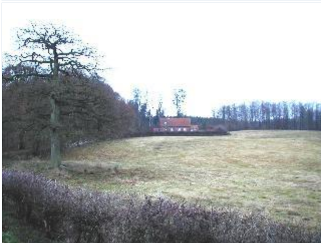
Foto: 9. Kongsdals skovriderbolig i et skovhjørne syd for hovedgårdsanlægget, fra nord Stort billede