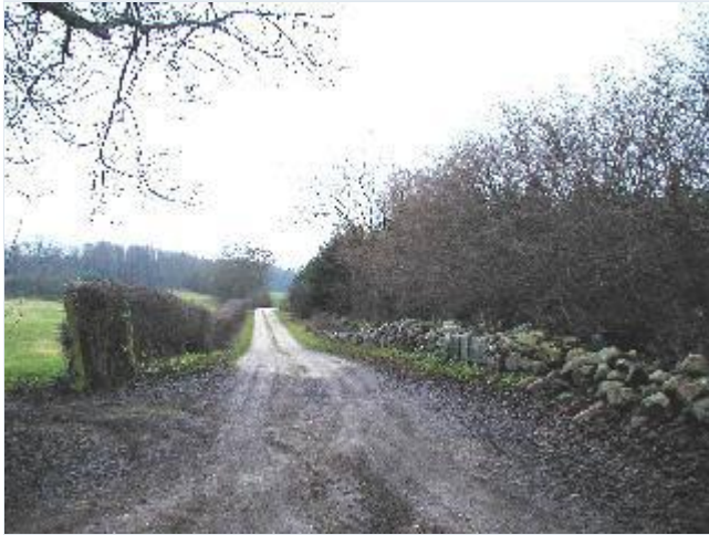
Foto: 8. Markvej mellem stendige med levende hegn og klippet hæk i græsningslandskab syd for hovedgårdsanlægget, fra nord Stort billede