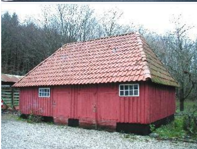
Foto: 11. Velbevaret, rødfarvet udhus til skovfogedbolig, fra øst Stort billede