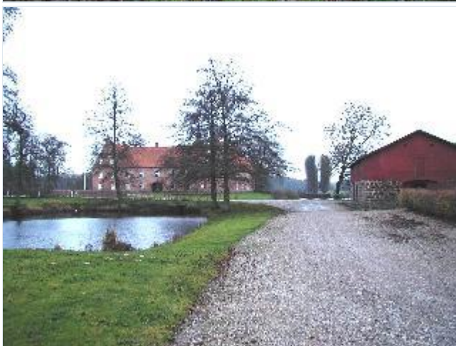
Foto: 3.Kongsdals hovedgårdsanlæg med voldgrave, damme, avlsgård og park med allétræer, fra nord Stort billede