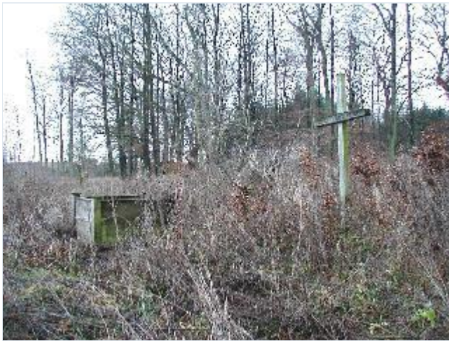
Foto: 12. Brøndkarm, trækors og kildeblok (pengebøsse) ved Hellig Kors Kilde i den sydligste del af hovedgårdens område i kanten af Store Åmose, fra øst Stort billede