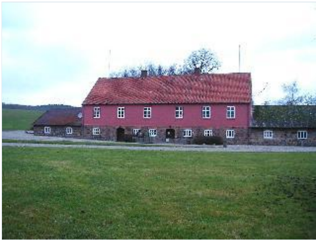
Foto: 5. Den nordligste længe i den tilbageværende del af avlsgårdsanlægget nordvest for hovedbygningen, fra syd Stort billede