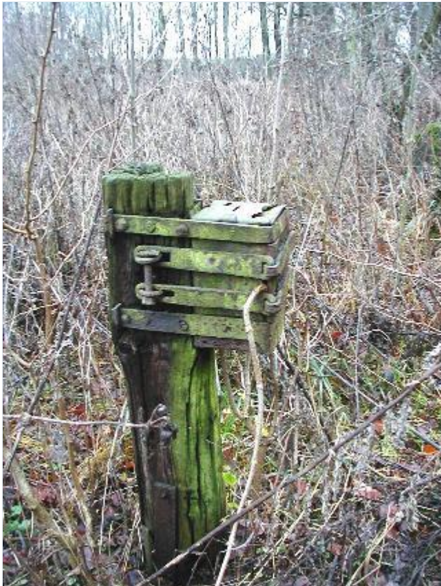
Foto: 13. Tilgroet og frønnet træpæl med Hellig Kors Kildes kildeblok, fra øst Stort billede