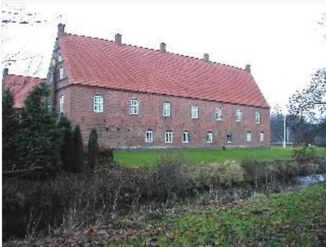
Foto: 2.Hovedbygningens østlige fløj i røde mursten med stort teglhængt tag, fra syd Stort billede