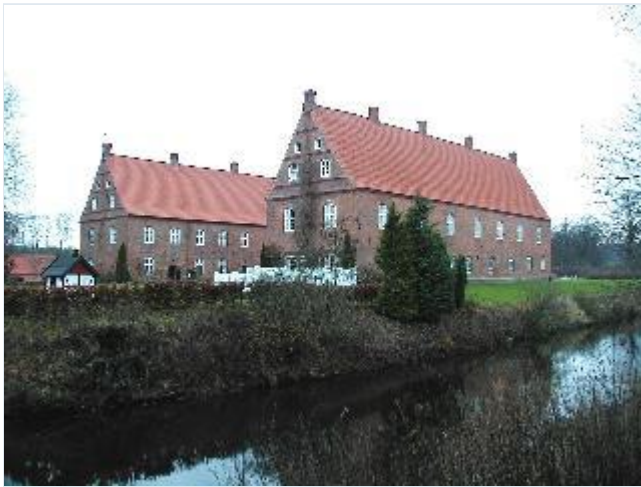
Foto: 1.Kongsdals trefløjede renæssancehovedbygning i to stokværk fra slutningen af 1500-årene på et firsidet voldsted omgivet af voldgrave, fra syd Stort billede