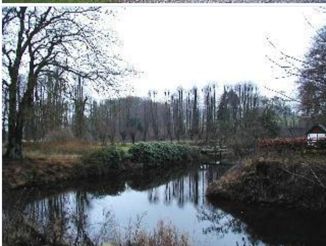
Foto: 4.Kongsdals parkanlæg med klippede lindealléer, plæner, damme m.v., fra nordøst Stort billede