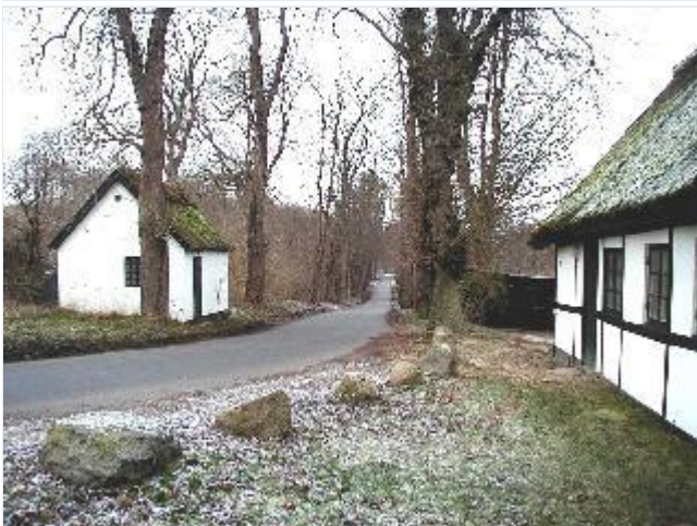
Foto: 4. Lille godshus i bindingsværk (med udhus) på kystskrænten ved den lange allé ned til hovedbygningen, fra syd