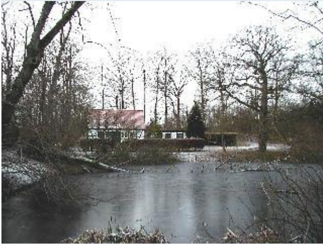
Foto: 2. Lille dam og et af Eriksholms små huse vest for indkørslen til hovedbygningen, fra øst