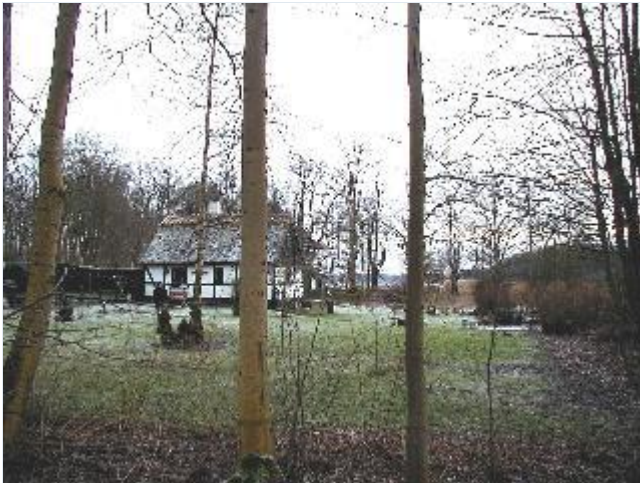
Foto: 3. Lille godshus ved Smedeengen vest for hovedbygningen, fra nord