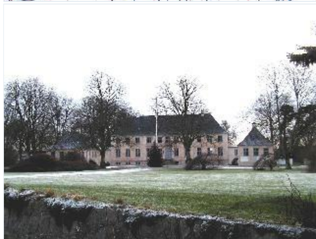
Foto: 1. Eriksholms stilrene, klassicistiske hovedbygning (normalt hvidkalket, her med afbanket murværk) fra 1788 med lave sidefløje i haveanlæg, hvor avlsgården lå indtil 1912, fra nord Stort billede

Foto: Kort: De sorte tal på kortet viser numre på fotografierne og hvor fotografierne er taget fra. Stort billede