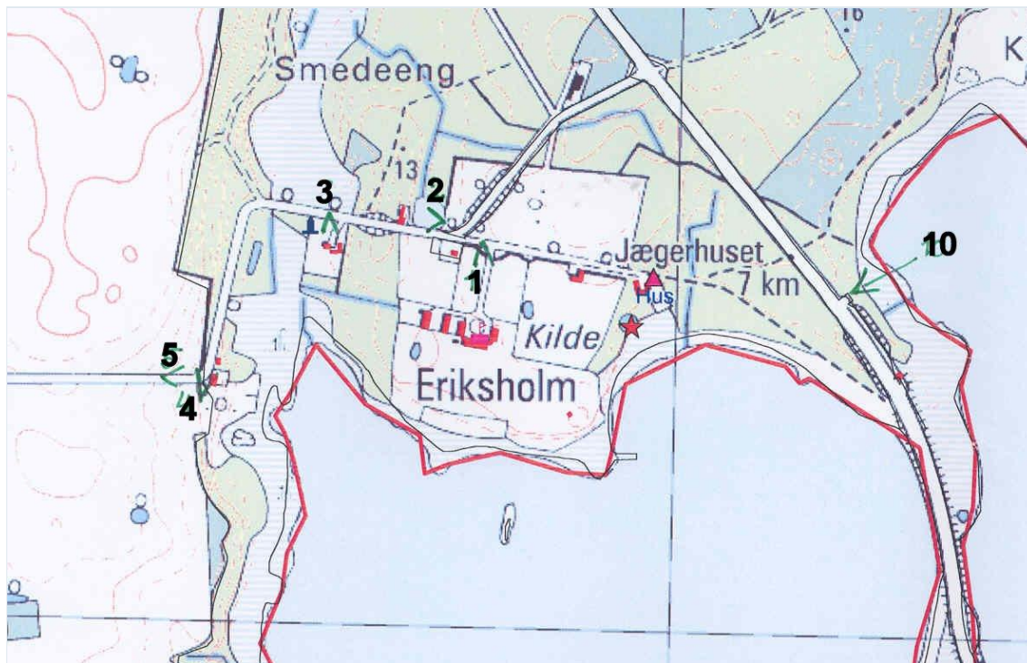
Foto: Kort: De sorte tal på kortet viser numre på fotografierne og hvor fotografierne er taget fra. Stort billede