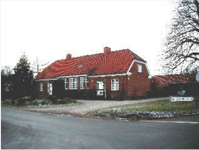
Foto: 7. Den lille skole på Eriksholms jorder omtrent midtvejs mellem Bredetved og husmandsstederne på Eriksholmmark, fra øst