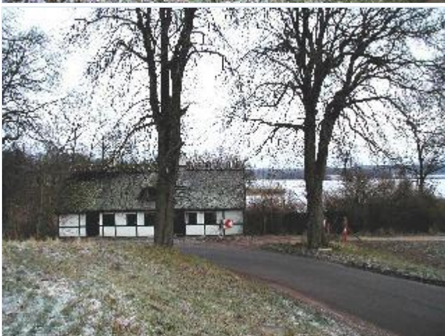
Foto: 5. Huset på kystskrænten med vid udsigt over Tempelkrog og Munkholm, fra vest