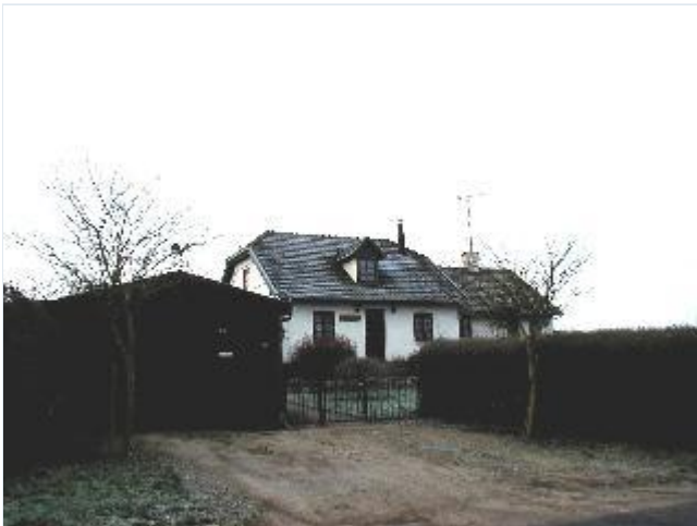
Foto: 8. Et ad Eriksholms tidligere huse, Tranebjerg Hus, på Ågerupvej, fra sydøst