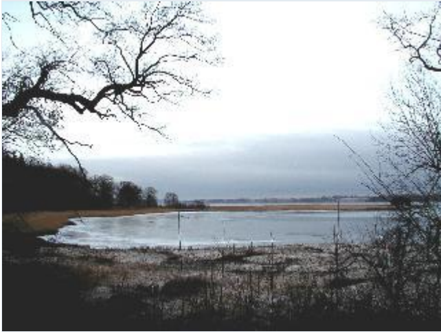
Foto: 10.Kysten nordøst for hovedgårdsanlægget med fredede skovbryn og strandenge på Kalveholme, fra sydvest Stort billede