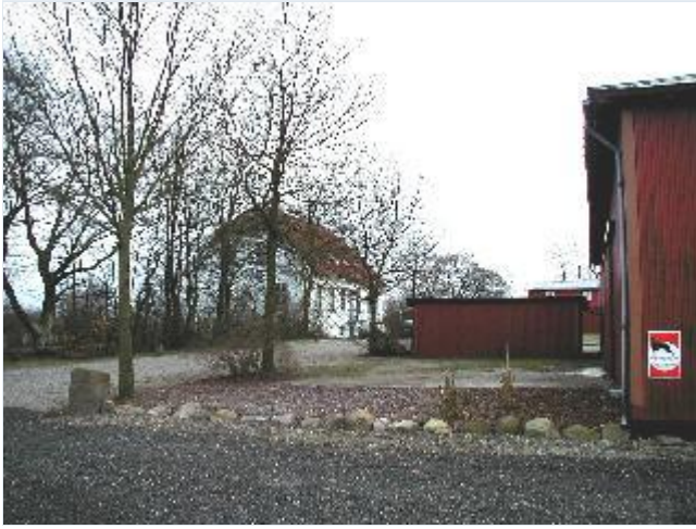
Foto: 6. Eriksholms avlsgård, der fra hovedgårdsanlægget blev flyttet op på markjorderne i 1912. Hovedbygningen er i tidlig "Bedre Byggeskik"-stil, fra nord