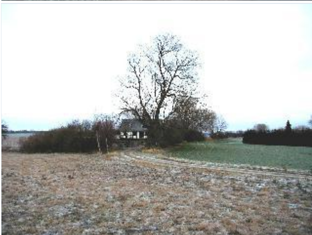
Foto: 9. Lille tidligere ledhus i hjørnet af Eriksholms jorder nærmest Arnakke, hovedgårdsdiget med træ- og buskbevoksning løber videre mod øst, fra vest