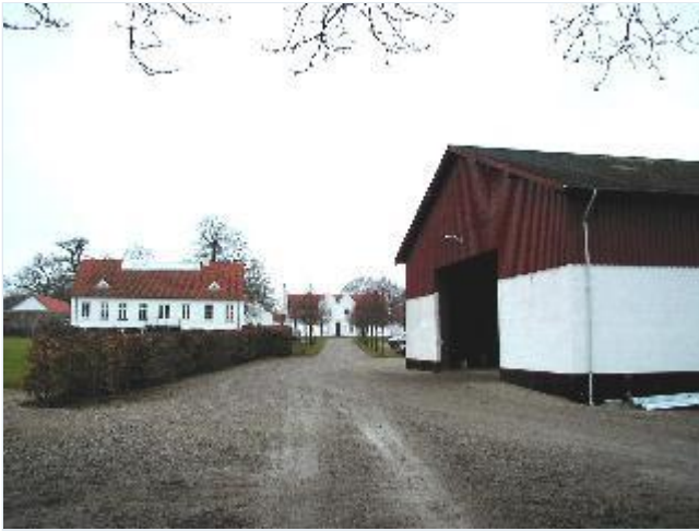
Foto: 2. Indkøslen til Dønnerup med hovedbygning, funktionærbolig og lade, fra øst Stort billede