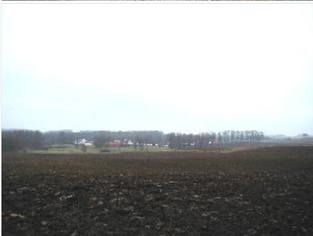
Foto: 4. Hovedgården Dønnerup i sit herregårdslandskab, fra syd Stort billede