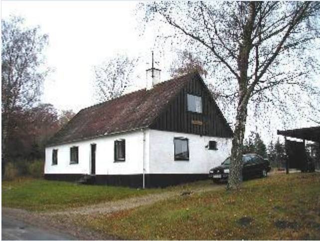
Foto: 5.Lille godshus, Hejrehus, i skovkanten, fra sydøst Stort billede