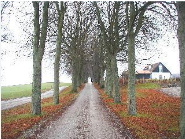
Foto: 3. Alléen fra Dønnerup til Dønnerupvej, fra vest Stort billede