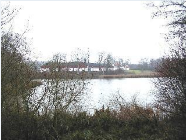
Foto: 1. Dønnerups bygningskompleks med hovedbygning (bag avlsgården) og avlsgård ved søen Gulemose, fra nordøst. Stort billede