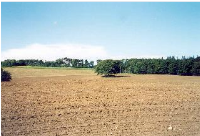
Foto: 4: Herregårdslandskabet nordvest for Astrup. Set fra landevejen. Stort billede