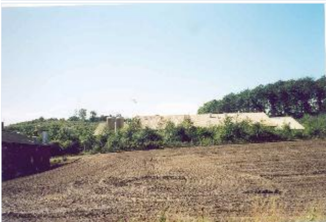
Foto: 5: Avlsgården til Astrup gemmer sig i en lavning i landskabet. Set mod nordvest. Stort billede