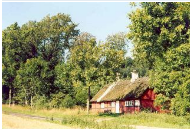
Foto: 1: Rødmalet skovarbejderhus, kaldet "Pyromanens hus", i Skovhave ud til vejen mellem Kongens Mølle og Astrup.